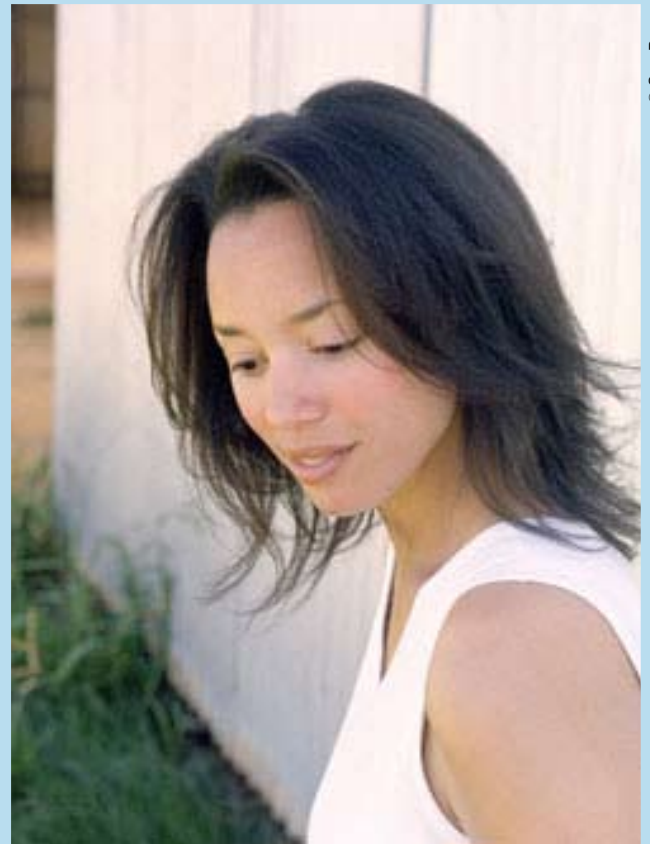
Clea Koff, antropóloga forense.

Antropóloga forense, Clea Koff publicó en 2004 “El lenguaje de los huesos”, diario de siete misiones que efectuó por cuenta de la ONU en Rwanda, Bosnia, Croacia y Kosovo. Gracias a sus investigaciones se pudo conducir a varios criminales ante la justicia.