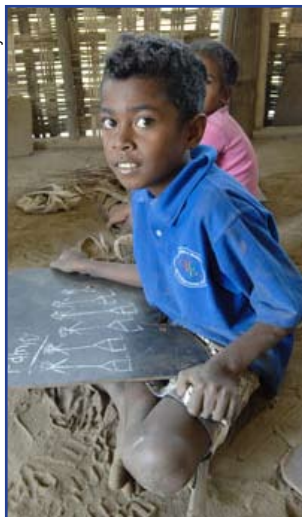
En Papua Nueva Guinea se hablan más de 800 lenguas. Los niños pueden iniciar su escolaridad en su lengua materna.