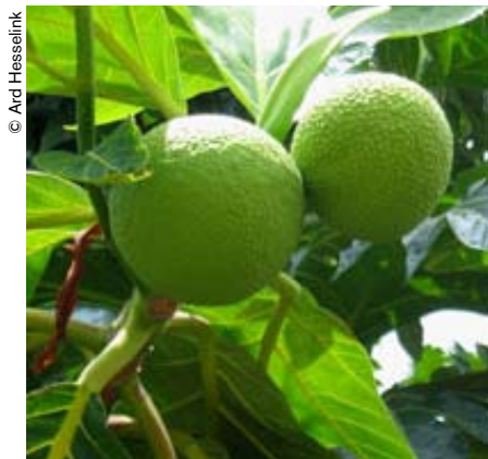
El único objetivo de la expedición del Bounty era recoger frutos de estos árboles para transportarlos hasta las Antillas.

A finales del decenio de 1840, el gobierno británico decidió clausurar la colonia penitenciaria establecida la isla de Norfolk, situada lejos de Pitcairn, en Melanesia. Pocos años más tarde, el 8 de mayo de 1856, los 193 pitcairneses, que contaban con una legislación y lengua propias, embarcaron a bordo del Morayshire para instalarse en Norfolk, a cuyas costas arribaron justo un mes después.