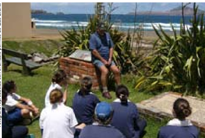
Curso de lengua norfolk junto a una placa conmemorativa de la primera vez que se estableció una colonia, en 1788.