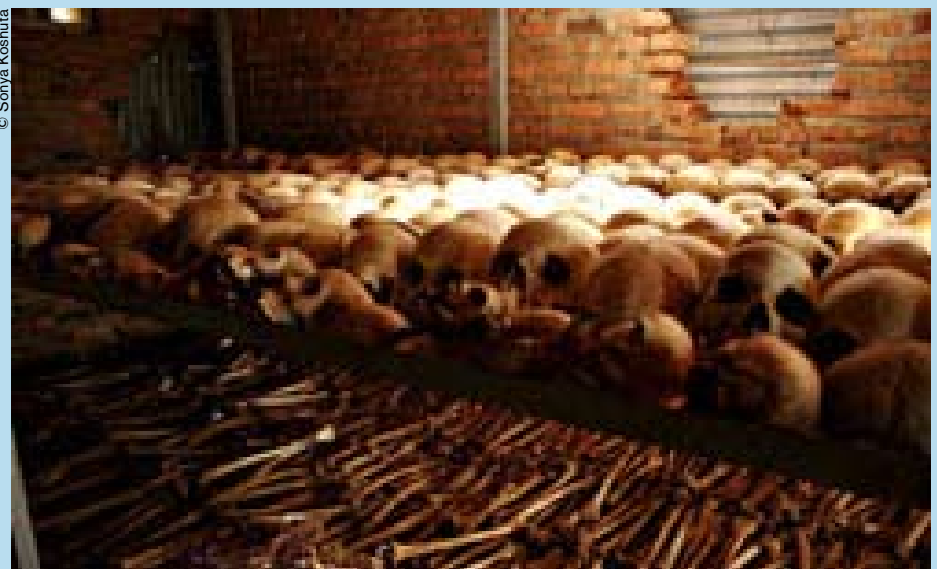
Testimonio del genocidio en Rwanda.

Creo que si se ocultaron esas tumbas es porque los asesinos sabían pertinentemente que correrían muchos riesgos si se descubriera que no se trataba de actos violentos espontáneos, sino de masacres organizadas para eliminar un grupo particular de una región particular.