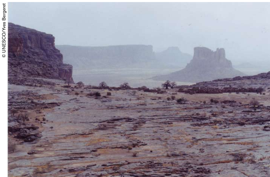
Para los habitantes de Koyo, la cima de la montaña encarna la palabra en toda su fuerza. El poder de la palabra se debilita a medida que se baja la pendiente.