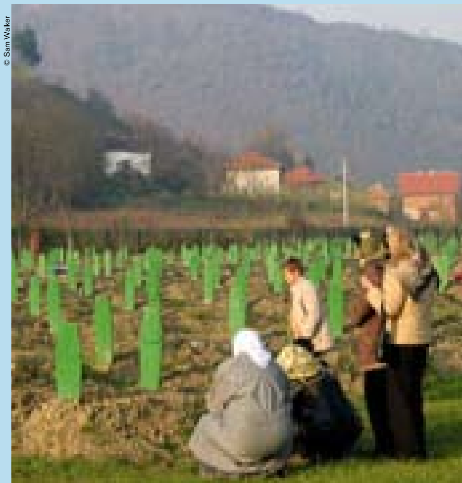
Bosnia y Herzegovina: una familia visita el Memorial de Potocari, donde reposan víctimas de las masacres de Srebrenica (1995).

Para Clea Koff, "en tiempo de paz como en tiempo de guerra, una desaparición es una desaparición". En la actualidad sus conocimientos y su experiencia ante allegados de difuntos exhumados en Rwanda o en la ex Yugoslavia inspiran su labor al servicio de las familias de desaparecidos en Estados Unidos.