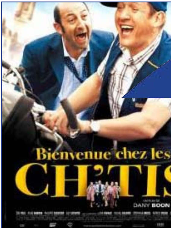
Cartel de la película "Bienvenidos al Norte".

La película francesa "Bienvenue chez les chtis" ha hecho reír mucho a los europeos en estos últimos tiempos. Sin embargo, la situación de la lengua de los chtis, habitantes de la región francesa de Picardía, es mucho menos regocijante. En efecto, el chtimi, dialecto del picardo hablado en esa parte del norte de Francia, se ha convertido en un factor de estigmatización social y, en el mejor de los casos, en un elemento folclórico.