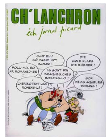
Portada de la versión picarda del cómic Asterix: en Francia se editan versiones de Asterix en seis lenguas regionales.