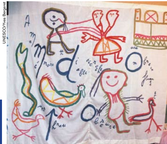
Según la tradición, la cobra es guardiana de la lengua toro tegu, que se habla en el territorio dogón (Mali).

La piedra es palabra mineralizada, el agua es palabra reidora, el grano plantado es palabra promesa: la lengua toro tegu, hablada en la actualidad por cinco mil dogón en el norte de Mali, concibe cada elemento de lo real como su parte integrante.