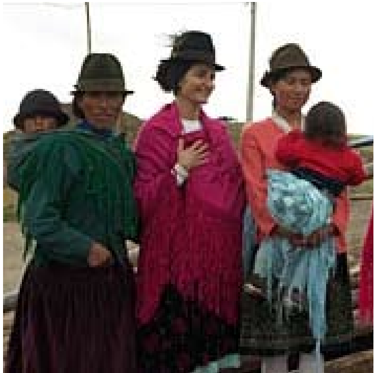
Comunidad de locutores de quichua en Cotopaxi (Ecuador).