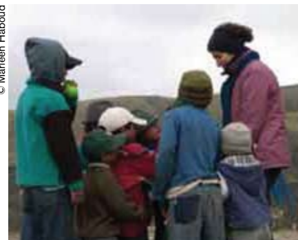
La transmisión de una lengua a los más pequeños es fundamental para su supervivencia.