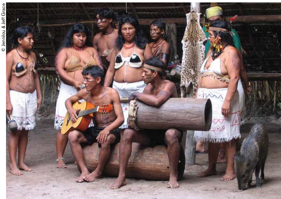
Amazonia (Brasil): varias lenguas indígenas están desapareciendo. Hasta mediados del siglo XVII, el tuli, por ejemplo, estaba tan extendido como el portugués.

Paralelamente, los redactores encargados de las diferentes partes y yo, personalmente, hemos supervisado la preparación de los textos. La totalidad del proyecto se ha podido llevar a cabo en un lapso de tiempo muy apretado: un año tan sólo desde su inicio hasta su culminación