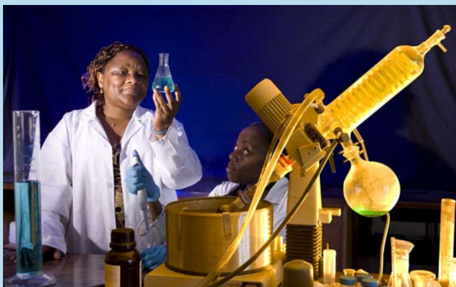
Tebello Nyokong (Sudáfrica)

La asociación entre L'ORÉAL y la UNESCO abarca también un programa de becas destinadas a científicas jóvenes que realizan trabajos de investigación posdoctorales, con vistas a permitirles su prosecución en laboratorios situados fuera de sus países de origen. El programa L'OREAL-UNESCO "La Mujer y la Ciencia" ha otorgado hasta la fecha 120 becas internacionales y 340 nacionales a mujeres que cursan estudios de doctorado y posdoctorado. Cada una de las becas está dotada con una suma de 40.000 dólares y se concede por una duración de dos años a 15 jóvenes, a razón de tres por cada una de estas cinco partes del mundo: África y Estados Árabes; Asia y el Pacífico; América del Norte y Europa; y América Latina.