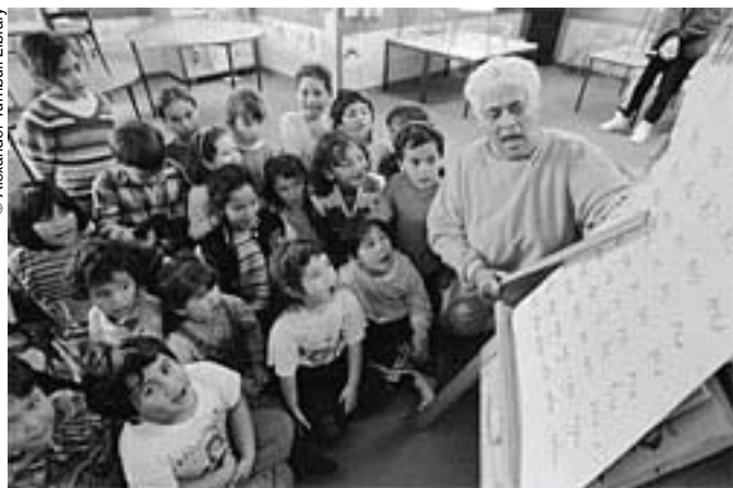
En Nueva Zelanda existen "nidos lingüísticos" donde se transmite la lengua maorí a los más jóvenes..