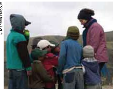
La transmisión de una lengua a los más pequeños es fundamental para su supervivencia.