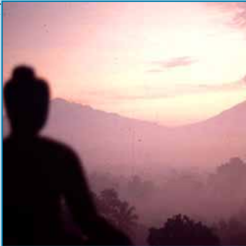
Vista del sitio de Borobudur, Indonesia.

La idea de crear un movimiento internacional para proteger los sitios en otros países surgió después de la Primera Guerra Mundial. La Convención sobre la Protección del Patrimonio Mundial Cultural y Natural nació de la asociación de dos movimientos: la preservación de los sitios culturales y la conservación de la naturaleza.