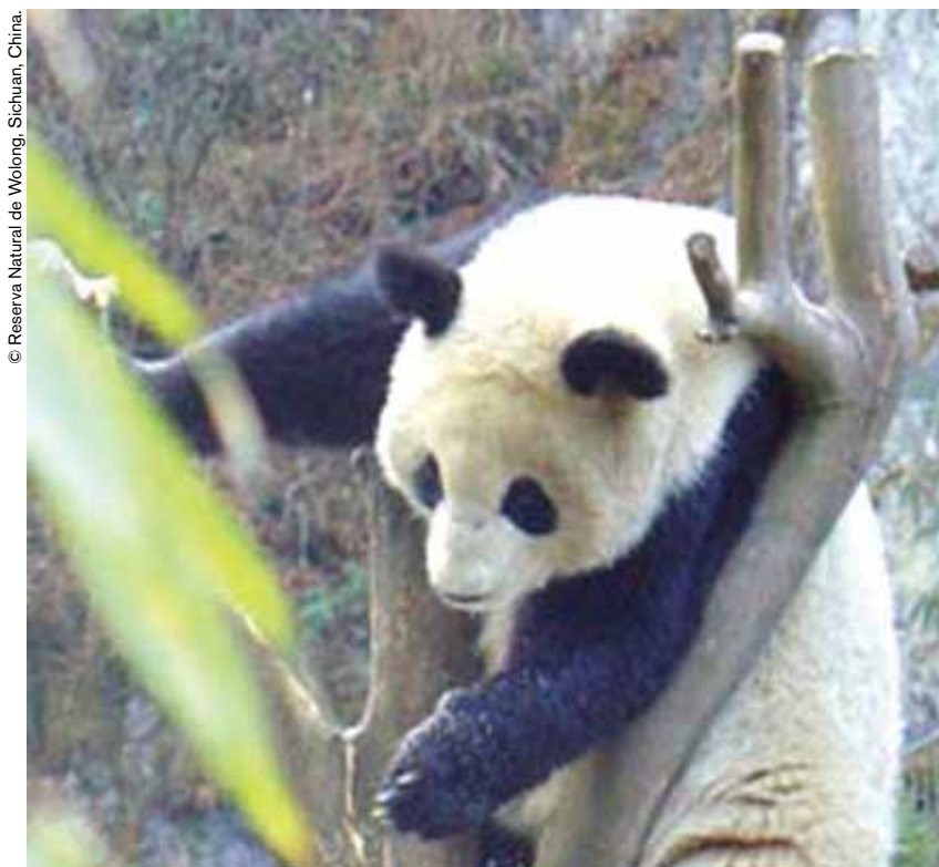
© Reserva Natural de Wolong, Sichuan, China.