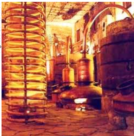
Alambiques en San José del Refugio, Jalisco, México.

Por eso, el buen bebedor de tequila no apura el trago. Lo disfruta en su equipal o en cualquier asiento cómodo que bajo la fresca sombra de algún patio o terraza invite a la conversación pausada. No tiene prisa porque sabe que el tequila de su copa concentra muchos años. Lo