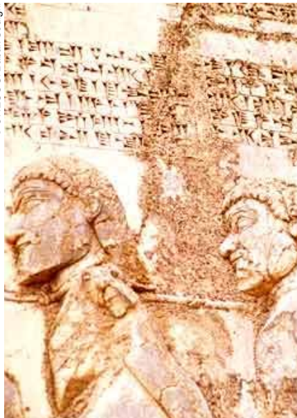
Bajorrelieve de Behistún (República Islámica de Irán).

les son mayoría. Actualmente hay 644 sitios culturales, frente a 162 naturales y 24 mixtos (culturales y naturales). En el rubro cultural, figuran desde este año los bajorrelieves de Behistún (República Islámica de Irán). El más célebre de estos bajorrelieves, esculpido en lo alto de una pared rocosa, fue realizado en el 521 a. de J.C. por Darío I el Grande por orden del rey aqueménide. Con esta obra, el monarca quería celebrar así la victoria contra uno de sus adversarios. Una inscripción en elamita, neobabilonio y persa antiguo recorre el fresco y supone el único texto de un rey aqueménide relativo a un acontecimiento importante de su reinado.