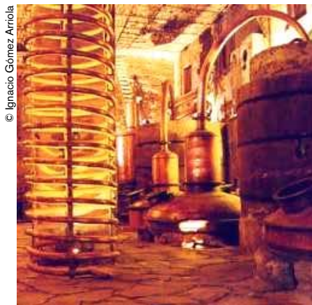
Alambiques en San José del Refugio, Jalisco, México.

Por eso, el buen bebedor de tequila no apura el trago. Lo disfruta en su equipal o en cualquier asiento cómodo que bajo la fresca sombra de algún patio o terraza invite a la conversación pausada. No tiene prisa porque sabe que el tequila de su copa concentra muchos años. Lo