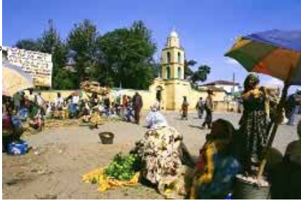
Mercado de caballos de Harrar.

venientes de los “montes abisinios” del oeste y de los establecimientos del Golfo de Adén. A comienzos del siglo XX, la línea de ferrocarril Addis Abeba-Djibuti señalará la declinación de la ciudad.