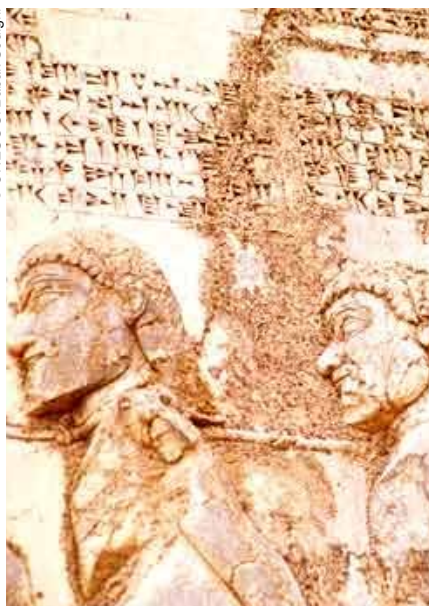
Bajorrelieve de Behistún (República Islámica de Irán).

les son mayoría. Actualmente hay 644 sitios culturales, frente a 162 naturales y 24 mixtos (culturales y naturales). En el rubro cultural, figuran desde este año los bajorrelieves de Behistún (República Islámica de Irán). El más célebre de estos bajorrelieves, esculpido en lo alto de una pared rocosa, fue realizado en el 521 a. de J.C. por Darío I el Grande por orden del rey aqueménide. Con esta obra, el monarca quería celebrar así la victoria contra uno de sus adversarios. Una inscripción en elamita, neobabilonio y persa antiguo recorre el fresco y supone el único texto de un rey aqueménide relativo a un acontecimiento importante de su reinado.