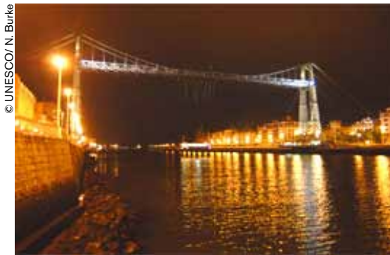
El Puente de Vizcaya, País Vasco (España).

tiempo la navegación de barcos. El ingeniero Martín Alberto de Palacio y Elissague diseñó el primer puente del mundo provisto de una barquilla transportadora.