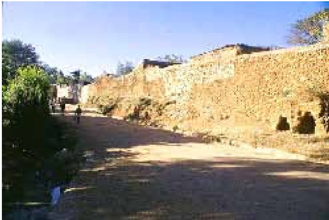
La muralla o 'jugol' de Harrar.

Ubicada a más de 1.800 m de altura, la ciudad está rodeada de una muralla fortificada de cuatro metros abierta en cinco puntos o puertas. En su interior, una urdimbre de 362 callejuelas bordeadas de casitas tradicionales por las que circulan con dificultad viejos y fatigados automóviles. Bienvenidos a Harrar, a unos 500 km al este de Addis Abeba, la capital etíope. Menos conocida que otras ciudades del país, como Axum, Lalibela o Gondar, Harrar es “uno de los raros ejemplos de ciudad preindustrial aún intacta”, destaca Jara Hailé Mariam, responsable de la Autoridad de Investigación y Conservación del Patrimonio Etíope. Atestiguan su afirmación las rumorosas máquinas de coser que ronronean durante el día en el barrio de los sastres o las forjas enrojecidas agrupadas en el barrio que bordea la puerta de Buda.