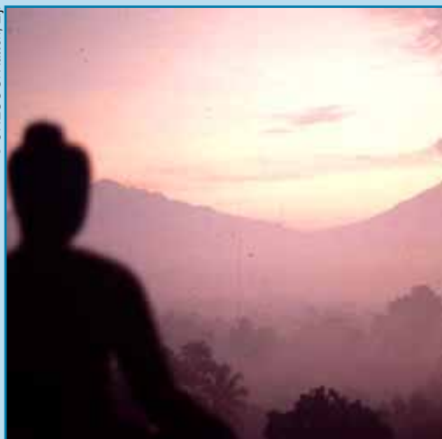
Vista del sitio de Borobudur, Indonesia.

La idea de crear un movimiento internacional para proteger los sitios en otros países surgió después de la Primera Guerra Mundial. La Convención sobre la Protección del Patrimonio Mundial Cultural y Natural nació de la asociación de dos movimientos: la preservación de los sitios culturales y la conservación de la naturaleza.