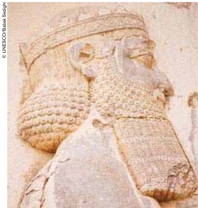
Bajorrelieve de Behistún, República Islámica de Irán.

Sin embargo, cuando pienso en Behistún, me viene antes que nada a la mente un recuerdo muy vívido y personal. Fue en 1965. Había cerrado los ojos, apretando los párpados porque el polvo me acababa de nublar la vista, mis dedos se habían aferrado a dos minúsculas concavidades de la pared rocosa, mis piernas estaban colgando en el vacío y me estaba dando cuenta perfectamente de la gran distancia que mediaba entre mi cuerpo y el suelo que tenía a mis pies. Ustedes