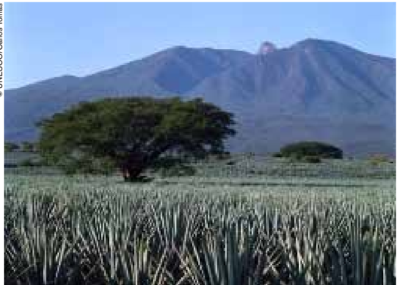
Un mar de agave recorre los valles de Jalisco.

Es un mar de agaves que se extiende generoso desde las faldas del majestuoso cerro de Tequila hasta los linderos que dan paso a la profundidad de la barranca del río Santiago.