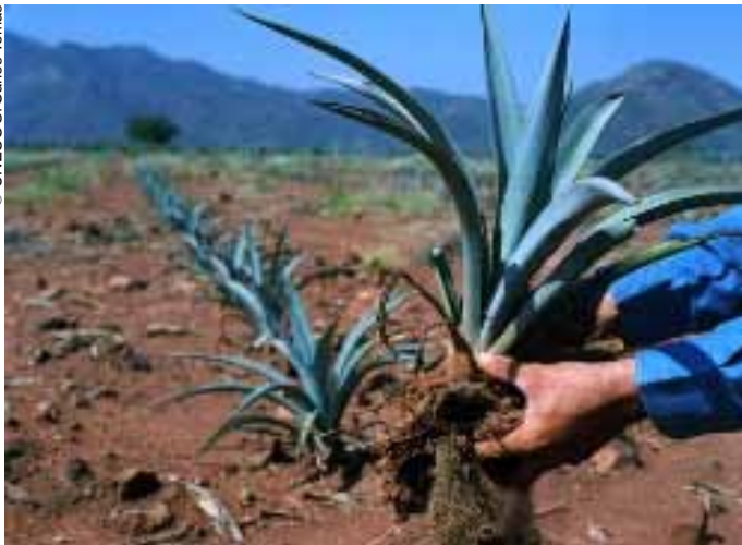
El agave es una planta espinosa.

líneas limpias y bien definidas. Se convierten en el extenso manto de pencas puntiagudas que recoge pacientemente los rayos del sol para transformarlos primero en azúcar y, después con la mano del hombre, en tequila.