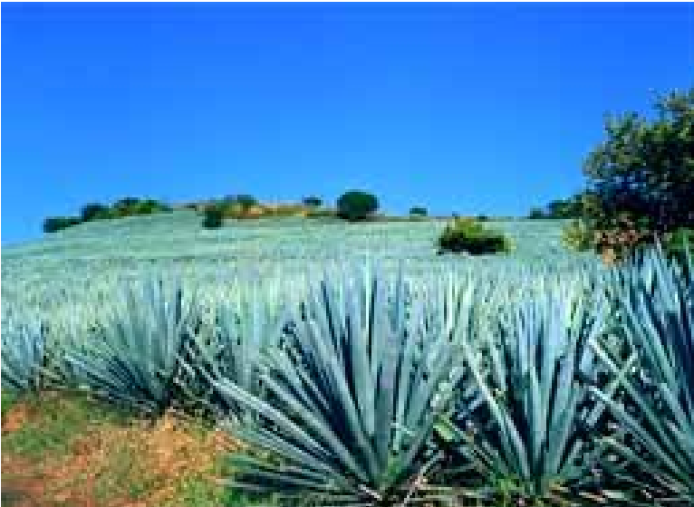
Campos de agave en Jalisco (México).

D ara los cultivadores de agave de los valles de Jalisco, en México, la noticia pasará quizás desapercibida y lo que es seguro es que no afectará a la cosecha de la piña de la que se extrae el tequila. Sin embargo, desde el 12 de julio, el pasiaje del agave y las antiguas instalaciones industriales de Tequila figuran en la Lista del Patrimonio Mundial de la UNESCO.