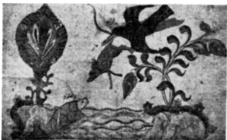
Una ilustración tomada de un viejo manuscrito persa "Bodpai Fable", que se conserva en la Biblioteca Nacional de París.