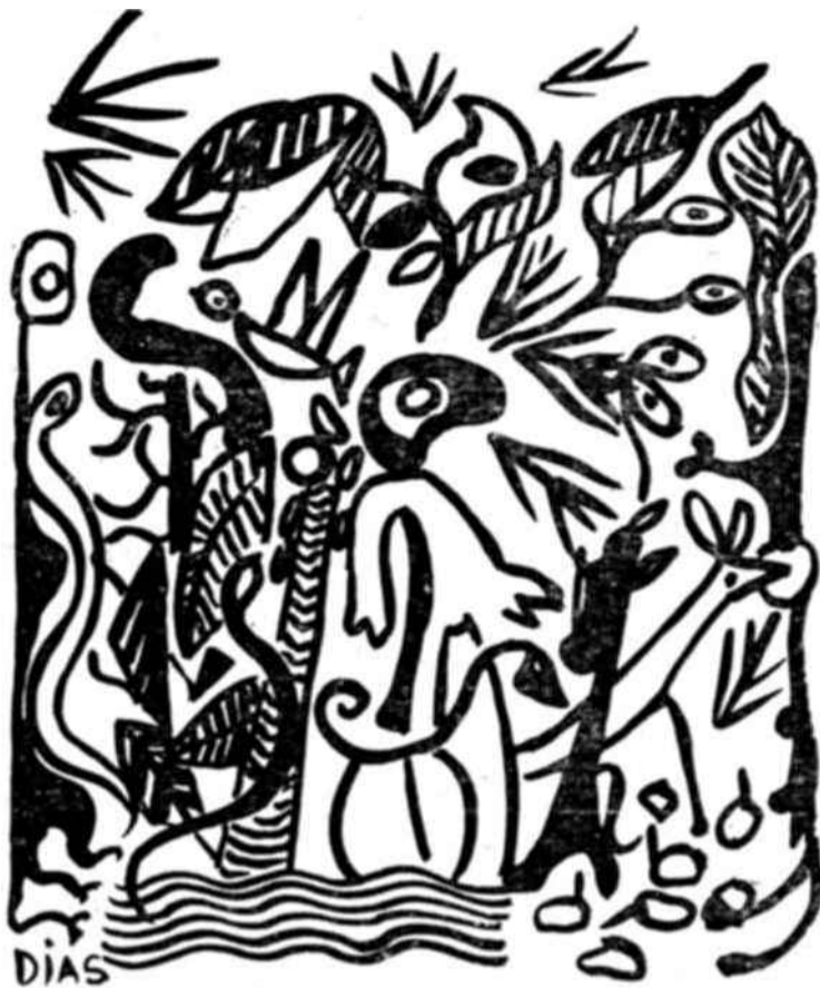
Un motivo de pintura brasileña contemporánea sobre el Amazonas.