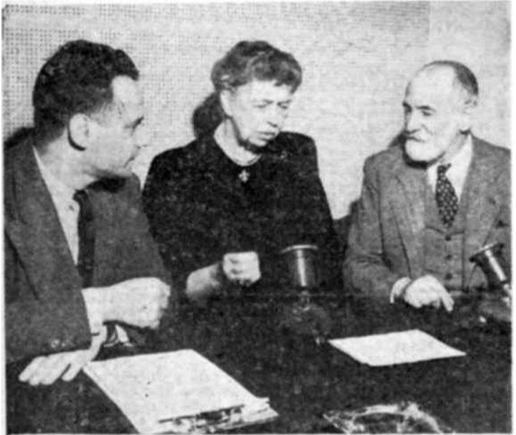
La Señora Eleanor Roosevelt y Mr. René Cachin, relatan sus impresiones ante el micrófono de las N.U.

IMPRIMERIE DU NEW YORK HERALD TRIBUNE 21, Rue de Berri - Paris 8e