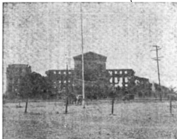
La Universidad de Filipinas, es una prueba del grado de destrucción sufrido por las islas, durante la guerra.

En todas partes el Director General fué recibido con la más calurosa simpatía y pudo asegurarse de la buena voluntad y del entusiasmo que provoca el trabajo de la Unesco.