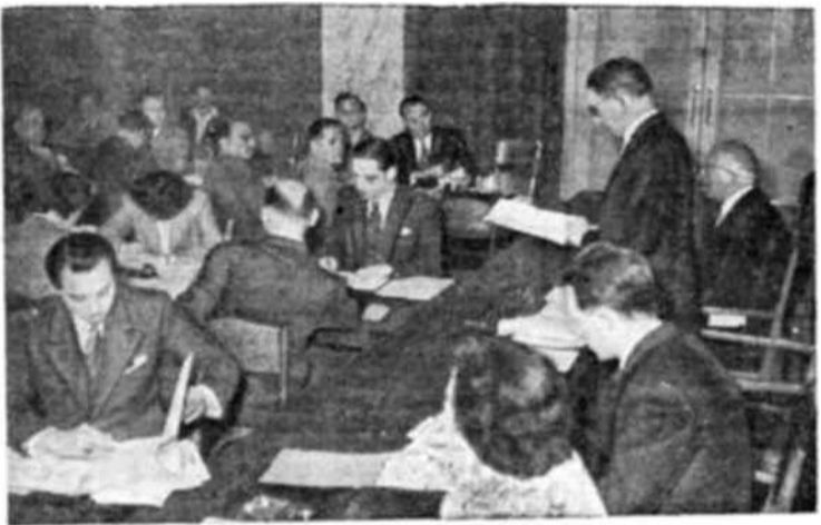
En la Conferencia de la Instrucción pública en Ginebra los países han expuesto sus avances de tipo escolar.

La Conferencia acordó por unanimidad rendir homenaje al pedagogo francés Marc-Antoine Julien (1775-1848), a quien se considera precursor de la técnica y organización de la pedagogía comparada.