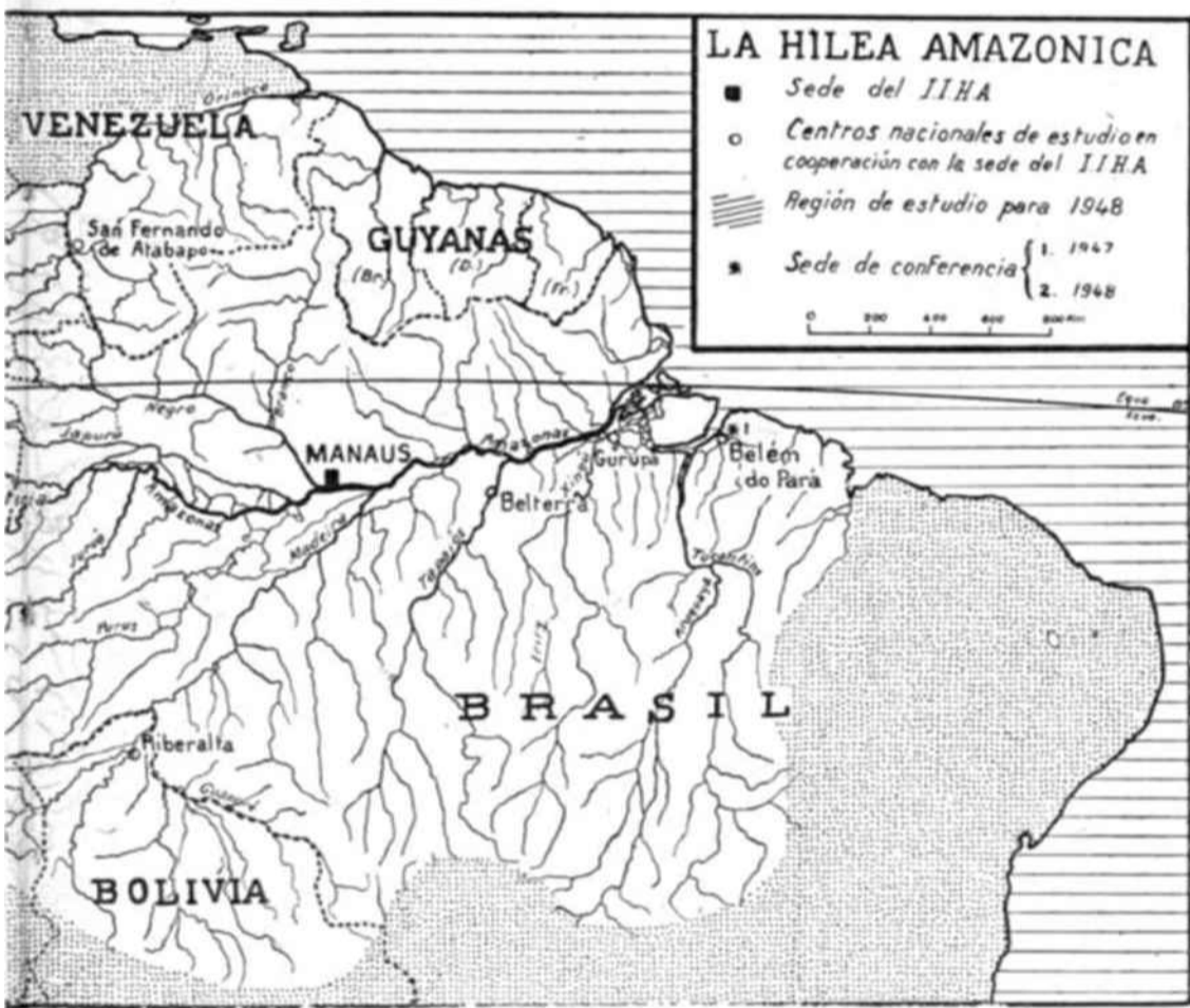
Intercambio de información