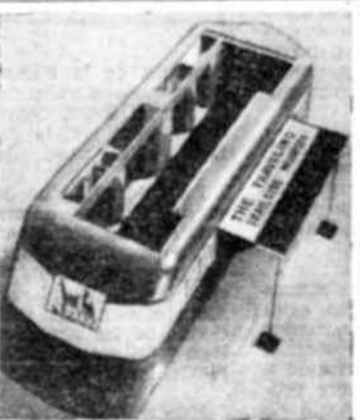
Museo móvil de los EE. UU. exhibido en París durante el pasado Congreso.

En esta tarea de adquirir el conocimiento de sí mismo y de la sociedad, la sociología — o la ciencia de la humanidad — ha de desempeñar un papel decisivo. Un signo esperanzador lo constituye hoy el grado que alcanza la caída de las fronteras que separan estas ciencias ante el desafío general que se las opone. Los sociólogos pueden ayudar a demostrar a los pueblos de todos las naciones que la libertad y el bienestar de cada una de ellas están en definitiva, ligados a la libertad y al bienestar de todas las demás, que el mundo no necesita seguir siendo un lugar en que los hombres forzosamente han de matar o morir y que los esfuerzos realizados en beneficio de nuestra propia colectividad puedan hacerse compatibles con los esfuerzos generales en beneficio de la humanidad.