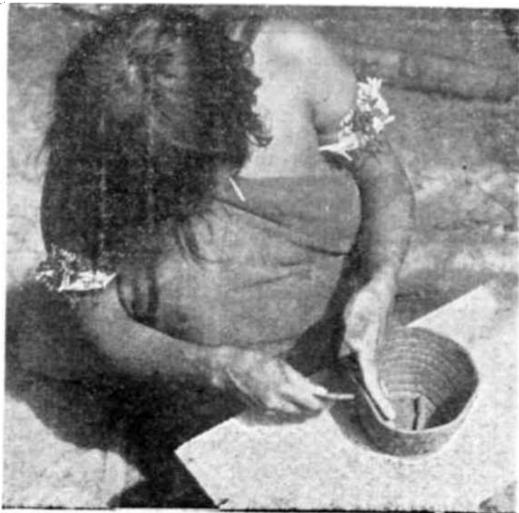
La cerámica primitiva constituye una de las industrias clásicas del Amazonas.

En Iquitos, el Comité Científico y del Programa de la Conferencia recomendó insistentemente a la Unesco que emprendiese como parte de sus actividades de 1948, la experiencia de un estudio "en equipo" de una zona geográfica