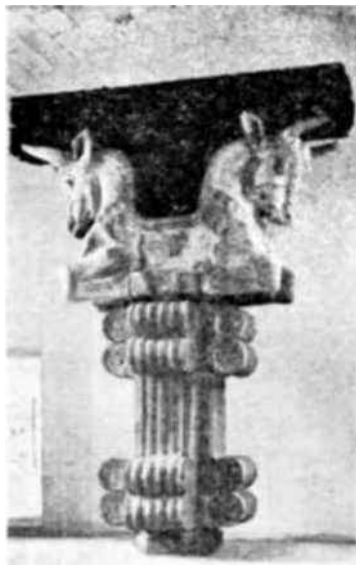
El museo del Louvre, conserva ejemplares magníficos del antiguo Oriente. La revista Museos, acaba de reproducir uno que procede de la galería de Suza, capital del Imperio de Agamenón.

Este papel desempeñado por los cristianos de lengua siríaca, representantes de los cuales encontramos en Beirut los miembros de la Unesco en maronitas del Líbano, en nada disminuye la importancia del mundo árabe en la transmisión de la herencia antigua. Sin él, el inmenso trabajo realizado por sus maestros, los sirios de Mesopotamia, se hubiera quedado en letra muerta, hundida en una lengua que apenas fué conocida en Occidente con anterioridad al Renacimiento del siglo XVI.