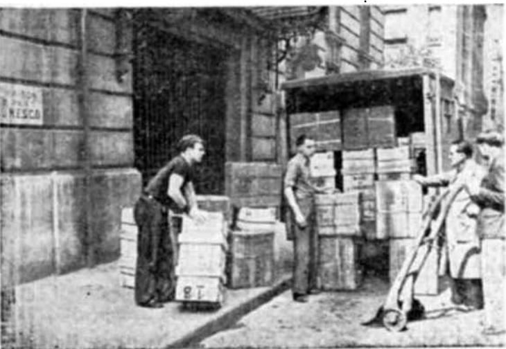
Envío de libros a las bibliotecas saqueadas por la guerra. La Casa de la Unesco desarrolla actividades cada vez más importantes como centro de envío de materiales destinados a la reconstitución cultural.

Sería preciso, por consiguiente, que este artículo terminase con la formulación de las muy sinceras gracias dirigidas a todos los amigos que el encargado de encuesta ha hallado en su camino, a todos aquellos a quienes ha atormentado con sus preguntas, y a todos los que le han respondido con un cuidado y una atención que la publicación de la encuesta destacará claramente.