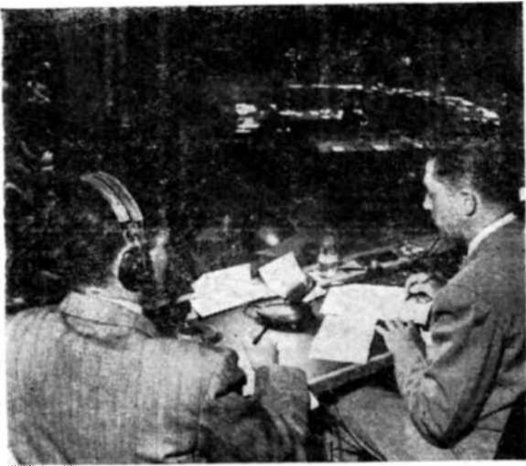
Desde la cabina de radio de las N.U. los corresponsales preparan sus crónicas siguiendo el curso de las sesiones de Lake Success.

Se estimó en aquella época que más de 200 millones de personas habían escuchado este programa, y que su auditorio fué uno de los más amplios que jamás tuviera otro programa aislado. Norman