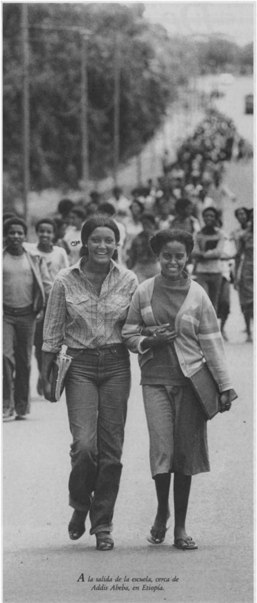
A la salida de la escuela, cerca de Addis Abeba, en Etiopía.