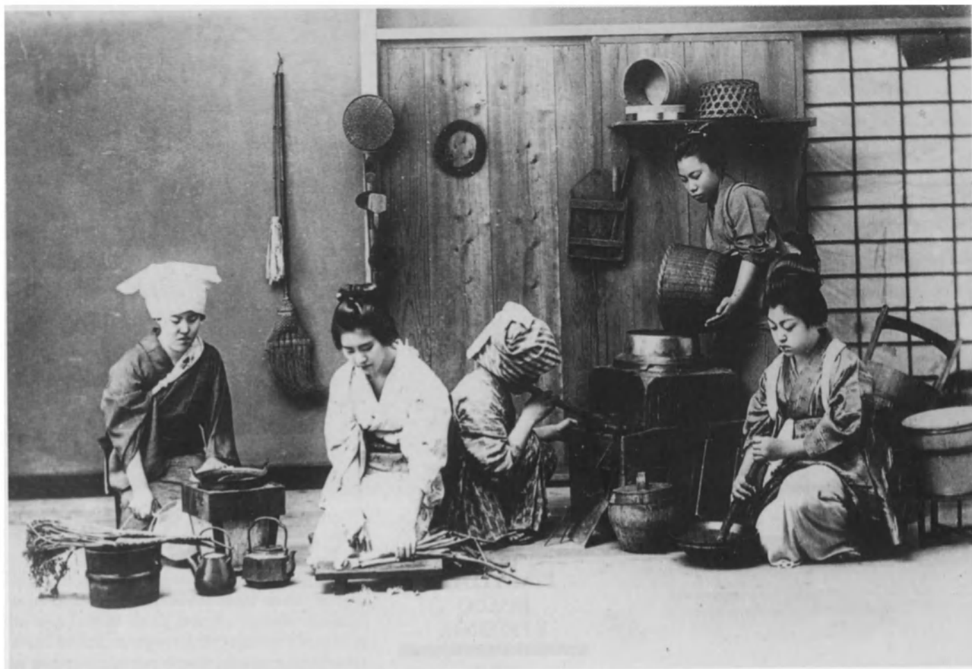
Foto de los años treinta que representa a un grupo de mujeres japonesas preparando la comida familiar.

Como contrapartida, el jefe de familia no está exento de responsabilidades; puede ser destituido si se muestra incapaz de administrar el patrimonio. Así, las "Instrucciones para el jefe de familia" de un vendedor de kimonos de Kyoto precisan: "Ni siquiera el jefe de familia puede descuidar su trabajo levantándose tarde, saliendo con frecuencia por las noches o entregándose a los juegos de azar. En caso de que así ocurra, los empleados de más edad, que son responsables, deben informar a los parientes. Tras una evaluación del capital y de los bienes familiares, el jefe de familia recibirá una compensación y deberá abandonar la dirección de la empresa familiar." El fundador de otra familia de Kyoto afirma: "Si alguno de mis posibles sucesores comienza a despilfarrar fondos y si nada indica que es un heredero digno de confianza de la empresa familiar, la familia, después de consultar a los parientes, le dará el 5% del patrimonio y creará para él una sucursal. Después de esta separación se elegirá una persona segura que se haga cargo de la sucesión."