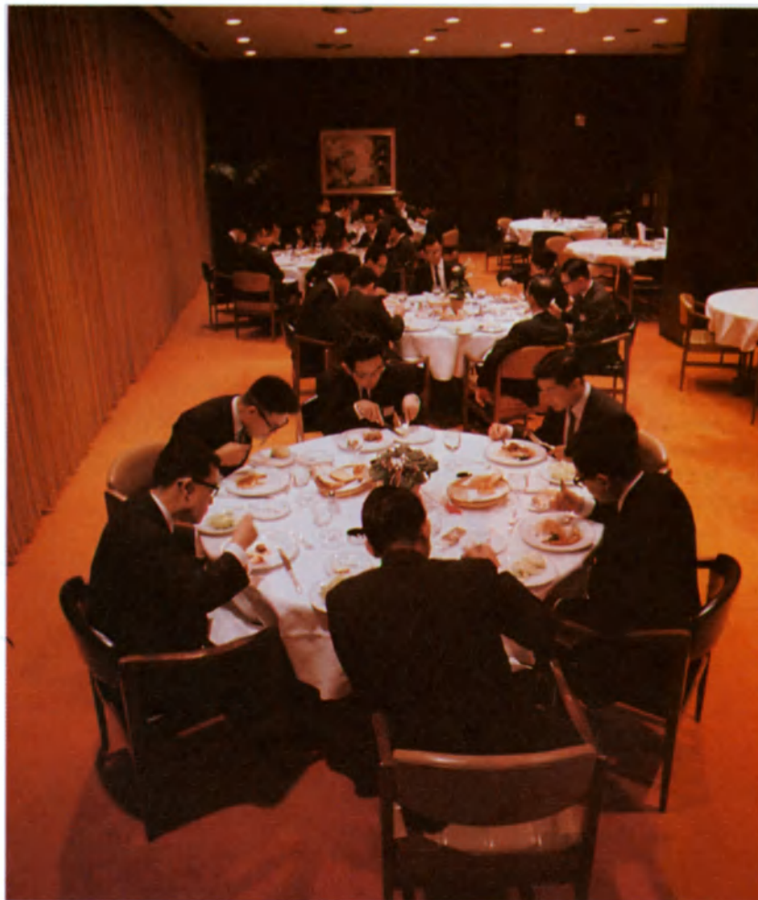
Un grupo de hombres reunidos en un restaurante japonés. A causa de sus compromisos de negocios, los padres japoneses suelen estar ausentes de la mesa familiar más a menudo que en el pasado.

En los últimos años esta evolución se ha acelerado como resultado del aumento del número de empleos y de la consiguiente movilidad. Este proceso se inició sobre todo entre los jóvenes trabajadores rurales, que se marchaban hacia los centros industrializados. Más tarde, numerosos jefes de familias rurales se emplearon temporalmente en centros urbanos en rápida expansión, dejando la tierra al cuidado de la esposa y de los hijos; los empleos transitorios no tardaron en convertirse en permanentes. De este modo, es común que un jefe de familia esté ausente de su casa la mayor parte del año. Estos cambios no afectan sólo a los trabajadores manuales; la expansión económica exige cada vez más el traslado de profe-