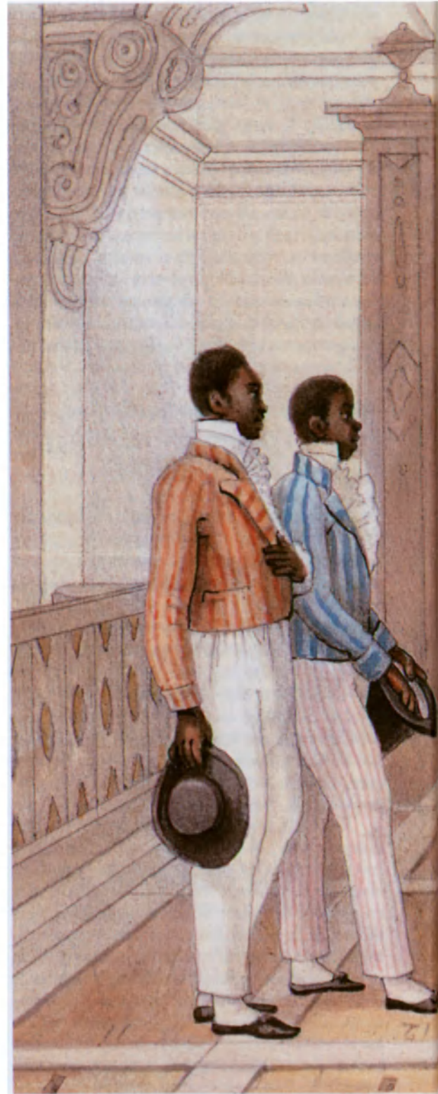
Matrimonio de una pareja de negros en la casa de una familia acaudalada, según una estampa del pintor Jean-Baptiste Debret (1768-1848).