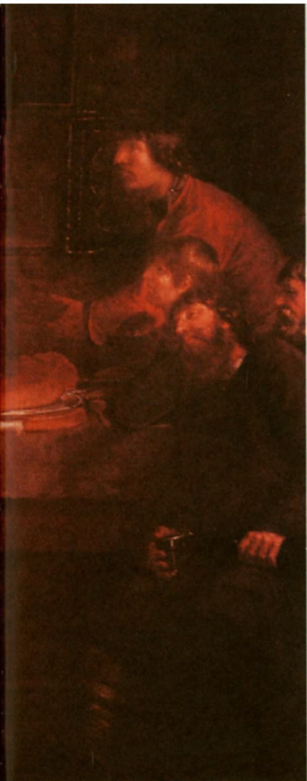
La demande en mariage (La petición de mano) de Michail Schibanoff, pintor ruso del siglo XVIII.