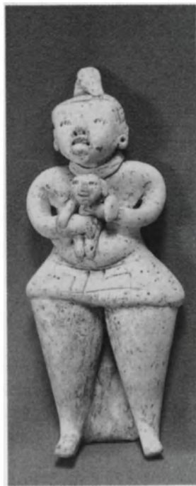
Estatuilla maya de terracota, de la época preclásica (1500 a.C.- 300 d.C.).

Las familias constituidas al margen del modelo blanco eran en su mayor parte de tipo ampliado, en las que los hijos naturales se reagru-