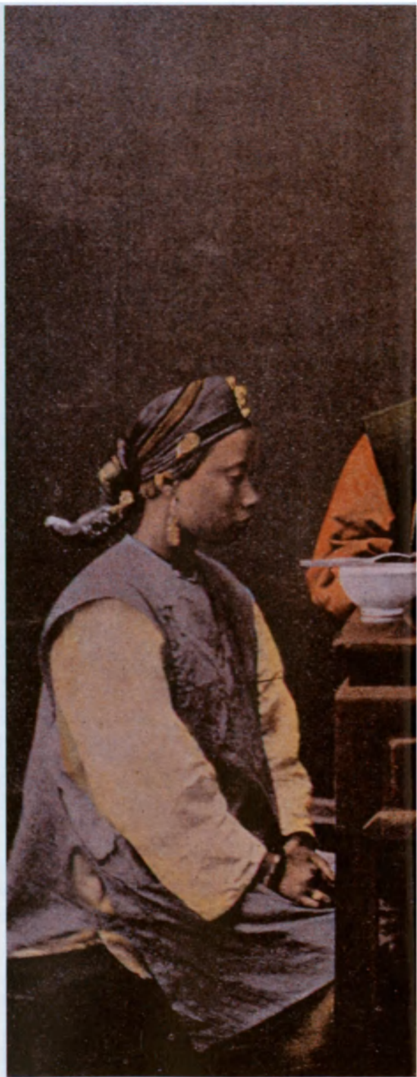
Foto iluminada de una comida en familia en la China de principios de siglo.

Pintura del siglo XIX que representa el yin (elemento femenino) y el yang (elemento masculino), los dos principios opuestos y complementarios presentes en la naturaleza (macho y hembra, luz y tinieblas, fuego y agua, etc.) cuya acción recíproca, según la cosmogonía china tradicional, crea la armonía universal.