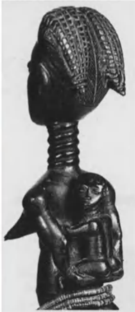
Reina madre ashanti. Esta escultura en madera negra patinada, de 40 cm de altura, se colocaba en el altar de los antepasados.