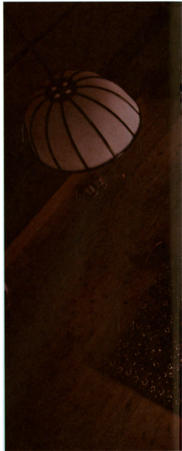
La hora de la comida en una casa japonesa moderna.

En este modelo de organización, la función de la mujer consiste fundamentalmente en dar herederos a la familia de su marido; cuando la unión resulta estéril, la esposa debe regresar a la casa de sus padres y hay que pensar entonces en adoptar