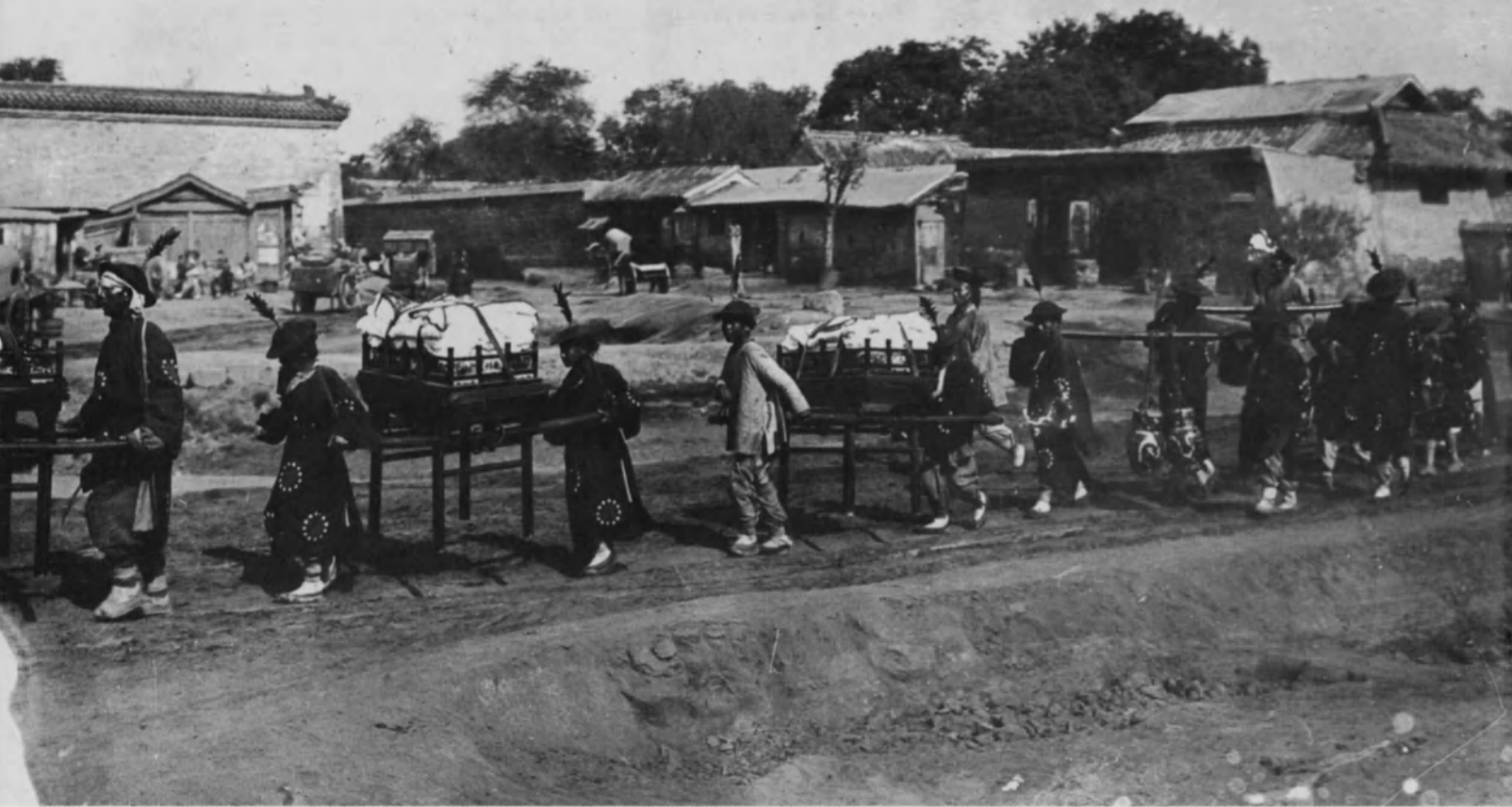
Cortejo de boda en una calle de Pekín en 1911.

libertad. Se estimaba, en consecuencia, que “la incultura es la virtud misma de las mujeres”.