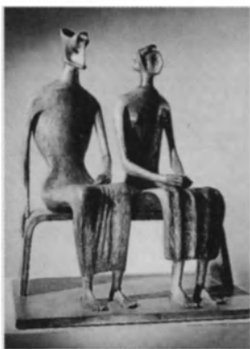
King and Queen (El rey y la reina), obra del escultor inglés contemporáneo Henry Moore.

Past Recovery, (1979, El tiempo recobrado) de Esther Parada. Este gigantesco retrato de familia (2,50 x 3,70 m) está compuesto de un centenar de fotos coloreadas a mano. Figura, junto con obras de artistas antiguos y contemporáneos, en la exposición "La familia en el arte" ("Family in Art") presentada en el Museo de Bellas Artes de Houston (Estados Unidos) del 30 de abril al 6 de agosto de 1989.