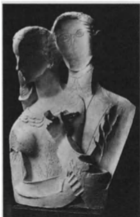
Le couple (1931, La pareja), de Ossip Zadkine (1890-1967), escultor francés de origen ruso.

Civilización rusa, civilización campesina... y familiar. Gracias a una estructura comunitaria original, la familia campesina tradicional, que durante siglos fue un grupo social oprimido, ha logrado mantener su identidad y afirmarse como personalidad colectiva.