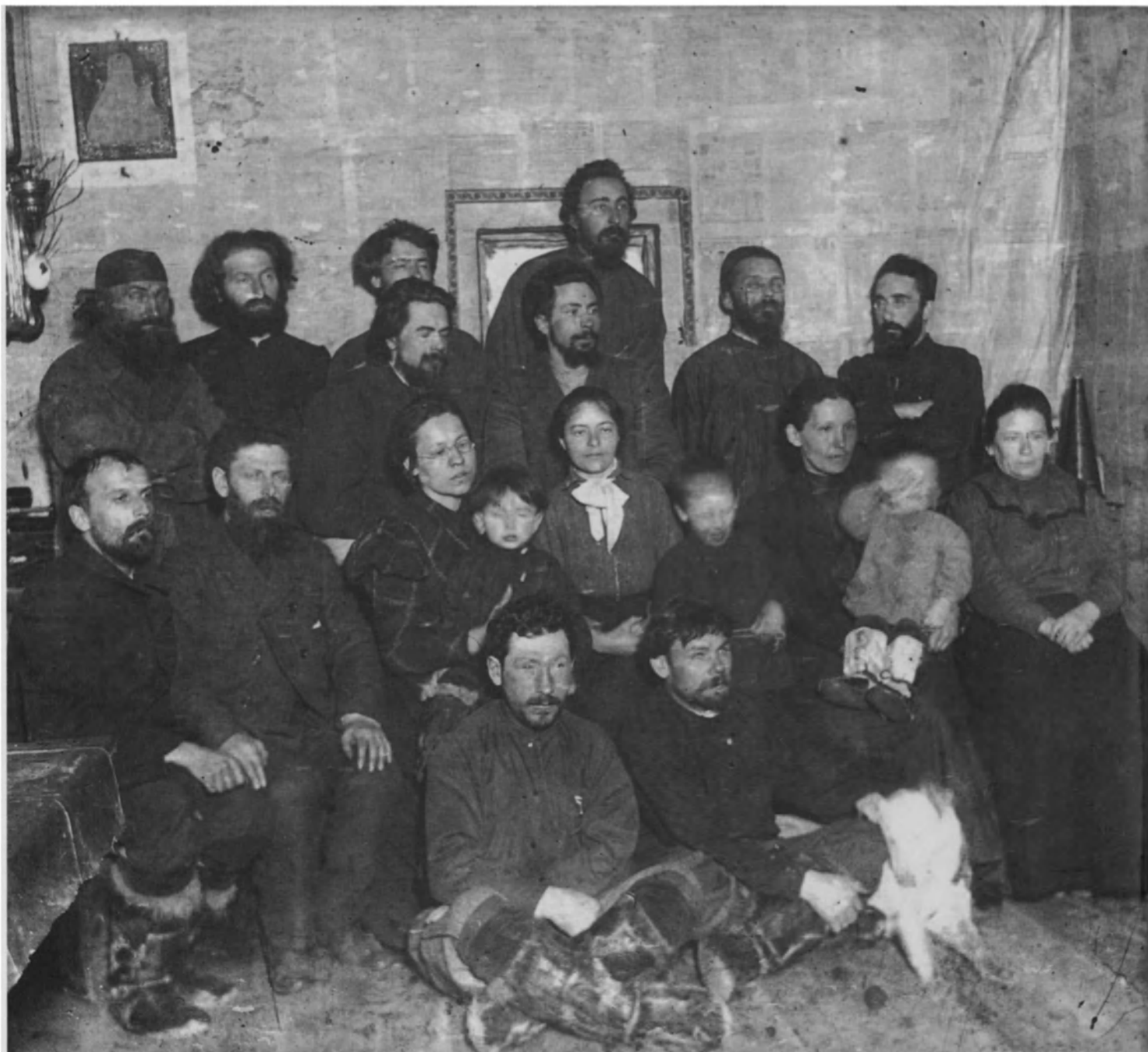
Familia rusa fotografiada a principios del siglo XX.

la morada de su familia política. La mujer ideal era en primer lugar la que trabajaba con ahínco.