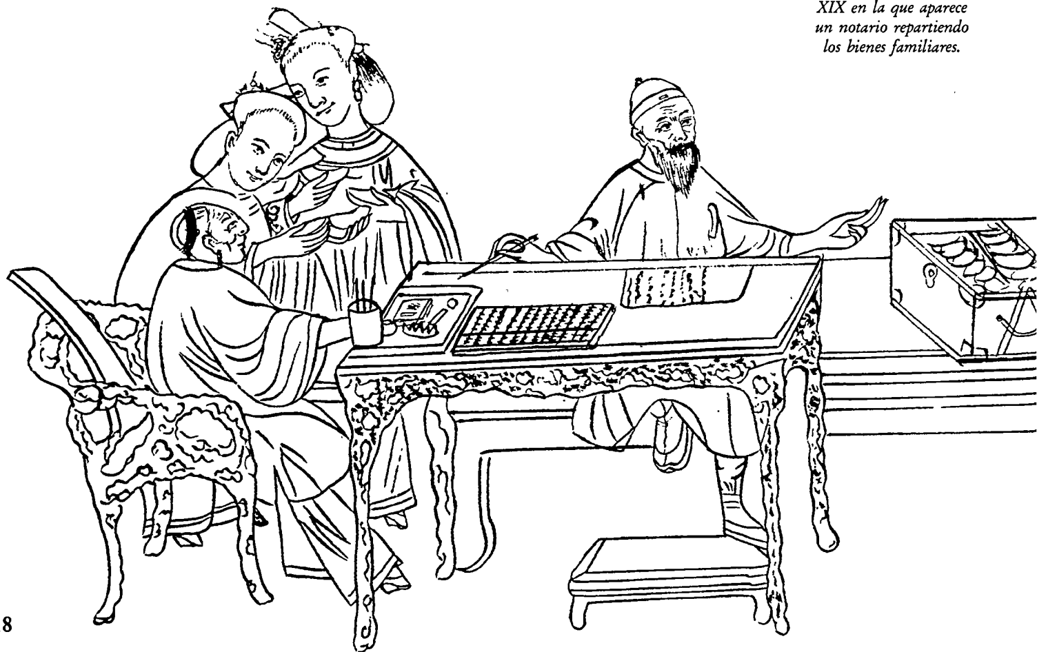
Estampa china del siglo XIX en la que aparece un notario repartiendo los bienes familiares.

QI YANFEN forma parte de la delegación permanente de China ante la Unesco. Ex profesora de francés de la Universidad de Beijing, es autora, entre otras obras, de un Resumen de la civilización occidental y de una tesis sobre Los personajes femeninos en la obra de Simone de Beauvoir (1983), así como de numerosos artículos. Ha traducido al chino obras de la literatura francesa, en particular una novela de Simone de Beauvoir, La sangre de los otros .