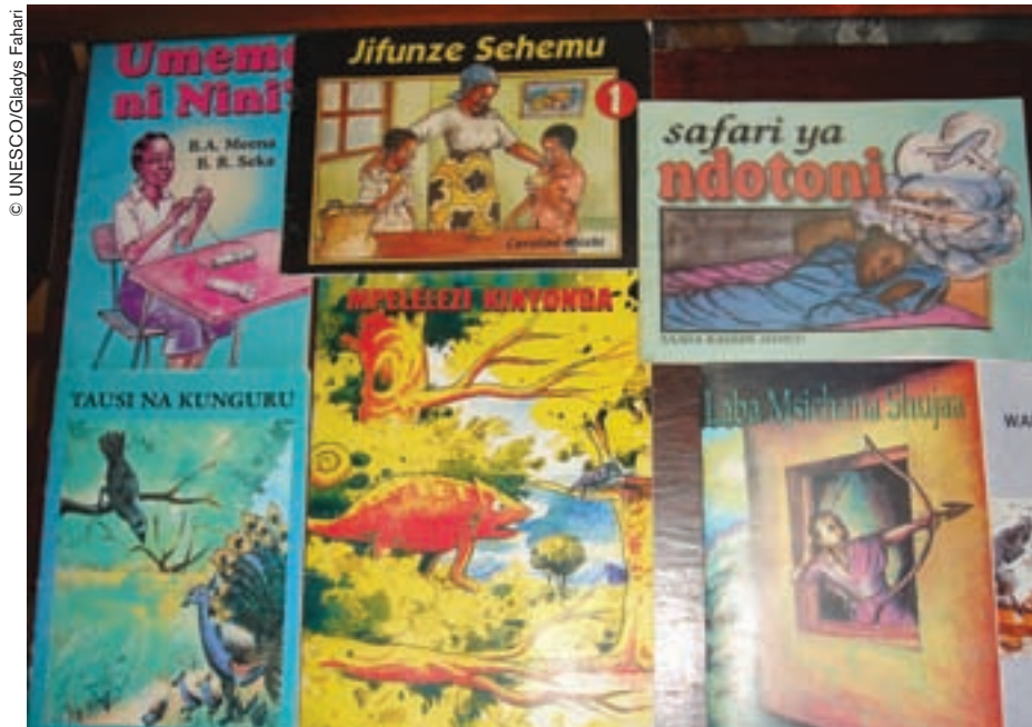
Algunas de las publicaciones del Children's Book Project cuentan las aventuras del camaleón detective, del pavo real y de la corneja...

en el proyecto aumentó en Tanzania, Kenya y Uganda.