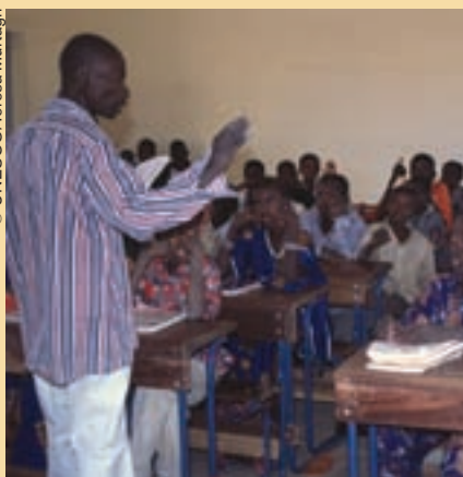
Escuela primaria en Kadji, Gao, Mali.