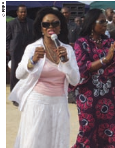
Patti Boulaye (a la izquierda) y Alaere Alaibe (a la derecha), durante la inauguración del Centro de Salud en Igbainwari.

En 2006, la organización FREE construyó en la ciudad de Igbainwari (estado de Bayelsa) un centro sanitario en cooperación con la Fundación Ayuda a África, que tiene su sede en el Reino Unido y ha sido creada por iniciativa del cantante Patti Boulaye, oriundo de Nigeria. FREE organiza también seminarios sobre temas de educación y salud, así como una vasta serie de actividades que comprenden, entre otras, la realización de pruebas oftalmológicas y la distribución de lentes a los alumnos que los necesitan.