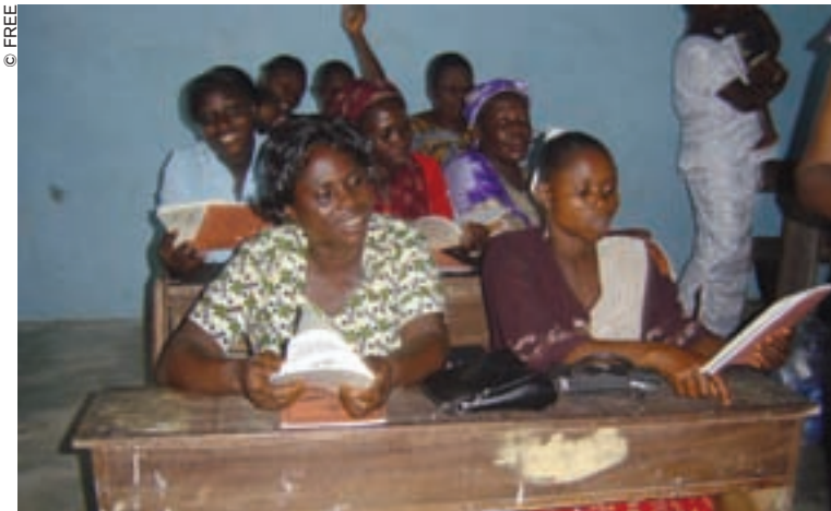
Clase de alfabetización en FREE.