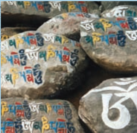
Grabados del santuario de Swayambhunath en Katmandú (Nepal).