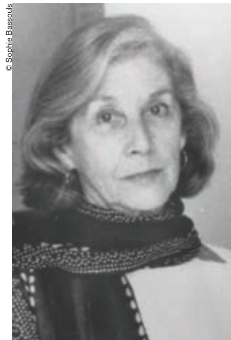
Nadine Gordimer aboga junto a la UNESCO por el fin del analfabetismo.

El Presidente Mbeki dijo hace poco que para satisfacer las necesidades que implica el rápido crecimiento de la economía de Sudáfrica –la mejor dotada en recursos e infraestructuras de todo el continente africano– es necesario importar profesionales calificados de otros países para que ocupen los puestos de trabajo que no se pueden cubrir y para que, al mismo tiempo, contribuyan a la capacitación de los sudafricanos, a fin de que éstos puedan desempeñar más tarde esos puestos, especialmente en el sector industrial. Una versión reinventada del clásico precepto “ayúdense los unos a los otros”.