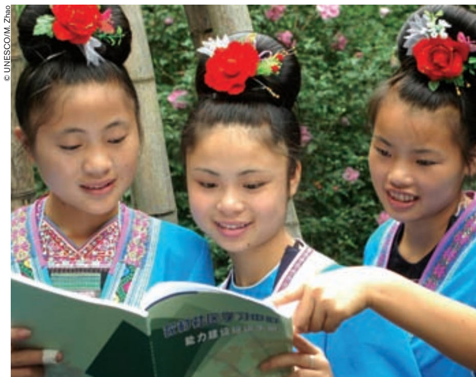
Los estudiantes aplican métodos de la educación comunitaria.

El distrito de Longsheng está situado en una zona montañosa de la región autónoma de Guangxi Zhuang y su población es de unas 170.000 personas. Las tres cuartas partes de sus habitantes pertenecen a las minorías étnicas miao, yao, tong y zhuang. Gracias a la labor realizada por el Centro de Administración de la Educación Comunitaria, el índice de alfabetización de todos esos grupos étnicos ha alcanzado hoy en día un nivel particularmente elevado.