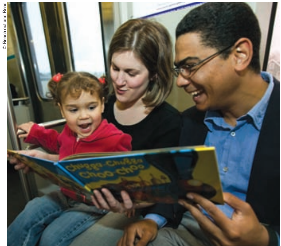
Cualquier sitio es bueno para leer.

Las encuestas realizadas ponen de manifiesto que el programa consigue buenos resultados. Cuando los padres reciben libros y consejos de los médicos y el personal sanitario, aumentan las probabilidades de que hagan lecturas a sus hijos, de que dediquen más tiempo a esta actividad y de que lleven más libros al hogar. Los niños de familias pobres que se benefician del programa de “Comuníquese y lea” han demostrado poseer un lenguaje más elaborado, que como es bien sabido es un factor fundamental de su grado de preparación para ingresar en la escuela. Estos niños obtienen en las calificaciones de las pruebas de vocabulario entre cuatro y ocho puntos más que los demás niños pobres. Además, se ha observado que, en el plano del desarrollo, el adelanto de los niños de dos años beneficiarios del programa es de unos seis me-