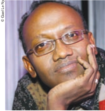
Abdourahman A. Waberi.

Como otros escritores de jóvenes naciones de lo que dio en mal llamarse el Tercer Mundo, llegué a la escritura porque quienes habían escrito sobre mi país, mi pueblo o mi cultura (y coloco en lo sucesivo comillas muy pesadas en torno a cada una de estas nociones) no lograban satisfacerme por completo. Conocemos desde hace años la mirada crítica de China Achebe sobre ciertos aspectos sospechosos de la obra, por lo demás sublime, de Joseph Conrad.