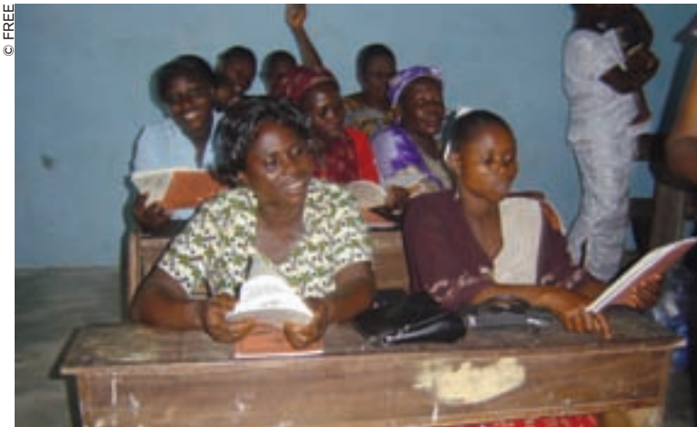
Clase de alfabetización en FREE.