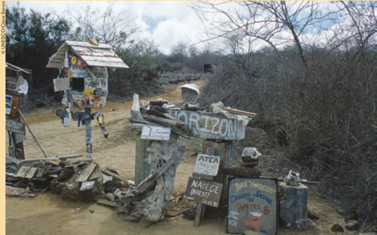
Buzones en Floreana, Galápagos, (Ecuador).

N uestros ojos se posan sobre el mundo. Nuestro corazón late como el mundo. Nuestras manos acarician las curvas del mundo, nuestras risas cosquillean el mundo y nuestras lágrimas lo hacen temblar, pero el mundo no sería nada sin nuestras palabras de decir y de creer, sin nuestras palabras para construirlo.