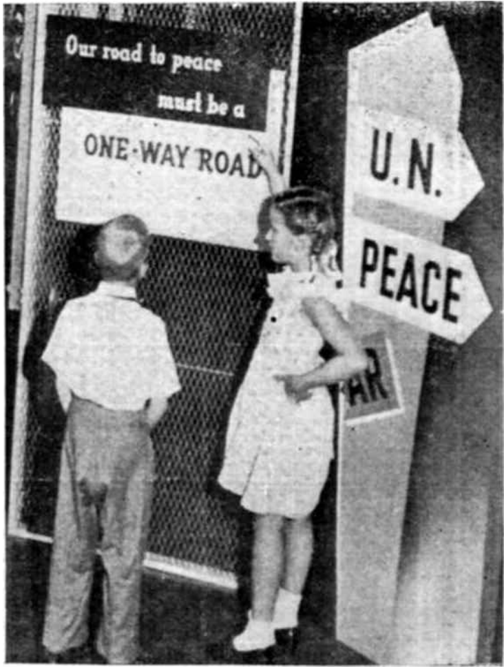
La ruta de la Paz.

Este documento será presentado a la próxima Conferencia General de la Unesco en forma mucho más completa. De ser aprobado entonces, pasará a ser el informe oficial de la Unesco en esta materia.