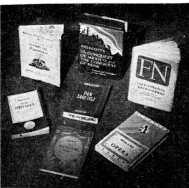
Diferentes muestras de libros económicos, publicados por casas editoriales de Argentina, Estados Unidos, Francia, Inglaterra, México, Polonia y Suecia.