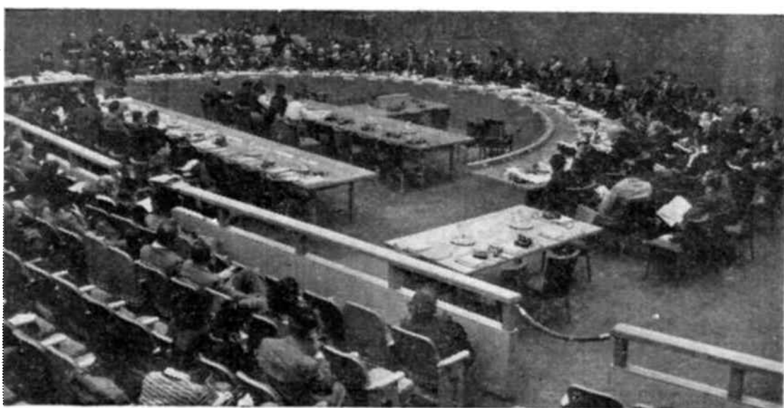
Vista general del salón de sesiones del Consejo Económico y Social, en Lake Success.

Se espera poder reproducir una selección de los ensayos y carteles en relación con la publicidad de la Unesco, así como presentar una exposición de los trabajos en la Cuarta Reunión de la Conferencia General, para 1949.