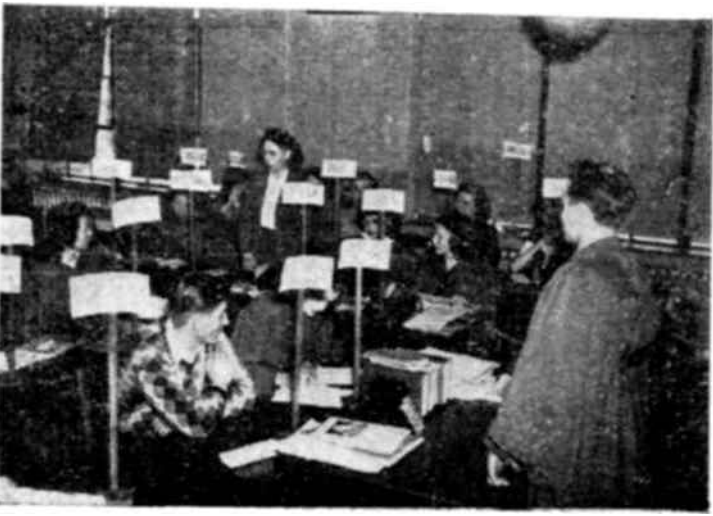
En una escuela de Michigan (E.E.U.U.) los alumnos reconstituyen una conferencia de las Naciones Unidas.

Las bibliotecas y museos de varios distritos han cooperado en el planeamiento de exposiciones sobre las Naciones Unidas, y se ha editado gran número de libros y folletos para estudiantes y profesores. Numerosas escuelas emplean films y diapositivas relacionadas con las Naciones Unidas, así como cuadros y composiciones fotográficas.