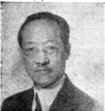
Dr. Y.R. Chao.

A principios de julio se mandarán muestras de ambos folletos a los Estados Miembros de la Unesco. Es de esperar que para entonces se traduzcan, allí donde sea necesario, receditándose con miras a su mayor difusión.