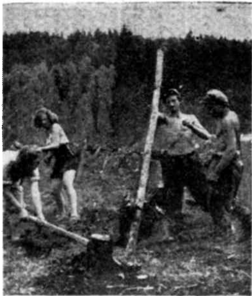
Jóvenes de los campos de trabajo en acción. En la fotografía superior las operaciones de limpieza de un terreno en Finlandia; a la derecha la construcción de un ferrocarril en Yugoslavia.

Por otra parte, los delegados en el curso de las sesiones, han puesto de manifiesto sus experiencias, en lo que atañe a los innumerables problemas técnicos que la creación de los campos de trabajo y el envío de voluntarios plantean. Así se ha redactado un documento de los más interesantes, primer bosquejo de una obra fundamental sobre esta cuestión: este documento será particularmente precioso para las asociaciones que, por primera vez, aco-