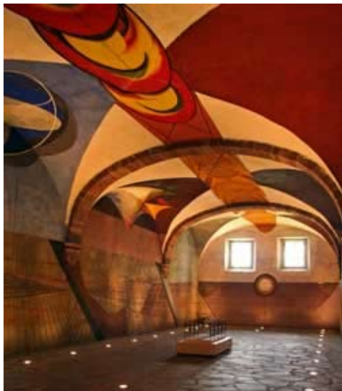
Un nuevo sitio del Patrimonio Mundial: La Villa mexicana de San Miguel de Allende.

► número de amenazas pesan sobre la mayoría de los 878 sitios del Patrimonio Mundial: la construcción de