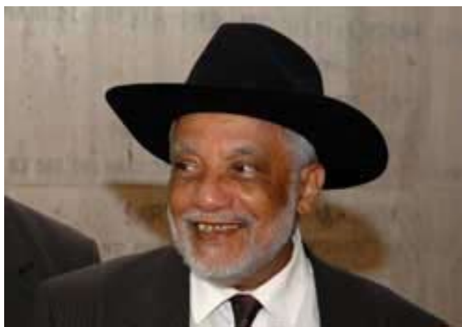
René Depestre en la UNESCO, en 2006.

Los africanos que fueron expatriados a América por medio de la trata negrera y separados de sus culturas tradicionales para trabajar en las plantaciones, en las que se mezclaron todas las etnias, perdieron sus referentes. Aun así, los reconstituyeron en medio del sufrimiento y del trabajo servil, viviendo en condiciones extraordinariamente precarias, y se convirtieron de ese modo en los fundadores de las nuevas culturas del Caribe. Esas culturas se apartaron