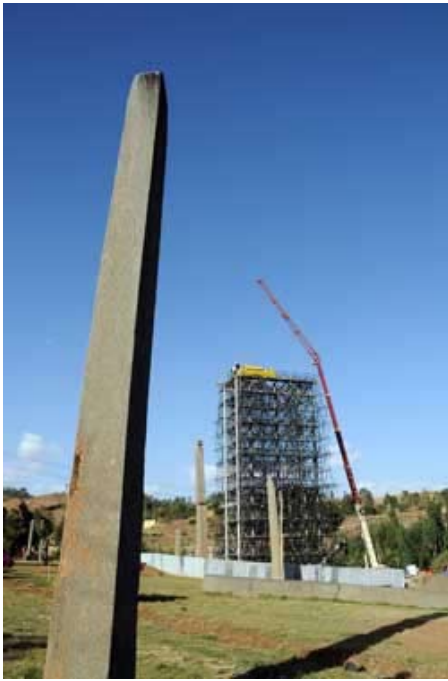
Reinstalación del primer bloque del Obelisco de Axum, junio 2008.