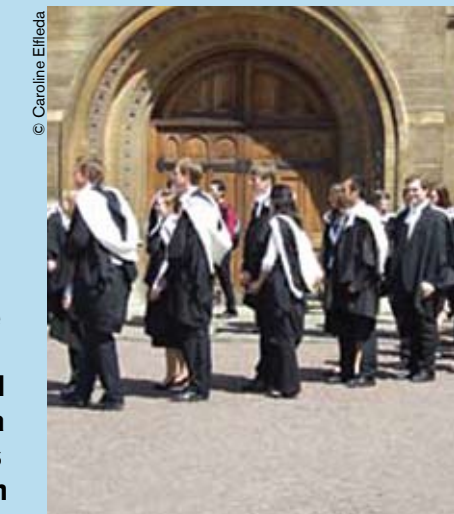
Cola para la obtención de títulos académicos en Cambridge (Reino Unido).

Dentro de un mismo país, algunos grupos de población no tienen las mismas oportunidades de acceso que otros a la educación superior. Las personas con ingresos bajos o