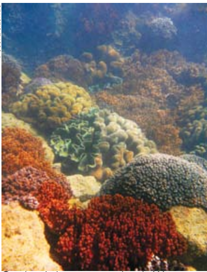
Corales de la reserva marina de Woongarra, situada en el parque marino de Great Sandy (Australia).

La noción de reserva de biosfera surgió en 1974, en el marco del Programa sobre el Hombre y la Biosfera (MAB) de la UNESCO, y la Red Mundial de Reservas de Biosfera se creó dos años más tarde. En el decenio de 1970 esa noción correspondía grosso modo a la de “zona protegida”, pero en el decenio siguiente fue englobando paulatinamente la idea de desarrollo sostenible. Hoy en día, al considerarse que las poblaciones humanas forman parte de la biosfera, el concepto de reserva de biosfera se centra más en la conservación y la educación científica con miras a promover una interacción beneficiosa de las sociedades humanas con su entorno.