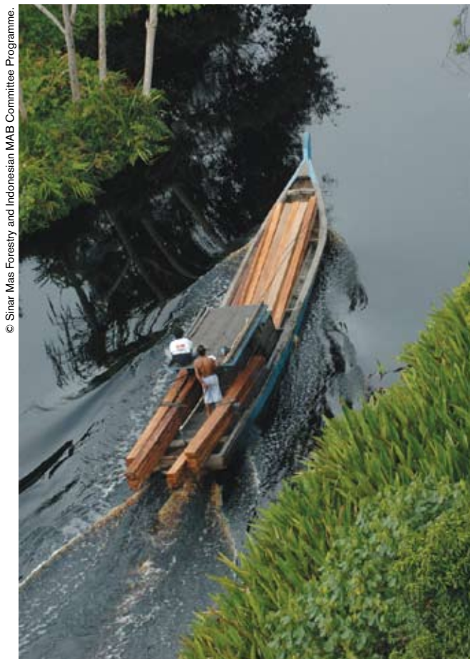
Una explotación forestal clandestina en Sumatra (Indonesia).