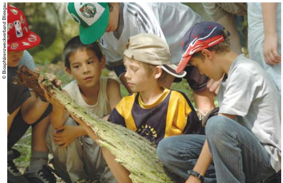
En Bliesgau, la labor en pro del desarrollo sostenible comprende iniciativas pedagógicas y actividades de sensibilización a la preservación del medio ambiente.

periodista de Der Spiegel Online (Alemania), corresponsal del Correo de la UNESCO