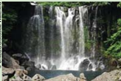
Cascadas de la reserva de biosfera de la Isla de Jeju (República de Corea).

El Consejo Internacional de Coordinación del Programa sobre el Hombre y la Biosfera (MAB) celebró su 21ª reunión entre el 25 y el 29 de mayo en la isla de Jeju (República de Corea).