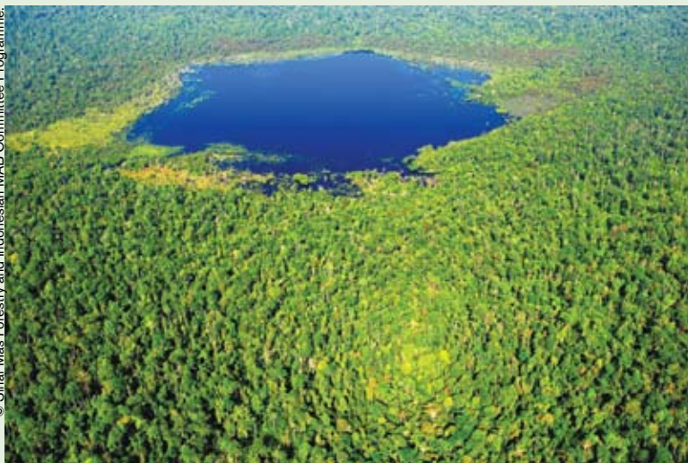
Turbera en la zona núcleo de la reserva de biosfera de Siam Giak Kecil – Bukit Batu.