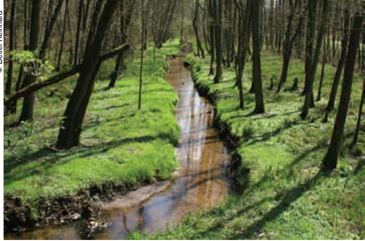
Un sector de la zona núcleo de la reserva de biosfera de Bliesgau (Alemania).

La noción de ecología urbana es fundamental en Bliesgau, una zona protegida de Alemania que se ha sumado el 26 de mayo a la Red Mundial de Reservas de Biosfera de la UNESCO. Bliesgau no es el primer sitio de la Red que comprende áreas urbanas, pero sí es el único con una densidad de población de 310 habitantes por kilómetro cuadrado.