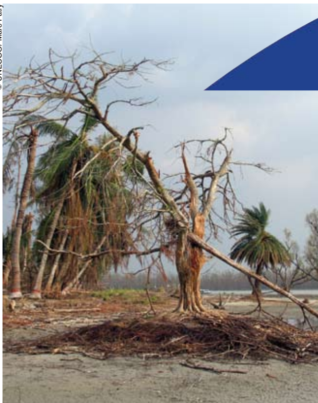
El Parque de los Sundarbans (Bangladesh-India), sitio del Patrimonio Mundial, asolado por el ciclón Sidr en noviembre de 2007.

Giam Siak Kecil – Bukit Batu, sitio indonesio que acaba de añadirse a la Red Mundial de Reservas de Biosfera, está destinado a convertirse en un “laboratorio vivo” para el desarrollo sostenible. Allí se elaborarán y ensayarán remedios contra el cambio climático.