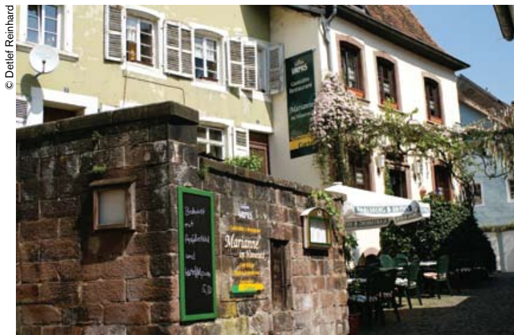
La ciudad de Blieskastel forma parte de la reserva de biosfera de Bliesgau.