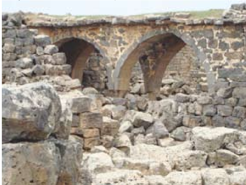
En Lajat abundan los vestigios arqueológicos de poblados. Los más antiguos se remontan al siglo III.