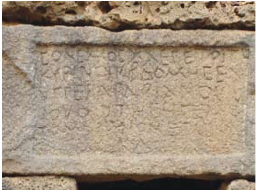
Lajat cifra sus esperanzas en el desarrollo del turismo cultural.

© Delegación Permanente ante la UNESCO de la República Árabe Siria