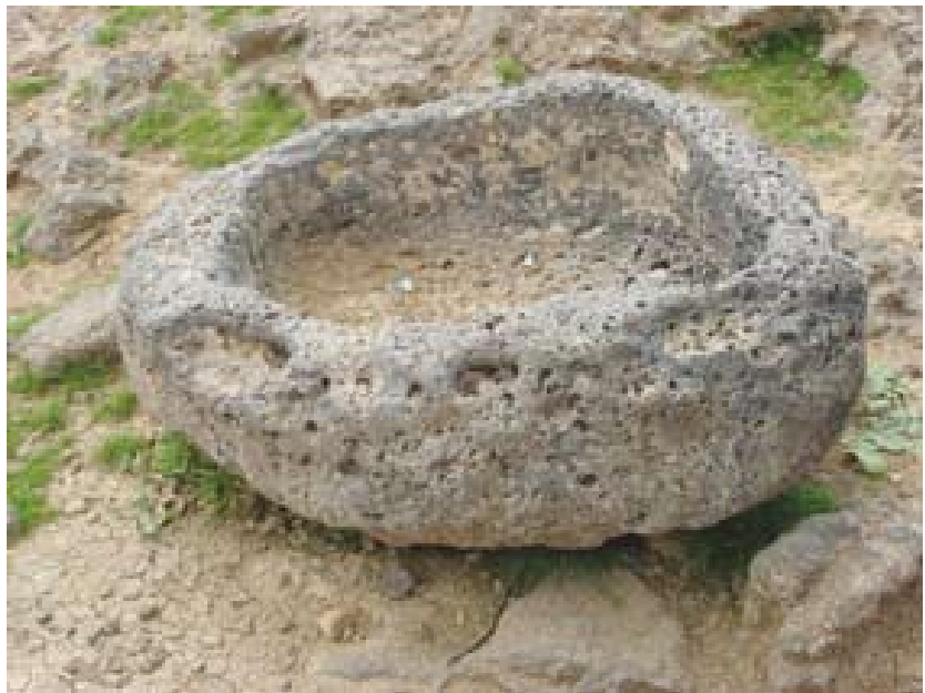
En Lajat se han localizado hasta la fecha unos 700 sitios históricos y arqueológicos.