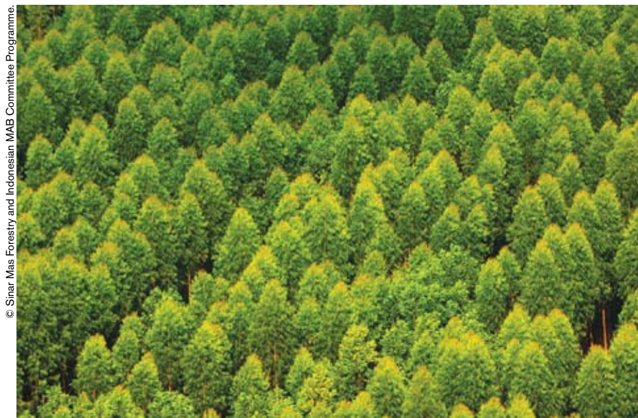
Vista de la zona núcleo de la reserva de biosfera de Siam Giak Kecil – Bukit Batu (Indonesia).