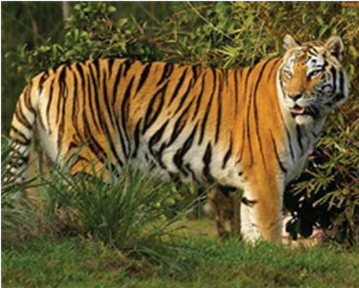
En Similipal, gracias al "Proyecto Tigre", se ha puesto un término a la disminución de la población de esta especie felina.

Un baldaquín verde entrelazado de selvas lujuriantes cubre la Reserva de Biosfera de Nokrek, en el Estado de Meghalaya, al noreste de India. Punto culminante de las colinas de Garo, a 1.418 metros de altura, Nokrek destaca por sus asombrosos paisajes montañosos y sus ecosistemas que no han sido perturbados por actividades humanas. La zona alberga especies salvajes, especialmente elefantes, tigres, leopardos y gibones huloeks y también raras orquídeas silvestres que todavía no han sido estudiadas. Nokrek contiene asimismo un "santuario genético" destinado a preservar raras variedades de cítricos especialmente la naranja silvestre india ( Citrus indica ), que podría servir de reservorio de genes para los cítricos producidos con fines comerciales.