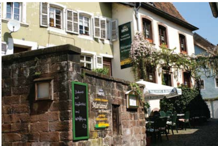
La ciudad de Blieskastel forma parte de la reserva de biosfera de Bliesgau.