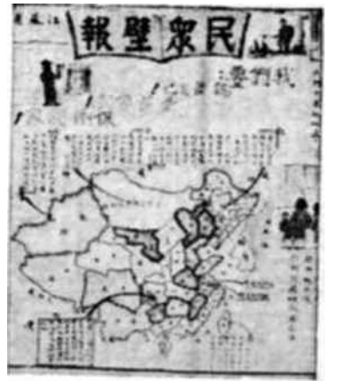
Un periódico mural en la campaña de alfabetización en China

Debido a la escasez de cigarrillos, tiene que levantarse a las cuatro de la mañana y hacer cola para poder adquirir unos cuantos paquetes. Corre de una a otra cola comprando lo más que puede. Entonces vende sus cigarrillos al mejor precio a dos comerciantes que se encuentran cerca de una calle estrecha, al pie del Puente del Parque. De este modo trabaja hasta las tres de la tarde en que es relevado por su hermano