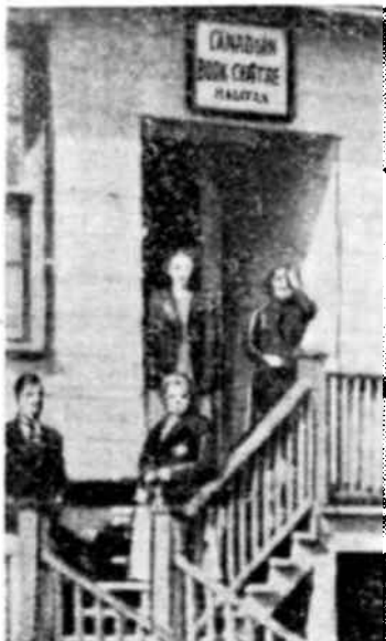
El 4 de Febrero se inauguró en Halifax, Canadá, un nuevo centro de libros que se encarga de facilitar el canje de publicaciones y periódicos con destino a las bibliotecas devastadas

Un buen ejemplo de la forma en que podrá acudir en ayuda de los bibliotecarios canadienses, se dio en la ceremonia de inauguración, cuando un bibliotecario del Consejo Nacional de Investigaciones Canadienses encontró algunas revistas técnicas que en vano había tratado de obtener para su biblioteca, durante varios años.