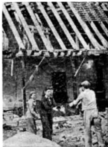
Reparación de escuelas

"Esperamos que la Unesco nos ayudará a organizar un campo de estudios para directores de campos de trabajo en un rincón cualquiera de Europa, así como una conferencia posterior a la terminación de los campos para que los voluntarios discutan los resultados de sus trabajos y sus experiencias, todavía frescos en nuestros espíritus. "Lo que quisiéramos hacer de pre-