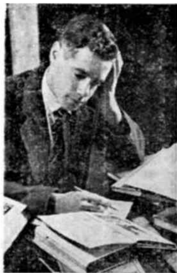
Recibió sus libros

En diciembre del año 1948, la Unesco distribuyó entre 13 países bonos de libros por un valor aproximado de 150.000 dólares. Parte de esa distribución era un donativo para la reconstrucción, pero la mayoría de los bonos fueron pagados por los países beneficiarios en libras esterlinas o francos franceses. Los bonos son vendidos, en cada país, a compradores de libros meritorios, y pagados por ellos en su moneda nacional. Esos compradores pueden, por lo tanto, encargar los libros