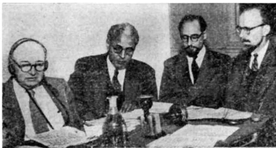
Tres miembros del Departamento de Ciencias de la Unesco en el curso de una emisión transmitida por la Columbia Broadcasting System bajo el título de "Servicio Científico"

Tres nuevas emisoras de radio van a ser inauguradas en la India durante el mes de marzo de 1949. Se hallan situadas en Admedabad, Hubli y Calicut, ciudades que se encuentran todas ellas en la costa occidental o en sus cercanías. Ello significa que durante los últimos 18 meses han comenzado a funcionar en la India 10 nuevas emisoras de radio.