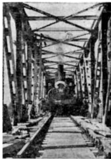
Construcción de puentes