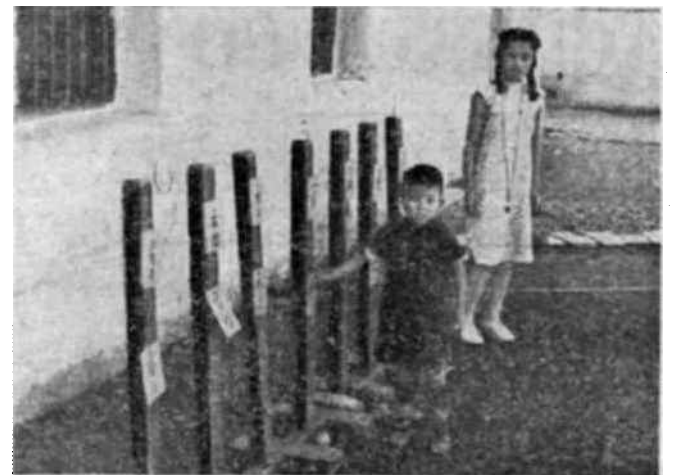
El método empleado en los centros de formación de China inicia el arte de la lectura mediante la presentación directa de los objetos

para aquellos que desean asistir, el número de solicitudes se multiplica, llenando por completo las clases en la mañana, en la tarde y por la noche. Poco a poco se inauguran nuevos centros de enseñanza y actualmente existen 41 en funcionamiento, en cocinas, en graneros, calles y portales. Junto