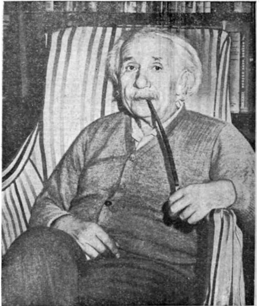
Una fotografía de Alberto Einstein tomada la víspera de su septuagésimo cumpleaños muestra al autor de la teoría de la relatividad en su casa de Princeton, Nueva Jersey. Desde 1933 Einstein ha estado en el Instituto de Altos Estudios de dicha ciudad.