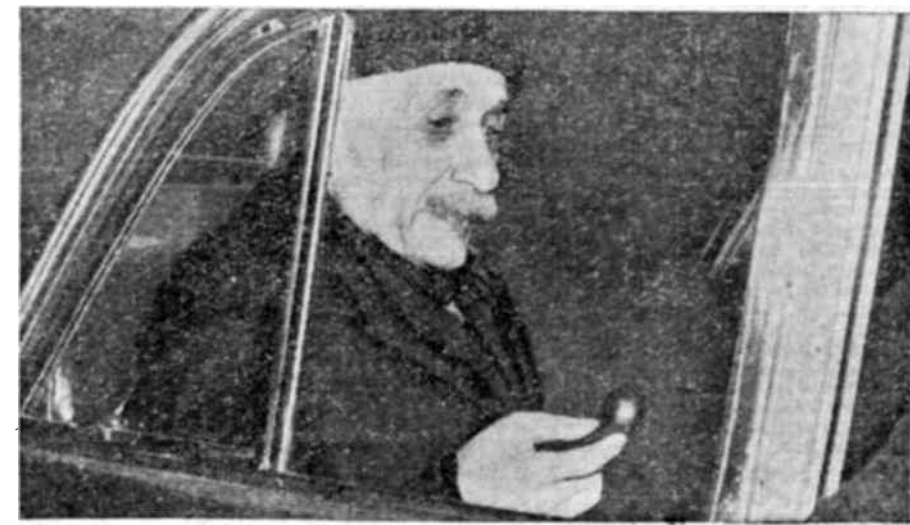
Einstein al salir de un hospital de Nueva York después de una reciente operación.

PERO la labor científica de Einstein, que ha sido siempre extraordinaria, dejó entonces de ser su única actividad. Su inspirada declaración de 1914 corresponde a un nuevo giro de su razonamiento y de su vida. El odio que siente por la guerra se convierte en obsesión. "Mi pacifismo"—dice Einstein—"no pro-