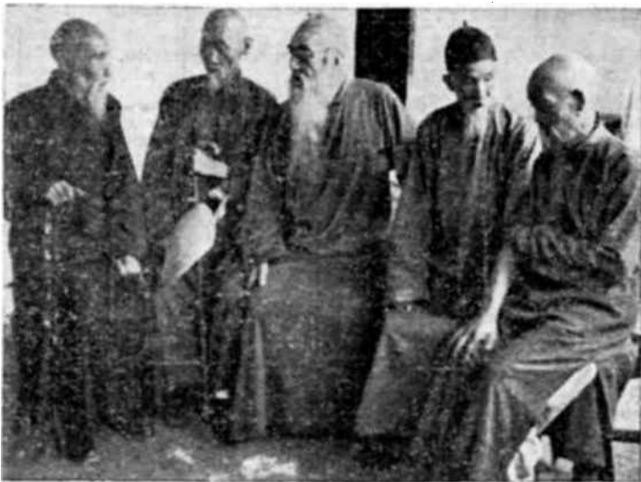
Cinco venerables maestros encargados de la dirección de los monitores, deliberan sobre los métodos de educación de masas que actualmente se aplican en China.

dos por el primer Centro han sido tan notables dentro de su esfera de acción, que las propias escuelas municipales de primera enseñanza desean enviar parte de sus alumnos a los Centros del Fondo Chino a causa de este entrenamiento tan valioso. En tercer lugar, como todos los