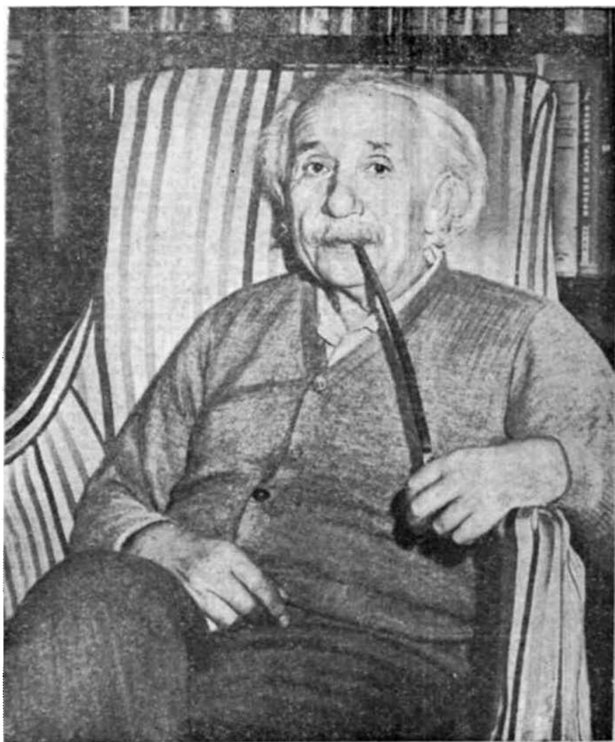
Una fotografía de Alberto Einstein tomada la víspera de su septuagésimo cumpleaños muestra al autor de la teoría de la relatividad en su casa de Princeton, Nueva Jersey. Desde 1933 Einstein ha estado en el Instituto de Altos Estudios de dicha ciudad