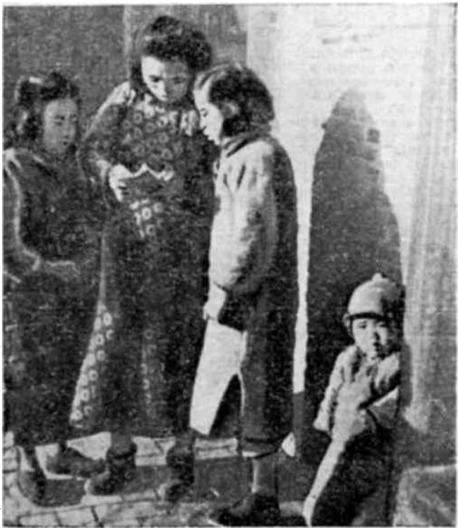
“La educación a domicilio”. Dos monitores enseñando a leer a una costurera

Puede verse que los muchachos a quienes ha llegado el programa del Fondo Chino, muestran su huella. Para que puedan enseñar la comprensión han de recibir una educación útil y muchos de los libros de texto que pueden adquirirse en las librerías no son adecuados para este género de trabajo. Escritos para alumnos de escuelas ordinarias y no para niños obligados a trabajar, huérfanos y refugiados, prestan un servicio insignificante. Las lecciones que estos muchachos necesitan son de un carácter especi-