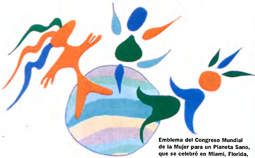
Emblema del Congreso Mundial de la Mujer para un Planeta Sano, que se celebró en Miami, Florida, del 8 al 12 de noviembre de 1991.

asistirán mujeres que actúan en el plano local, pero que han aprendido también a pensar con una perspectiva mundial. Voy a convencerlas de que lancen un movimiento que cambiará el mundo y creará las condiciones para que las mujeres sean dueñas de su destino.