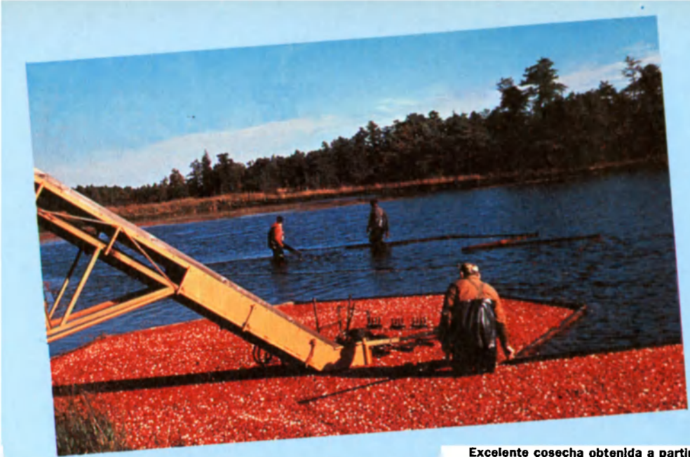
Excelente cosecha obtenida a partir de variedades mejoradas de arándanos silvestres, especie protegida en la reserva de biosfera de la llanura costera sudatlántica, en Estados Unidos.