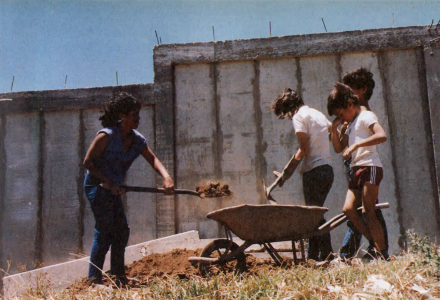
Las mujeres de Guararí levantaron sus casas sin arredrarse ante las labores más pesadas (arriba). "Incluso las personas de edad participaron plenamente en la tarea" (página de la izquierda).

control de la natalidad, legislación social o saneamiento ambiental.