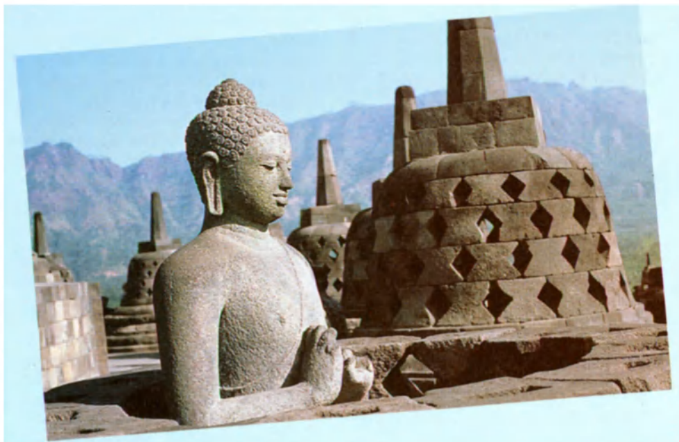
La restauración de Borobudur (Indonesia), realizada bajo la égida de la UNESCO.

■ París: mesa redonda con motivo del centenario del nacimiento del filósofo Karl Jaspers.