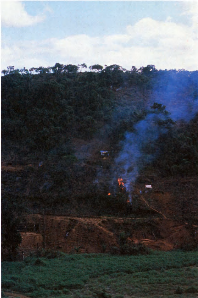
Los que no tienen techo queman el bosque para desmontar el terreno y ocuparlo, Salvador de Bahía.

y en la opinión pública que se ha logrado incluso aprobar instrumentos internacionales en un tiempo récord. En comparación, las dificultades específicas de ciertas comunidades, que no superan el contexto local, no parecen conmover a nadie. A menudo se los descuida o se los relega a la categoría de problemas de sanidad, de vivienda o de agricultura, menos apremiantes en nuestros días que los ambientales.