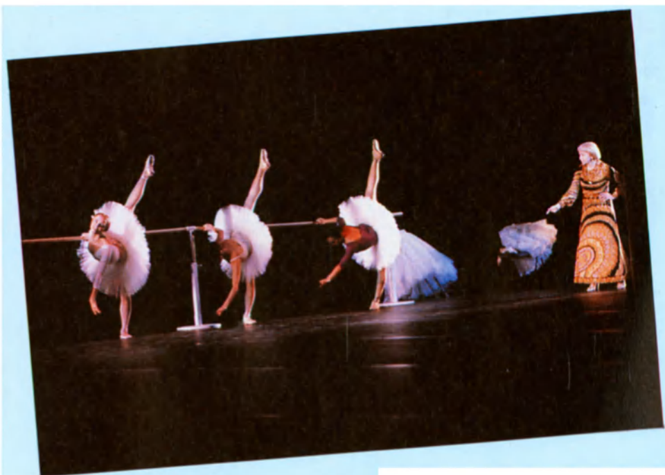
Arriba, velada de homenaje a Galina Ulanova, bailarina estrella del Bolshoi, a beneficio del programa de la UNESCO para los niños impedidos, el 16 de noviembre de 1981.