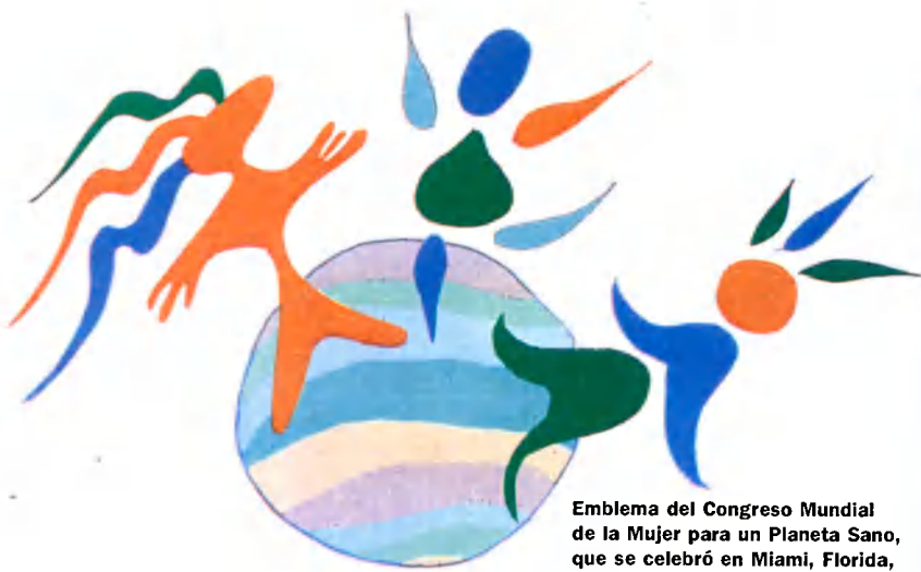
Emblema del Congreso Mundial de la Mujer para un Planeta Sano, que se celebró en Miami, Florida, del 8 al 12 de noviembre de 1991.

asistirán mujeres que actúan en el plano local, pero que han aprendido también a pensar con una perspectiva mundial. Voy a convencerlas de que lancen un movimiento que cambiará el mundo y creará las condiciones para que las mujeres sean dueñas de su destino.