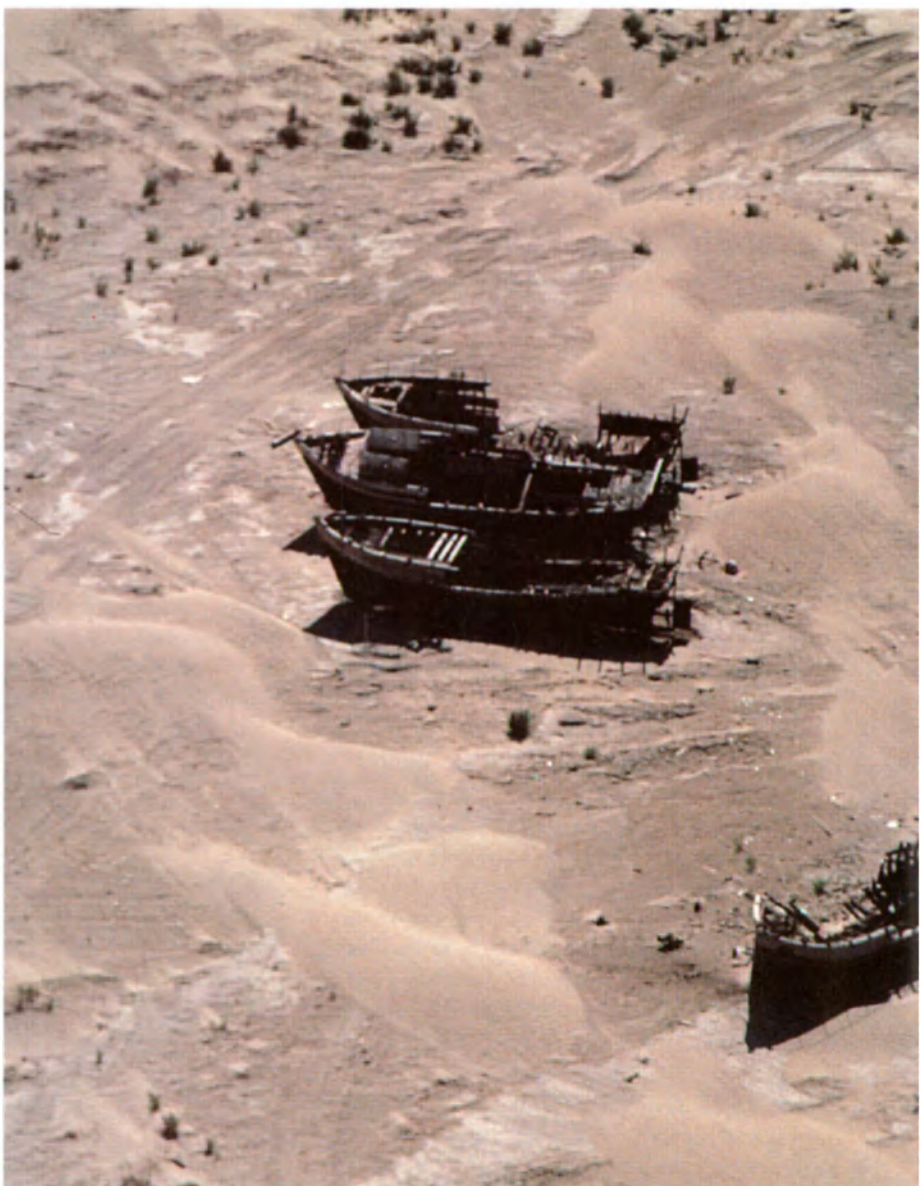
El mar de Aral ha perdido 40% de su superficie desde 1960 debido al riego masivo de los cultivos de algodón a lo largo de sus afluentes, causando la ruina de la industria pesquera, base de la economía local.

Lamentablemente hay demasiadas manchas negras en el mapa ecológico de mi país, y se extienden cada vez más. En la encuesta se pedía a los lectores que evaluaran la situación ecológica del lugar en que vivían. En cien cartas tomadas