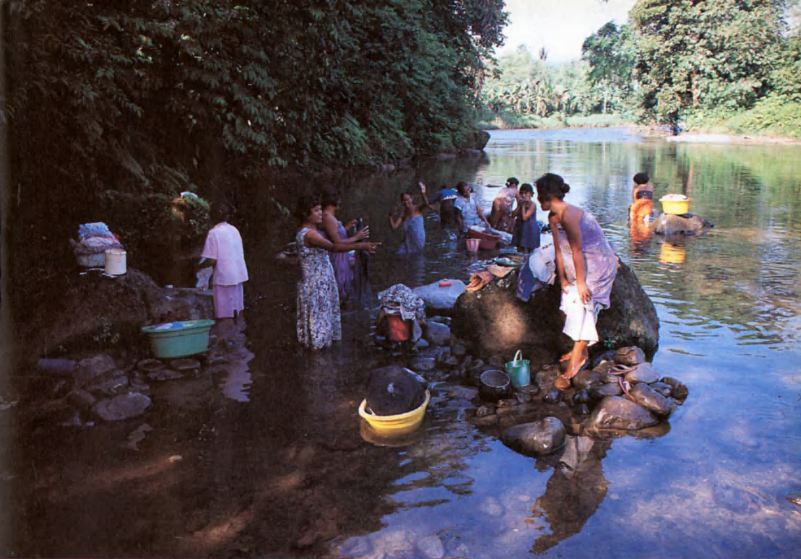
“Desde los albores de la humanidad el trabajo de las mujeres no ha sido remunerado y, por consiguiente, se le ha considerado sin valor.” Arriba, lavanderas en Sumatra (Indonesia).

o de las naciones para asegurar el sustento de los nuevos ciudadanos. No es menos cierto que la presión sobre los frágiles ecosistemas de algunos países con altos índices de fecundidad se está agravando de manera alarmante. Al mismo tiempo no hay que olvidar nunca que un niño nacido en un país industrializado absorbe una proporción mucho mayor de los recursos naturales del planeta que un niño pobre nacido en una nación en desarrollo. En cuanto a las industrias y otras actividades consumidoras de recursos y productoras de desechos contaminantes, lo más frecuente es que estén concentradas en los países altamente industrializados. Si queremos entender la complejidad de la cuestión hay que analizar el problema de los modos de consumo al mismo tiempo que el de la explosión demográfica.