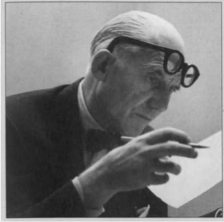
Charles Edouard Jeanneret-Gris, llamado Le Corbusier (1887-1965).

Arquitecto y urbanista de fama mundial, Le Corbusier fue el creador, entre otras obras, de la Cité Radieuse de Marsella y de la ciudad india de Chandigarh. En una reunión organizada en Venecia, en 1934, por el Instituto Internacional de Cooperación Intelectual, Le Corbusier expuso su concepción del urbanismo y precisó en un brillante análisis, del que publicamos los fragmentos más significativos, en qué consiste, a su juicio, la excepcional armonía de Venecia.