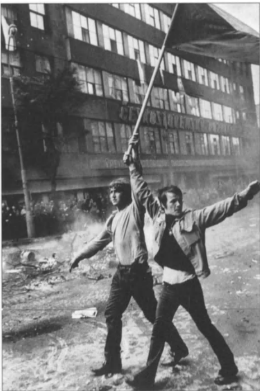
Jóvenes checos en Praga durante la invasión de Checoslovaquia por las tropas del Pacto de Varsovia en agosto de 1968.

La libertad de expresión es un derecho fundamental indivisible de los demás derechos. Dicho de otro modo, es un derecho necesario para el ejercicio y la protección de los demás. Sin libertad de expresión y sin posibilidad de acceso a la información no se puede participar en el debate nacional sobre la política económica del gobierno ni obtener la información imprescindible para proteger la propia salud; sin libertad de palabra es imposible pronunciarse abiertamente contra violaciones de