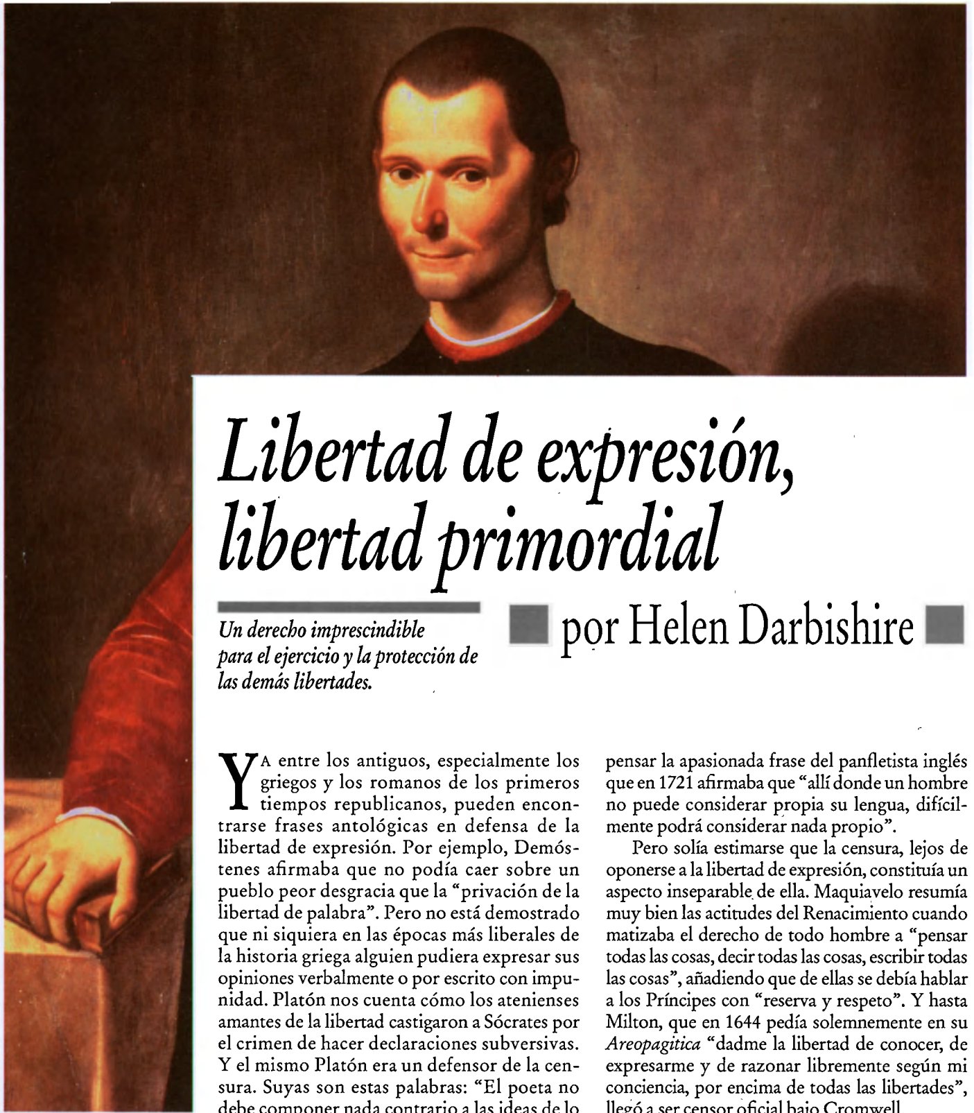
Retrato de Maquiavelo (detalle) por Santi di Tito (1536-1603).