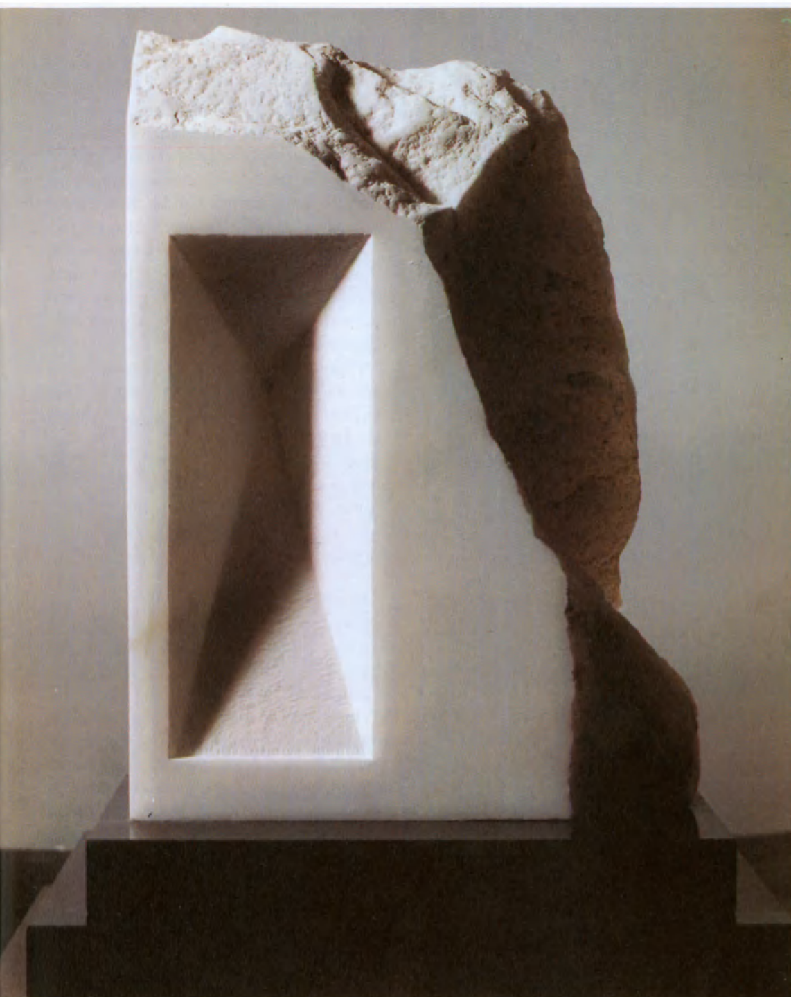
Fin de siglo (1993), escultura en mármol de Carrara de la artista argentina Eugenia Wolfowicz.

Sin detenerse en las peripecias que agitaron la conferencia en cuanto a la oportunidad de su presencia en el comité de redacción de la declaración final o sobre el número de asientos que convenía reservarles en la sala de las reuniones plenarias, se puede hoy día apreciar cuánto terreno lograron conquistar y en qué medida influyeron en el documento con que culminó la reunión de Viena.