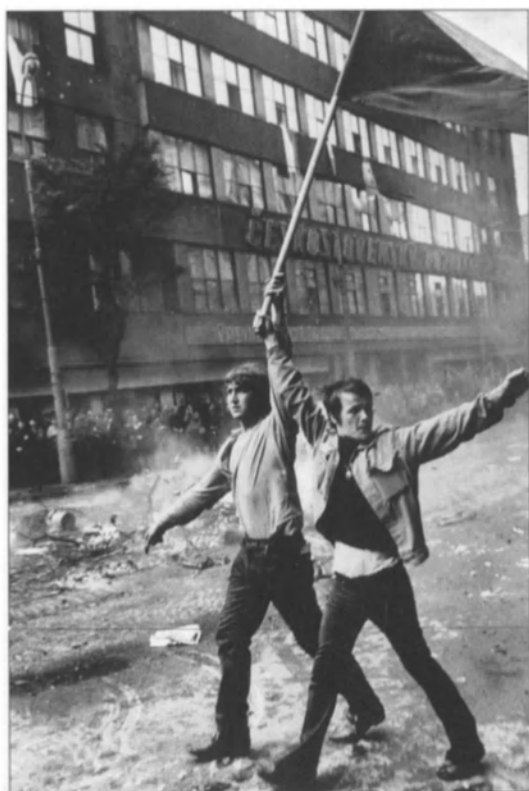
Jóvenes checos en Praga durante la invasión de Checoslovaquia por las tropas del Pacto de Varsovia en agosto de 1968.

La libertad de expresión es un derecho fundamental indivisible de los demás derechos. Dicho de otro modo, es un derecho necesario para el ejercicio y la protección de los demás. Sin libertad de expresión y sin posibilidad de acceso a la información no se puede participar en el debate nacional sobre la política económica del gobierno ni obtener la información imprescindible para proteger la propia salud; sin libertad de palabra es imposible pronunciarse abiertamente contra violaciones de