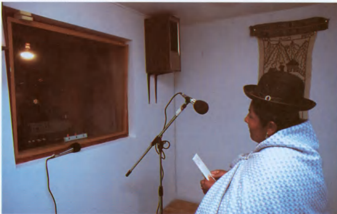
E studio de grabación de radio Pachamama, emisora de los indios aymará en La Paz, Bolivia.

tancia del derecho a la libertad de expresión. Las Naciones Unidas han nombrado en 1993 un relator especial sobre la libertad de expresión entre cuyas atribuciones se incluye la de recibir denuncias de violación de ese derecho formuladas por individuos y por ONG y transmitir las a los gobiernos interesados. Y, por último, han declarado el 3 de mayo Día Mundial de la Libertad de Prensa. ■