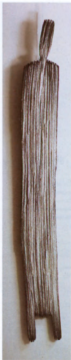
Mujer (1992), técnica mixta. Escultura de Anne Delfieu.

Numerosas asociaciones expresaron su decepción por los escasos resultados de una conferencia que no pudo ir más allá de la reafirmación de unos cuantos principios, sin dotarlos del brazo secular indispensable para su aplicación. Todas proclamaron que no cejarían en su lucha mientras no prevaleciera el derecho sobre la fuerza bruta. No se hacen ilusiones y saben que su combate seguirá siendo arduo. Al introducirse poco a poco en la ciudadela de las Naciones Unidas, tras haber conquistado en Viena algunos de sus bastiones, esperan sobre todo que sus miembros dejen de morir en silencio. Y que las Naciones Unidas se hagan eco de sus reivindicaciones con menos timidez que hasta ahora. ■