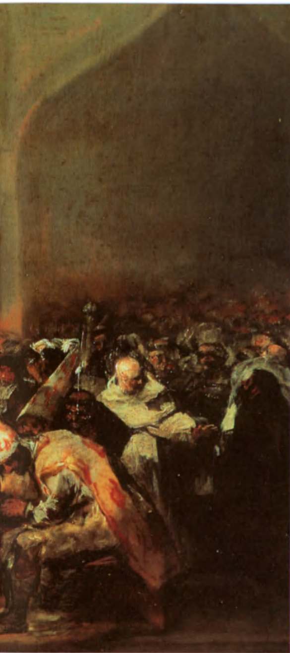
A la izquierda, Tribunal de la Inquisición , obra de Francisco de Goya (1746-1828).