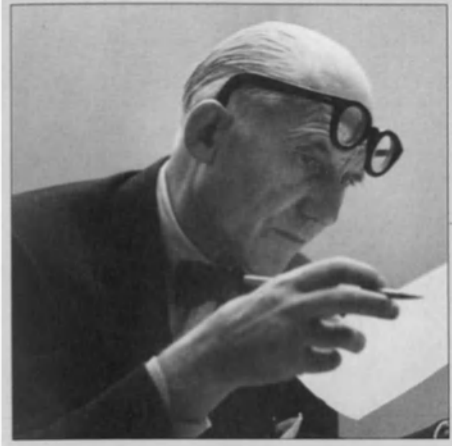
Charles Edouard Jeanneret-Gris, llamado Le Corbusier (1887-1965).

Arquitecto y urbanista de fama mundial, Le Corbusier fue el creador, entre otras obras, de la Cité Radieuse de Marsella y de la ciudad india de Chandigarh. En una reunión organizada en Venecia, en 1934, por el Instituto Internacional de Cooperación Intelectual, Le Corbusier expuso su concepción del urbanismo y precisó en un brillante análisis, del que publicamos los fragmentos más significativos, en qué consiste, a su juicio, la excepcional armonía de Venecia.