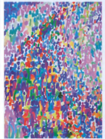
Nuestra portada: Crowd XV (Muchedumbre XV) , acuarela de la artista estadounidense Diane Ong.