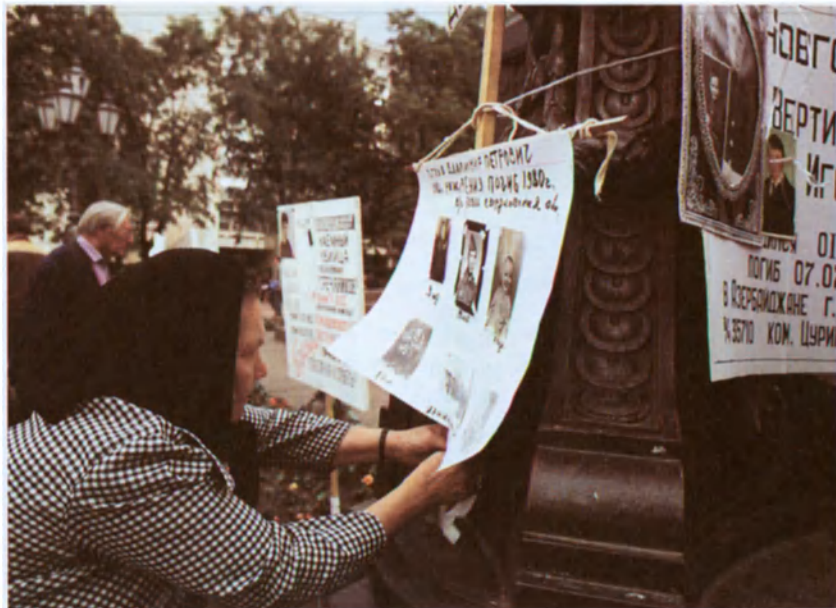
Mujeres moscovitas exigen informaciones oficiales sobre soldados rusos desaparecidos, Moscú, 1992.

¿Cómo lograr que la “voz de los pueblos”, tal como se expresaba libremente y a menudo de manera polémica en el Foro de las ONG, fuera oída en las deliberaciones intergubernamentales sobre un documento que comprometía a los