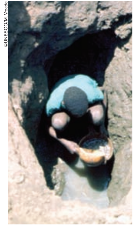
Hombre sacando agua con una escudilla (Kenya).