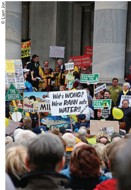
Manifestantes protestando contra la deficiente gestión y la excesiva asignación de agua.