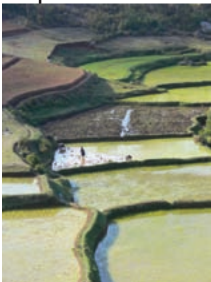
El agua es un factor crucial para el desarrollo económico.