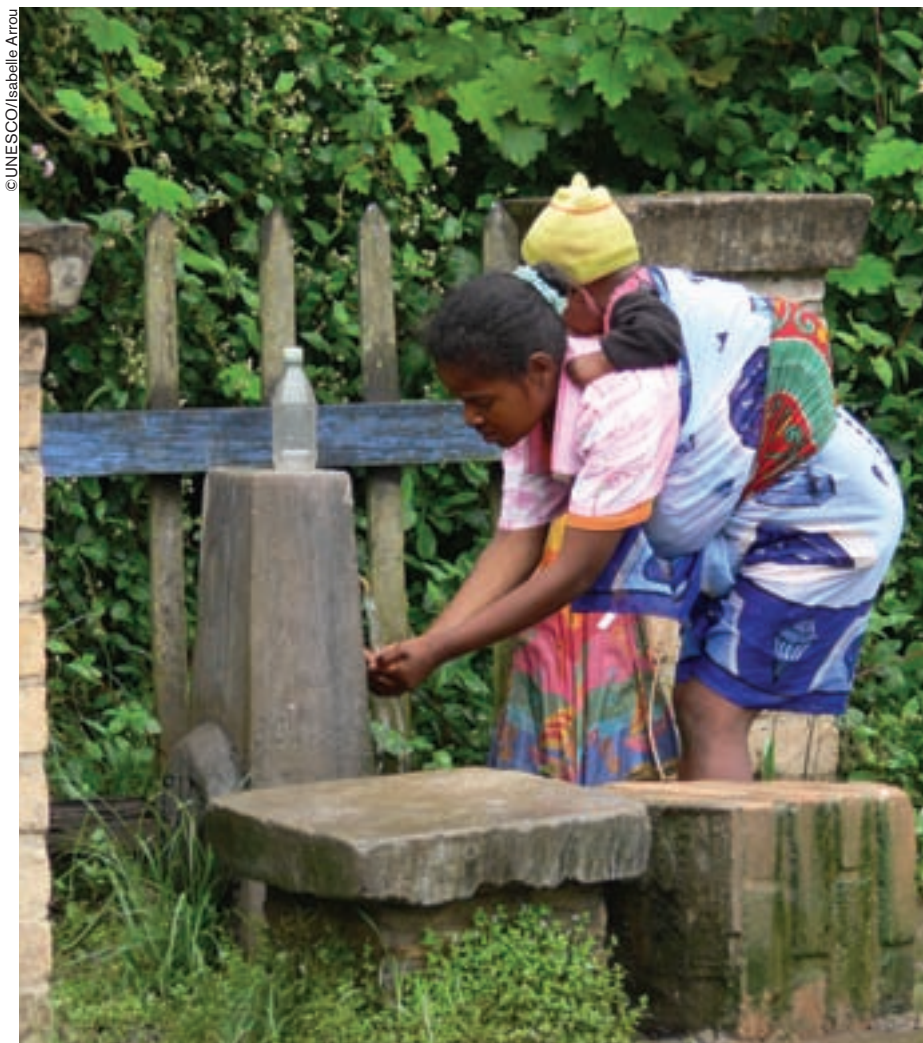
“Para hacer frente a la crisis actual, las infraestructuras y la administración del agua son más importantes que nunca”. Mujer malgache yendo a buscar agua de la fuente.

manda en el plano económico, social y jurídico, o en estos tres planos a la vez. Cuando la situación empeora, puede ser necesario trasvasar el agua de unos sectores a otros, y entonces la competición puede degenerar en conflicto. Por eso es muy importante tratar con acierto la competición, a fin de impedir los conflictos. Las recomendaciones que formula el informe son de carácter general, como de costumbre. Pero el informe indica que tanto los problemas del agua como sus soluciones dependen de las circunstancias específicas de cada país o sociedad: dotación de recursos, capacidad financiera, cultura y marco jurídico. Cada país tiene que tratar de encontrar sus propias soluciones, sacando lecciones de los que han logrado resolver con éxito sus problemas.