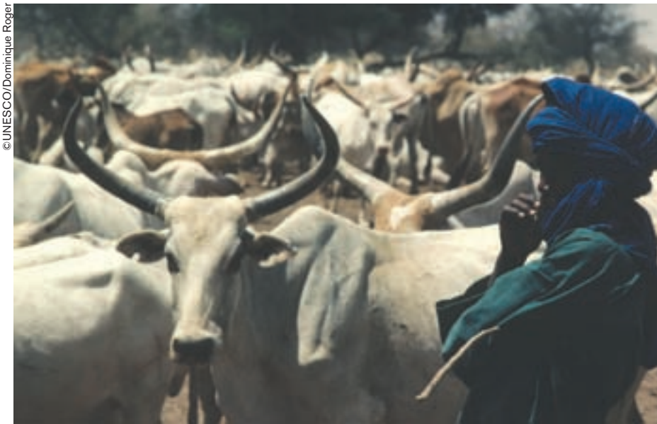
Rebaño de ganado en Abidi, Senegal.