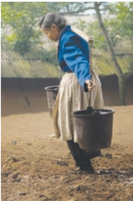
La vida diaria en la aldea miao de Ajigen.