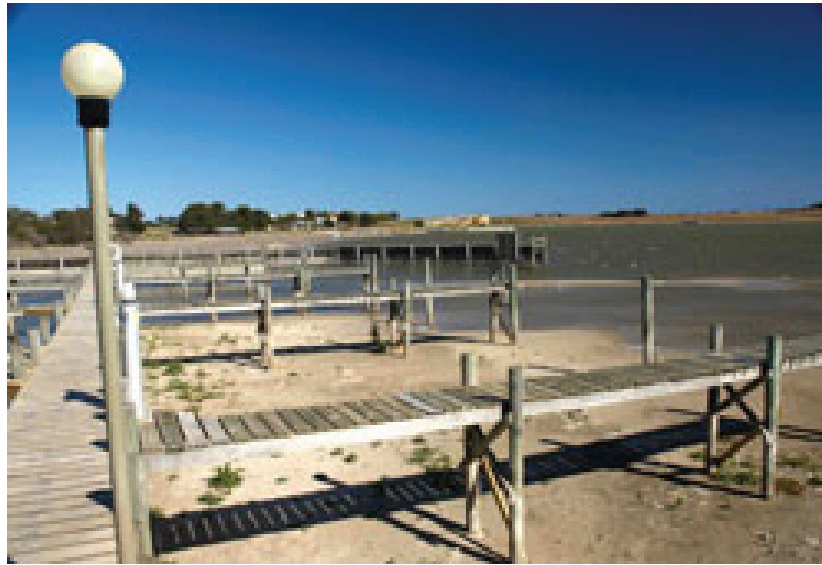
En la parte baja de la cuenca hidrológica del Murray-Darling, el nivel del Lago Alexandrina ha disminuido en proporciones alarmantes.

Invertir el sistema de sobreasignación de recursos de agua y atacar al mismo tiempo los efectos nefastos del recalentamiento climático y la sequía: tal es el desafío mayor que se ha impuesto a la nueva Autoridad de Gestión de la Cuenca del Murray-Darling, nacida en Australia en 2008. En el lapso de siete años el caudal de una de las mayores cuencas fluviales de Australia había descendido en casi el 80%.