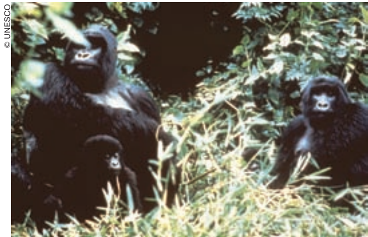
Familia de gorilas (Uganda).

Al igual que los elefantes, los gorilas son una especie migratoria que necesita grandes espacios. Para proteger esta especie animal no hay que acotar vastas extensiones de terreno, sino enseñar a las poblaciones cómo pueden contribuir a su preservación aplicando políticas adecuadas de ordenación territorial. Una empresa de este tipo exige educar a la juventud y la UNESCO no ha esperado la proclamación del Año Internacional del Gorila para iniciarla.