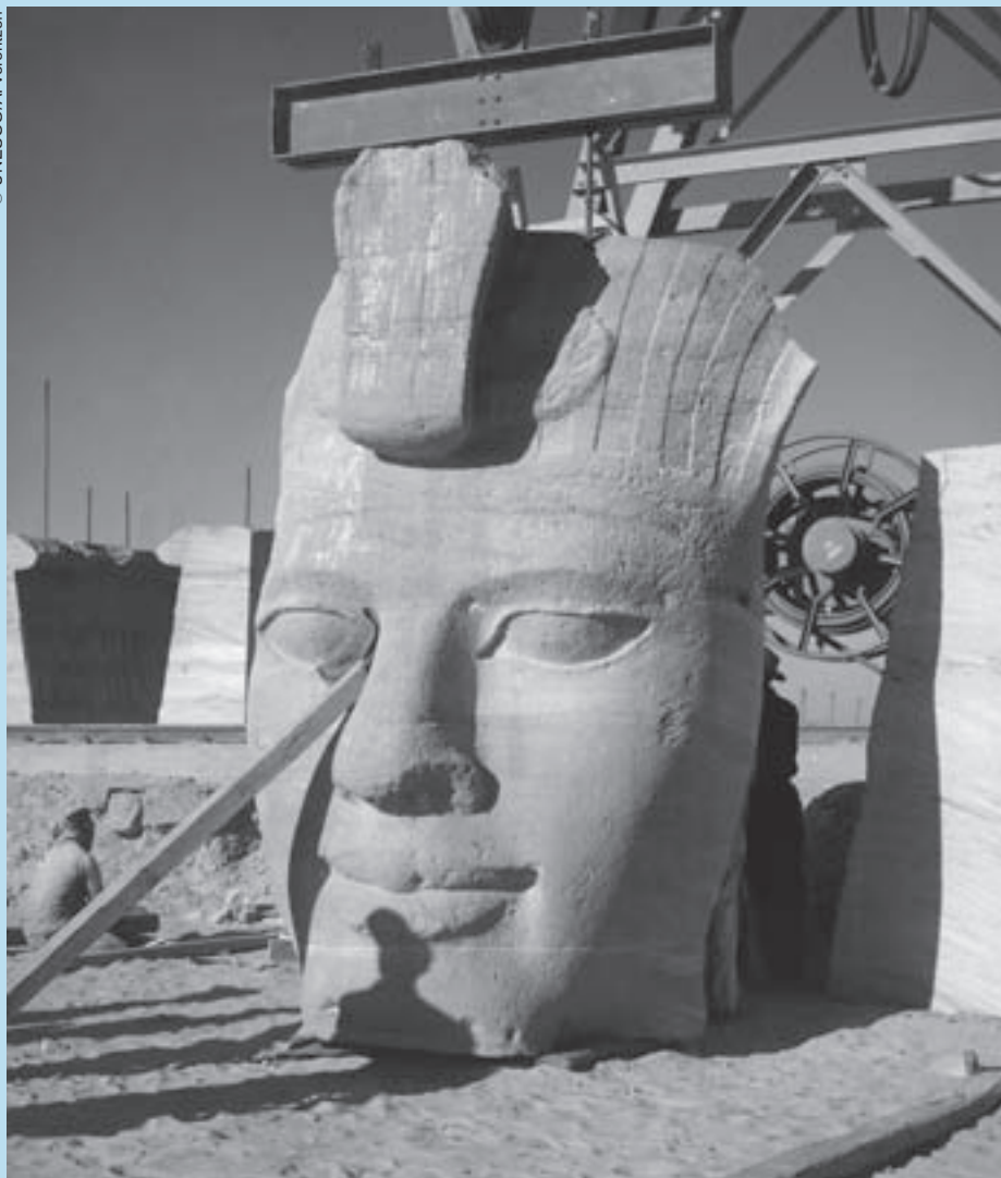
Campaña de Nubia: cabeza de uno de los colosos del Gran Templo, cortada y almacenada para su posterior reensamblaje.