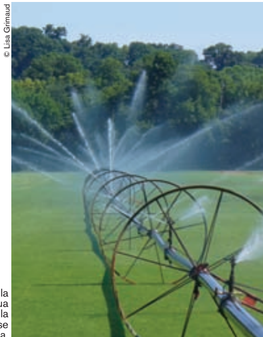
Cerca de la mitad del agua usada en la agricultura se desperdicia.