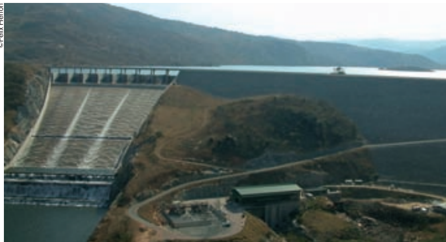
Una presa en Swazilandia.