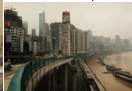
Muelles de Shanghai (China).