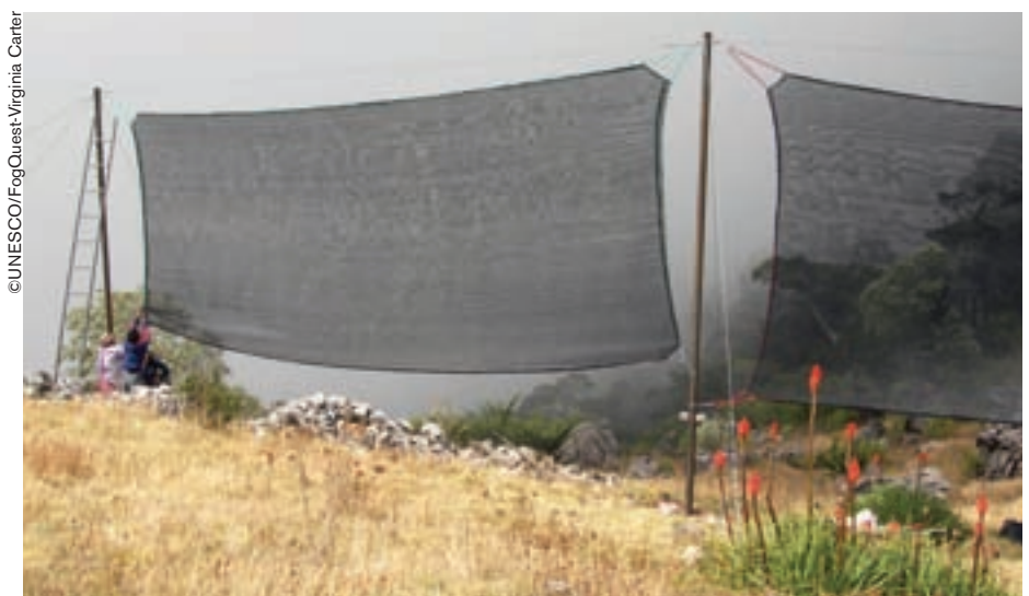
La construcción de redes de niebla en La Ventana, Guatemala.