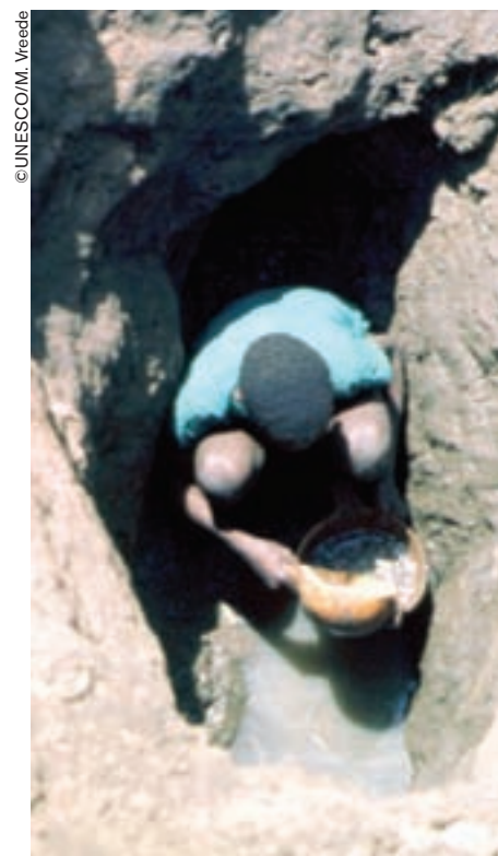
Hombre sacando agua con una escudilla (Kenya).