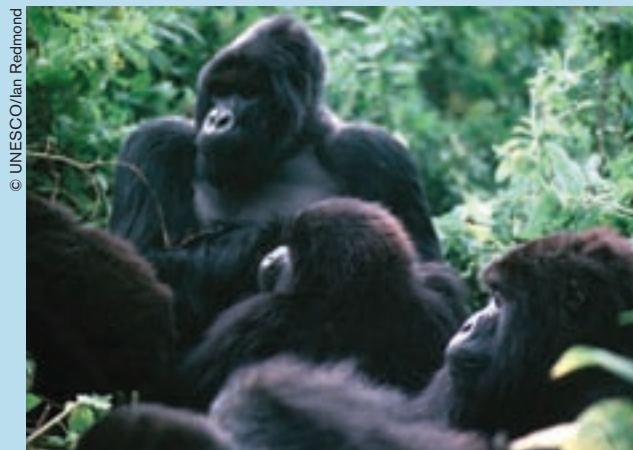
El viejo gorila de montaña Titus con su grupo de congéneres (Congo).