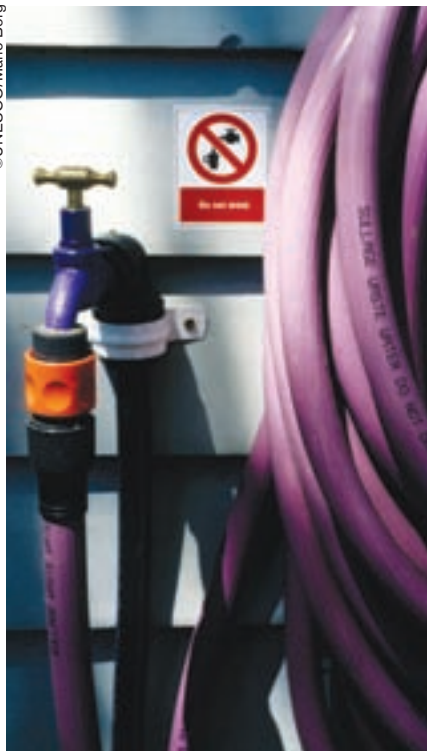
Tuberías para aguas residuales, Melbourne, Victoria, Australia.