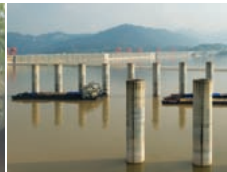
Barcos con rumbo a Shanghai, en espera de franquear una esclusa de la presa de las Tres Gargantas.