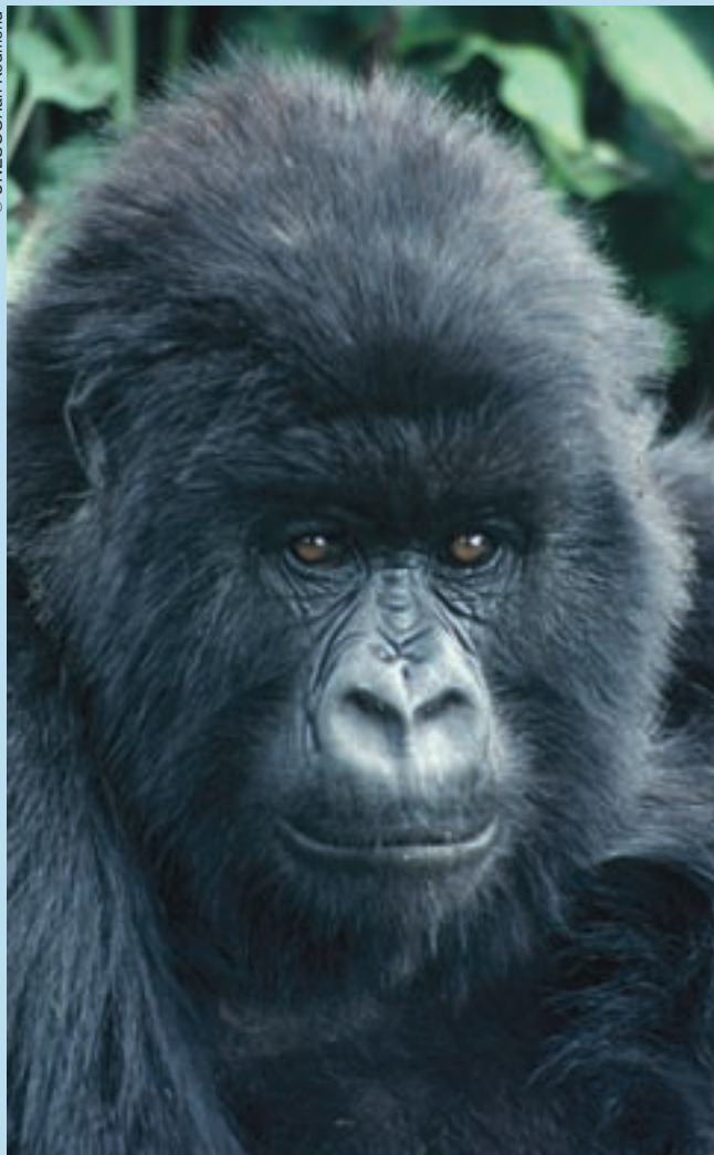
Un gorila de montaña joven (Rwanda).