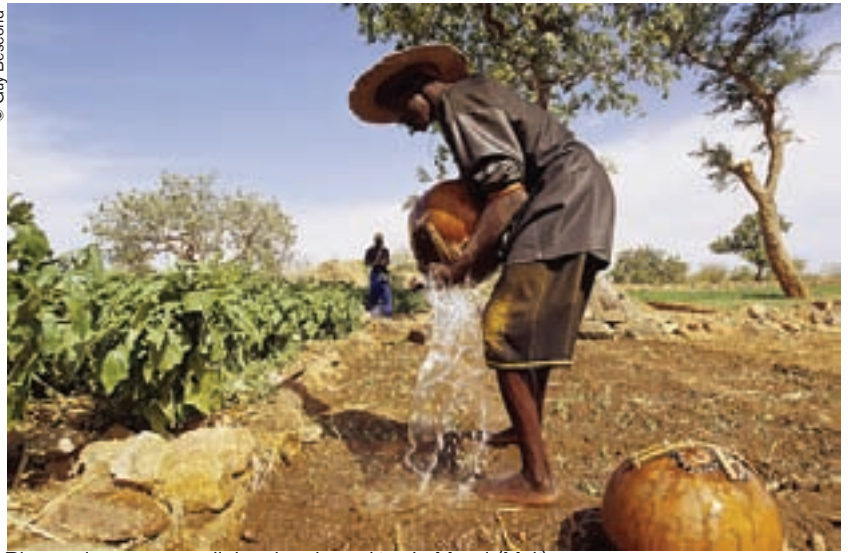
Riego a la usanza tradicional en la región de Mopti (Mali).

El agua que bebemos plantea menos problemas que la que “comemos”.