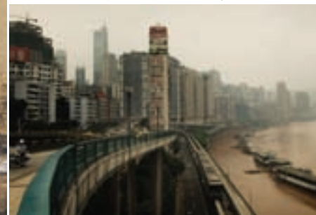
Muelles de Shanghai (China).