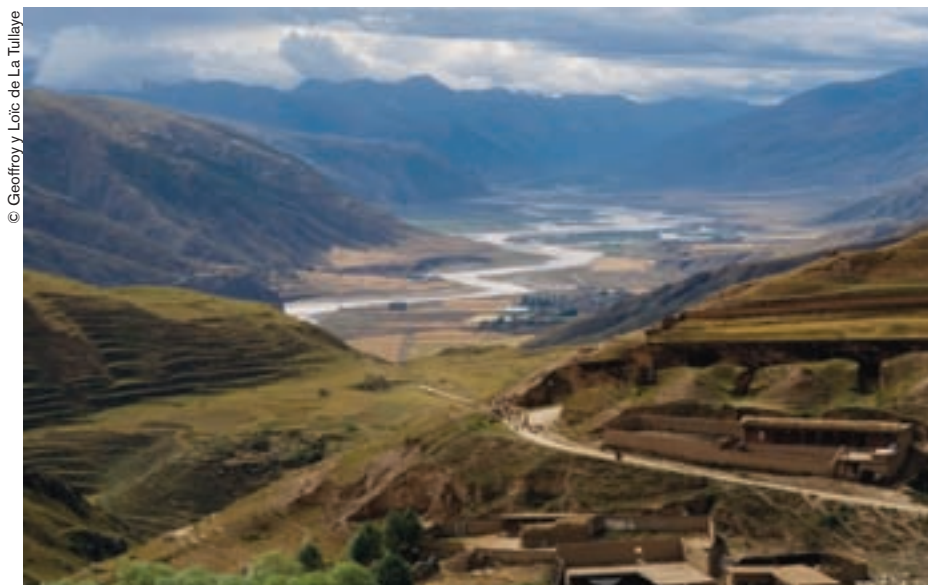
El Yangtsé, en las cercanías de la ciudad de Yushu.

En las orillas del Yangtsé, el río más largo de Asia que extiende sus aguas a lo largo de unos 6.000 km a través de China, yaks y yurtas coexisten con automóviles y edificios. "Río nutricio" de 600 millones de chinos es, en forma incontestable, fuente de desarrollo. Pero, para poder aprovecharlo, es preciso disponer de los medios necesarios.