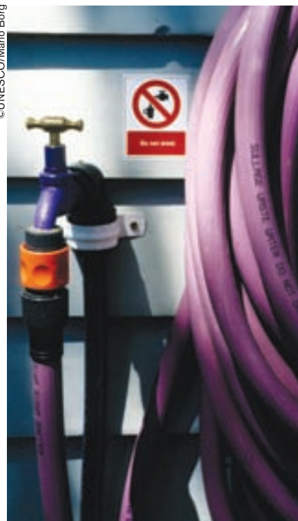
Tuberías para aguas residuales, Melbourne, Victoria, Australia.

En el campo se adoptó otra medida: al haber aumentado el valor del agua, los agricultores reemplazaron los canales abiertos costosos y las rampas de aspersión aérea por un sistema de irrigación gota a gota controlado por ordenador. El agua que antes servía sólo para inundar los cercos y abrevar al ganado se destina ahora al cultivo de la vid, las frutas y las verduras.