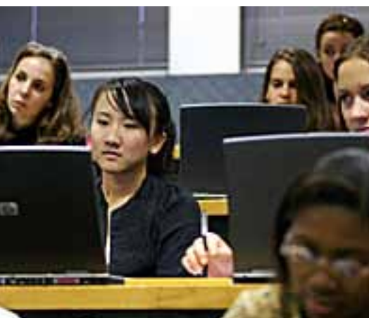
Las TIC son una herramienta de gran ayuda para alcanzar los Objetivos de Desarrollo del Milenio.

La colaboración entre el sector privado y la UNESCO, antes limitada al mero patrocinio, es ahora más variada y ambiciosa. Las tecnologías de la información y la comunicación (TIC) proveen un terreno de experimentación privilegiado para esta nueva cooperación con la empresa.