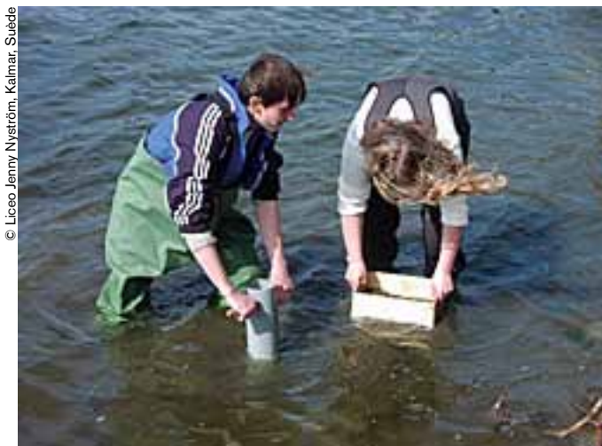
© Liceo Jenny Nyström, Kalmar, Suecia

Cada año, los alumnos toman muestras para estudiar la calidad del agua.