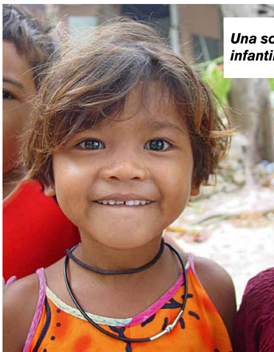
Una sonrisa infantil.

Durante gran parte del año, los moken viven a bordo de barcas de madera.