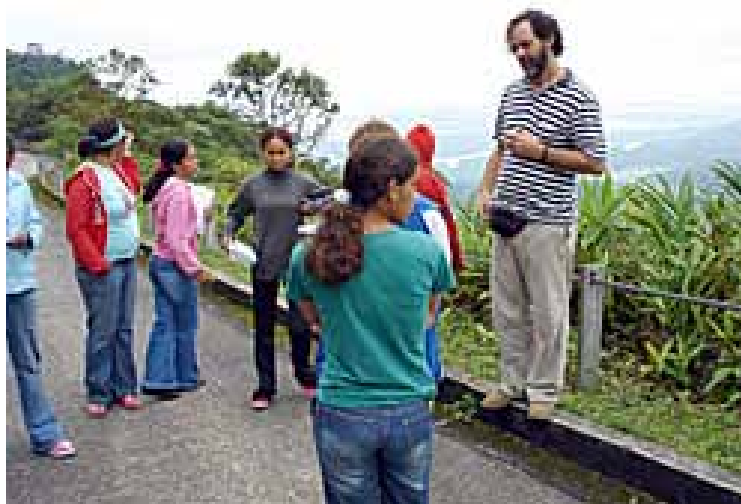
Más de 700 jóvenes han seguido ya los cursos de ecoturismo en la reserva.

La carretera que llega a Paranapiacaba corta una región de la Mata Atlántica brasileña, uno de los veinticinco santuarios de biodiversidad del mundo. A lo largo del camino, el bosque, bastante bien conservado, exhibe en esta época del año los manacás florecidos, cuyas flores lilas y blancas contrastan entre la exuberante vegetación verde. Cuesta creer que un paraíso natural así pueda existir dentro de la región metropolitana de São Paulo con 17,8 millones de habitantes. A 40 minutos de aquí, la gran megalópolis brasileña es un mar de cemento y contaminación.