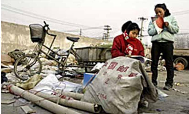
En un basurero de Beijing (China), se recuperan los materiales reciclables para revenderlos.

Este juego especial forma parte de una carpeta pedagógica distribuida por la Comisión Alemana para la UNESCO, a comienzos del presente curso escolar, en unos 300 centros docentes alemanes –desde parvularios hasta colegios de secundaria– que pertenecen a la Red del Plan de Escuelas Asociadas (PEA) de la UNESCO. La operación, que tiene por objeto sensibilizar a los jóvenes al desarrollo sostenible a partir de aspectos de su vida cotidiana, es tanto más excepcional cuanto que este tema sólo se va introduciendo a duras penas en los planes de estudios.