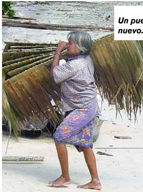
Un pueblo nuevo.

Hoy, a pedido de las autoridades locales, los moken están reconstruyendo sus pueblos de bambú y de hojas trenzadas tierra adentro. Se han instalado en el centro del bosque, en una zona más alejada del mar y por lo tanto más segura. Pero esto tendrá consecuencias sobre el porvenir de estos pescadores, cuya vida comunitaria sucede por y para el mar. Hace ya varios años que la influencia del mundo exterior se hace sentir. Como las autoridades del parque nacional les han prohibido pescar especies como el pepino de mar, o algunos moluscos que también vendían, los moken tienen cada vez menos ingresos. Algunos de ellos han abandonado la pesca para trabajar como guías de submarinismo para los turistas o como basureros. El objetivo del programa de la UNESCO Regiones costeras e islas pequeñas es llamar la atención internacional sobre la suerte de los moken y de otras comunidades de "gitanos del mar" presentes en Tailandia, para permitirles seguir viviendo en el respeto de sus costumbres seculares en el sendo del Parque Nacional que engloba su zona de pesca y su habitat tradicionales.