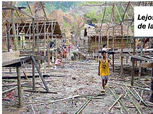
Lejos de la costa.

Esta mujer, salvada del tsunami, participa en la reconstrucción de su pueblo.