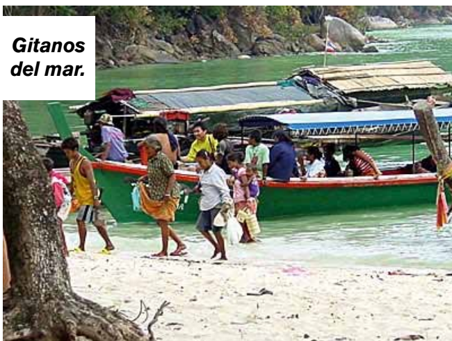
Gitanos del mar.

Para más seguridad, el nuevo poblado se está construyendo más lejos del mar.