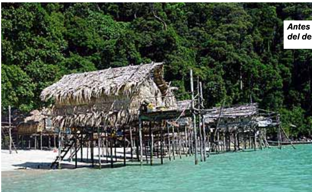
Antes del desastre.

de Ciencias) y Sistemas de Conocimientos de las Poblaciones Autóctonas (LINKS), la UNESCO se interesa desde hace varios años por los pueblos autóctonos de las costas del mar de Andaman y en particular por los moken, que viven