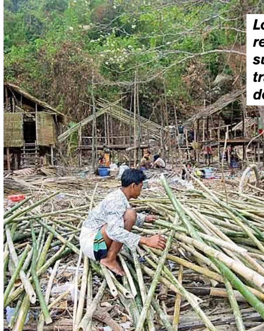
Los moken reconstruyen sus viviendas tras el paso del tsunami.

Poco después del desastre, la oficina de la UNESCO en Bangkok participó en una de las misiones organizadas por el Equipo de Naciones Unidas para Evaluación y Coor-