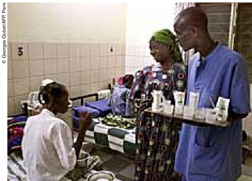
En Burkina Faso, la tasa prevalencia de infecciones de VIH/SIDA supera 4%.

En la plaza del mercado de Manga, una localidad situada a 105 kilómetros al este de Uagadugu, los comerciantes cierran sus tenderetes a medida que el sol se va ocultando. En medio de las tabernas donde la gente va a beber "dolo" –bebida local de mijo fermentado–, la compañía del Taller de Teatro Burkinabé empieza a instalar su escenario y decorados ante un público impaciente. En un abrir y cerrar de ojos todo está listo para La tos de la serpiente, una obra representada con el patrocinio del Programa Nacional Antituberculoso y la Dirección Provincial de Sanidad en el marco de sus campañas de prevención de