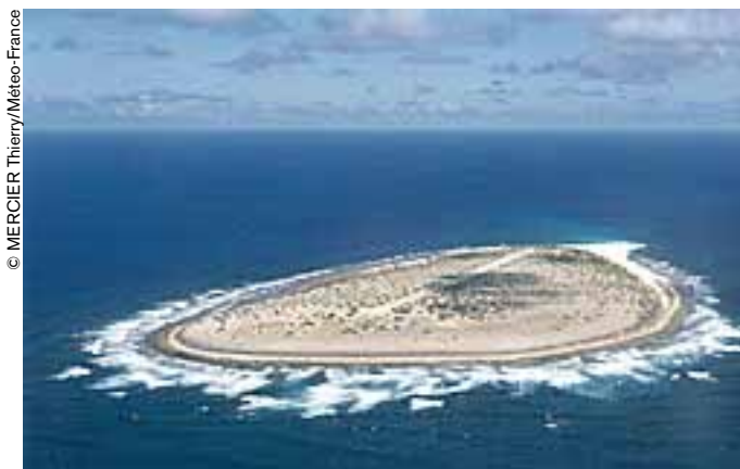
Esta isla perdida en el Océano Índico lleva el nombre del salvador de los naufragos: Tromelin.

El 31 de julio de 1761, el navío francés L'Utile naufragó en un islote del océano Índico. Poco después, sus tripulantes logran escapar a Madagascar, pero dejan tras de sí a los esclavos malgaches embarcados ilegalmente. La UNESCO abre este capítulo oculto de la trata negrera.