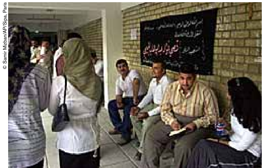
Los laboratorios de la universidad Mustansiriyah de Bagdad cuentan con equipos muy rudimentarios.

Iraq necesita a su elite más que nunca. Las universidades tratan