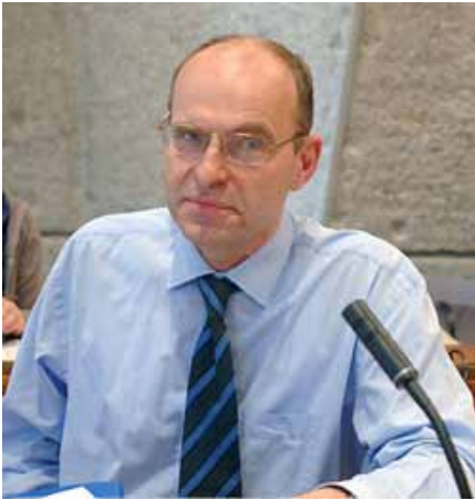
Rieks Smeets, jefe de la Sección del Patrimonio Inmaterial de la UNESCO.

las que se hicieron en 2001, 2003 y 2005. Una vez que la Convención entre en vigor, las obras maestras que se encuentran en el territorio de los Estados Partes serán inscritas en la Lista Representativa del Patrimonio Oral e Inmaterial de la Humanidad. Las condiciones según las cuales serán