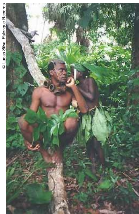
En 2005, la UNESCO proclamó la cultura palenquera obra maestra del patrimonio inmaterial.

Por último, el patrimonio inmaterial ha suscitado un interés particular en las regiones más periféricas de Colombia. Ocho departamentos, casi todos en la selva del sur (Caquetá, Putumayo, Guainía, Vaupés, Guaviare, Meta, Huila y Cauca), que albergan más de 70% de las comunidades indígenas del país, han iniciado proyectos de inventarios que, sin duda, contribuirán a seguir impulsando este nuevo boom.