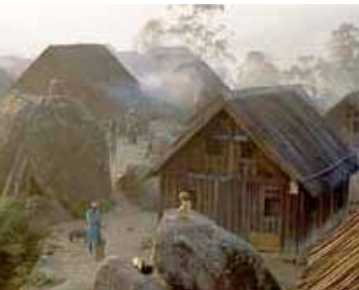
La cultura zafimaniry está asentada en un centenar de aldeas del sureste de Madagascar.

En la actualidad esta cultura está en peligro. Luego de los padecimientos sobrevenidos por la escasez de los años 1950, los zafimaniry empezaron a vender sus artesanías, pero, a diferencia de los distribuidores, no supieron valorizar su comercio ni tampoco evitar las falsificaciones. Además, debido a la creciente deforestación de la región comenzaron a carecer de materia prima y se volcaron hacia otras actividades como la cultura itinerante sobre trozos quemados del monte, fenómeno que agrava la deforestación. Por último los jóvenes tienden a migrar buscando trabajo en las ciudades o proponiendo sus servicios en los astilleros participando así en el fenómeno del éxodo rural y por tanto en la disgregación de la identidad zafimaniry. Es por ello que la UNESCO lanzó un plan destinado a proteger el medio ambiente natural de la comunidad y a velar por la transmisión de las técnicas tradicionales. Una manera de proteger los conocimientos adquiridos a través de los siglos por los zafimaniry, "los descendientes de aquellos que desean".