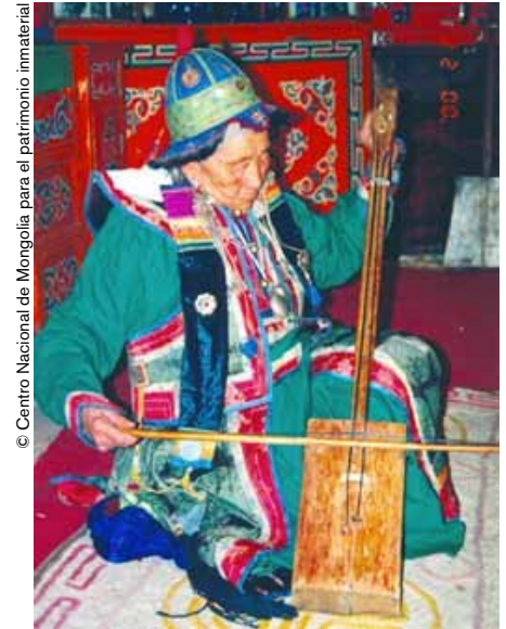
Música tradicional de Morin Khuur (Mongolia).

autoridades, sobre todo a nivel local, a la existencia, los valores e importancia de tal patrimonio. Y en ese terreno hay aún mucho trabajo por hacer.