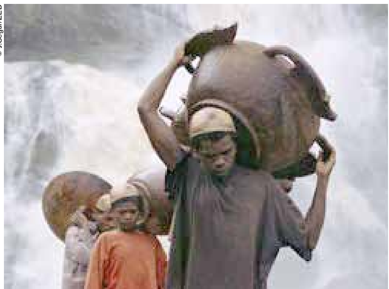
Los zafimaniry son los últimos que practican el trabajo en madera.

Los zafimaniry, un territorio de 700 km 2 que incluye un centenar de aldeas distantes.