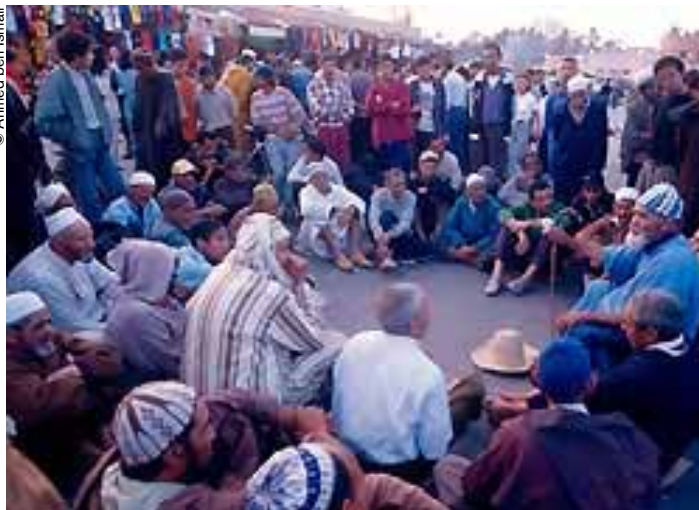
El espacio cultural de la plaza de Jemá el Fna es, desde 2001, una de las obras maestras del patrimonio inmaterial.