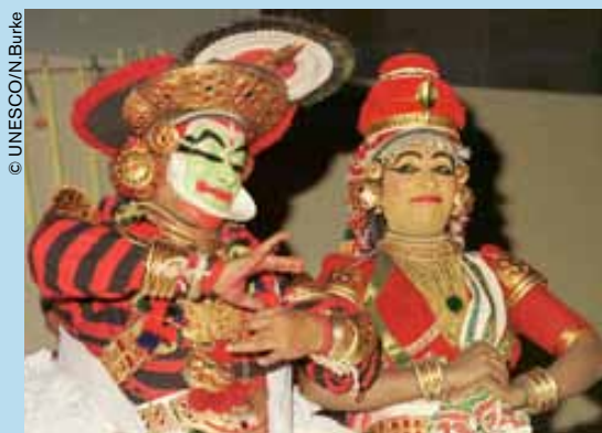
Kuttimayam (India), teatro sánscrito de la provincia de Kerala.

Entre los nuevos valores del patrimonio cuyo reconocimiento debe favorecer la UNESCO, revisten una importancia singular aquéllos que, más impalpables que las piedras, guardan relación con la memoria de los pueblos.