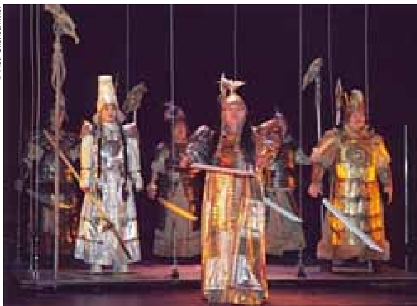
Una escena del espectáculo olonjo "Kyys Debilié".