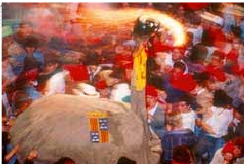
La Patum de Berga.

Entrevista realizada por Agnès Bardon y Stephen Roberts.