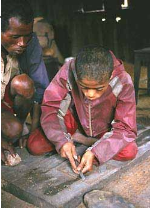
Técnica del trabajo en madera.

pidas en palisandro, pero también taburetes, potes de miel, y baúles labrados cuyo renombre llegó incluso a Escandinavia y Japón.