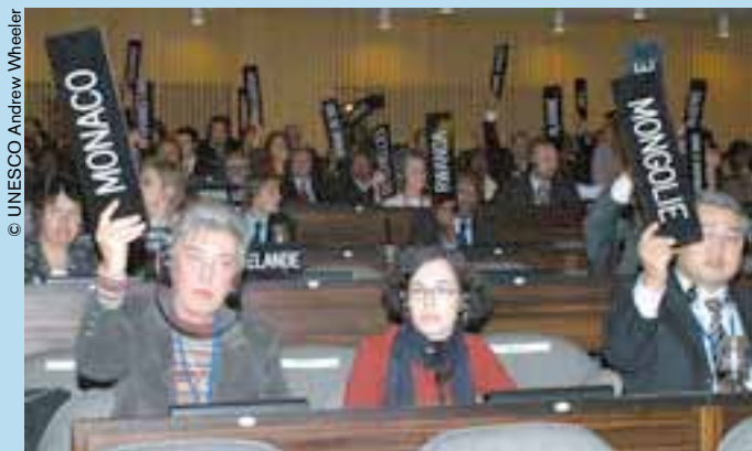
Adopción de la Convención por la Conferencia General de la UNESCO, en octubre de 2003.