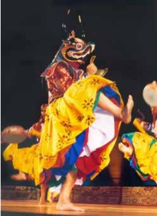
Manifestación del patrimonio inmaterial de Asia del Sur celebrada en la Sede de la UNESCO en marzo de 2006.