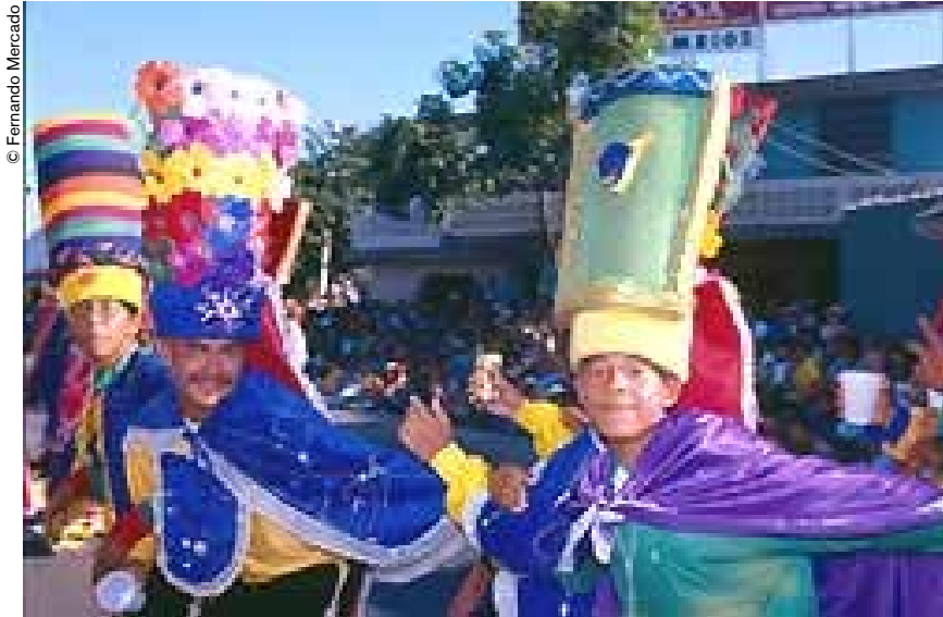
© Fernando Mercado Carnaval de Barranquilla.

Un comercial recientemente emitido en horas de gran audiencia por la radio y la televisión colombiana es un murmullo de voces que van subiendo y en el que se empiezan a notar diversas lenguas. Algunas se oyen como con el dejo sin pausa de los idiomas que provienen del mandarín; otras sugieren la fonética fuerte de las hablas eslavas: da la impresión de estar en un espacio internacional con voces de una multitud de nacionalidades. En medio del barullo entra el castellano a través de un poema de José Asunción Silva, gran poeta nacional, y el televidente entiende que todas son lenguas indígenas. La cuña concluye con un mensaje sobre Colombia como país multicultural, en cuyo territorio se hablan lenguas de 65 familias distintas. Otro comercial rescata del olvido al Mohán, un espíritu silvestre de los ríos y los bosques que espantaba a los campesinos cuando salían a jornalear; otro más recuerda