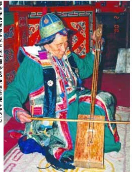
Música tradicional de Morin Khuur (Mongolia).

autoridades, sobre todo a nivel local, a la existencia, los valores e importancia de tal patrimonio. Y en ese terreno hay aún mucho trabajo por hacer.