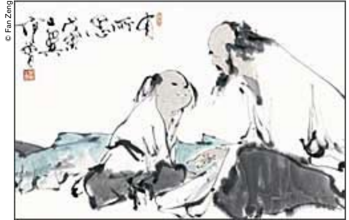
"La alegría de aprender", obra de Fan Zeng (1998).

La naturaleza es sumamente generosa con la humanidad. No sólo le proporciona el aire, la tierra y el agua, esto es, los elementos necesarios para su existencia, sino también una serie de reguladores como la alternancia del sol y la luna, el sople benéfico de los vientos y la caída bienhechora de las lluvias que vienen permitiendo a la humanidad desarrollarse indefinidamente desde sus albores.