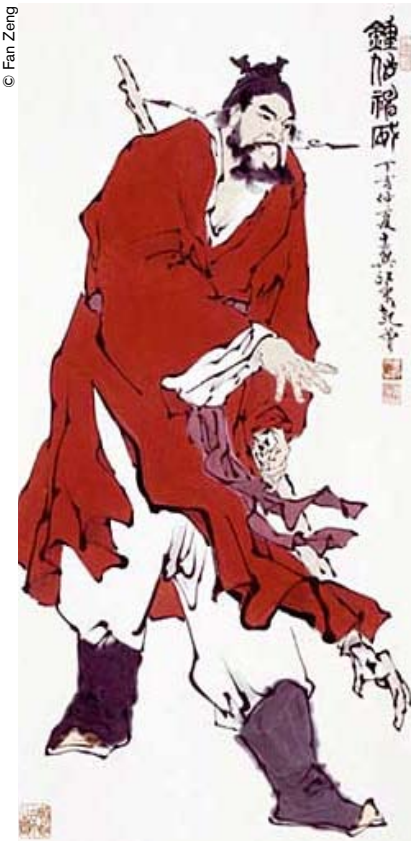
"Zhong kui apartando a los demonios", obra de Fan Zeng (2007)..

Esta existencia en sí, desprovista por completo de logros, encarna la excelencia del cielo y la tierra que da libre curso a la creatividad del alma humana y acoge con generosidad a la pluralidad de inteligencias y talentos humanos. Las semillas de esta belleza perfecta esparcidas por todo el planeta se transforman en virtudes de sinceridad y veracidad, así como en expresiones estéticas. Entre los derechos innatos del hombre, no cabe duda alguna de que figura el "derecho a la experiencia estética", aunque no esté expresamente consignado en los textos de las leyes, quizás porque se considere implícito. Desde la Antigüedad hasta