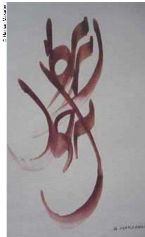
“Derviche danzante”, cuadro de Hassan Makaremi.

“Los hijos de Adán son partes del mismo cuerpo, creados de una misma esencia Si un dolor llega a un miembro del cuerpo Los otros pierden bienestar Si no sufres por el dolor ajeno No mereces estar en dicho cuerpo” Estos versos figuran en la entrada del “Hall de las Naciones” de la Sede de las Naciones Unidas en Nueva York.