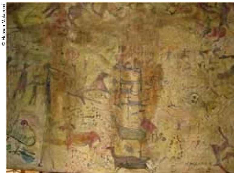
“Del arte rupestre y los derechos humanos”, cuadro de Hassan Makaremi.

Durante el Festival de la Diversidad Cultural organizado por la UNESCO en mayo pasado, Hassan Makaremi pronunció, con el gran maestro chino Fan Zeng, una conferencia sobre “Miradas entrecruzadas sobre la caligrafía”. Entrevistado por Monique Couratier para El Correo de la UNESCO , explica cómo la caligrafía persa de estilo nas'taliq le permitió poner sus ideales en color y movimiento, en una búsqueda personal, enriquecida de intuición poética pero también de rigor científico.