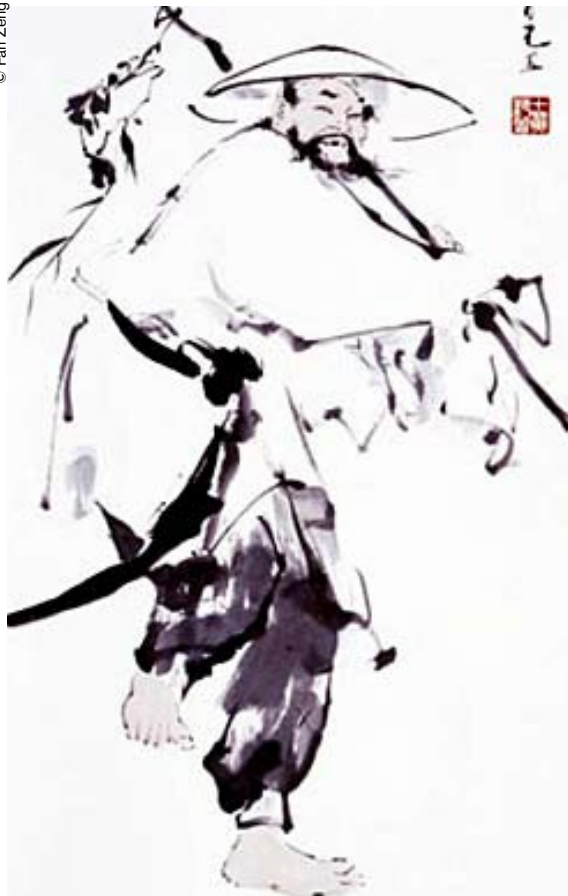
"El canto de un pescador", obra de Fan Zeng (2009).