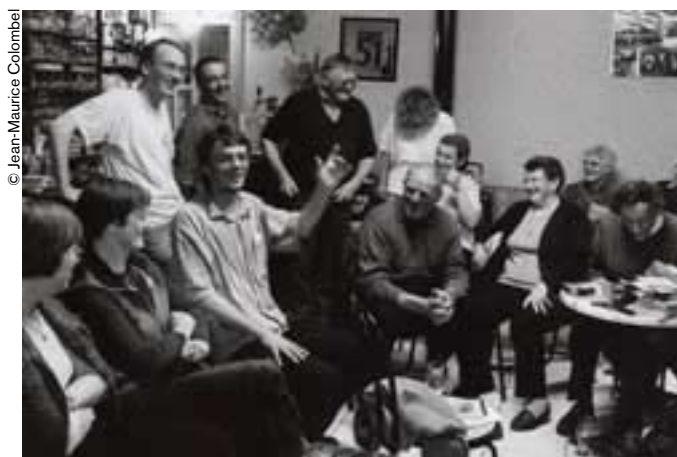
Una velada de canciones en el café de Bovel.

Todavía ayer, los cantos y danzas comunitarios resonaban en las magníficas moradas de piedra y madera. Poco a poco cundió el silencio. Por eso, desde hace algunos años, Birol emprendió la tarea de recopilar, publicar y revivir el repertorio tradicional con una visión que engloba la defensa del patrimonio, del terruño y de la oralidad. Se apoya para ello en su prestigio de músico