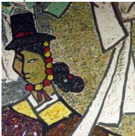
Mou-ak" (danza folclórica). Obra del artista coreano Kim Ki-Chang, donada a la colección de obras de arte de la UNESCO en 1982.