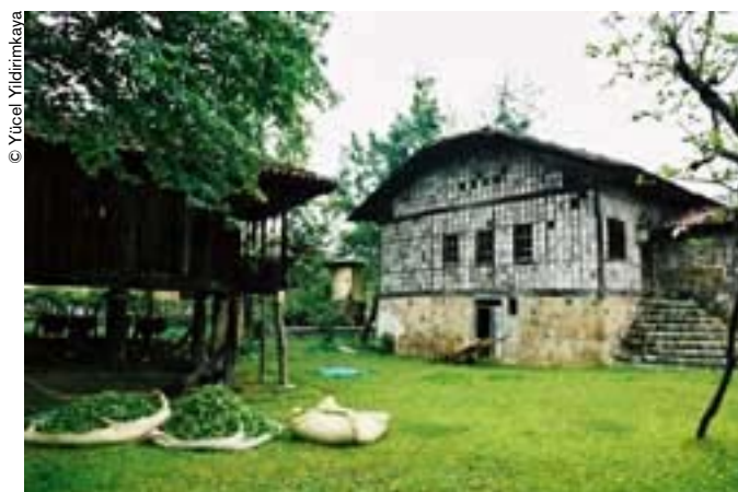
Arquitectura típica del Mar Negro entre los jardines de té.

intérprete de canciones populares turcas, investigadora e intérprete de canciones populares en el Instituto de Lenguas y Civilizaciones Orientales (INALCO) en París, fundó en 2004 la asociación Un puente sobre el Bósforo de la que es presidenta.