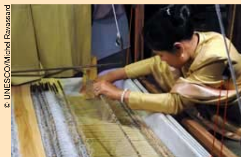
A pesar de la industrialización, la fabricación de la seda tailandesa depende en gran medida de la habilidad manual de las campesinas y obreras.

Champaña francés, rey de los vinos; seda tailandesa, reina de las sedas. Esta podría ser la divisa de la alianza sellada recientemente entre el Comité Interprofesional del Vino de Champaña y el Instituto de Sericultura “Reina Sirikit” de Tailandia. Productos emblemáticos de sus respectivos países, el champán francés y la seda tailandesa son también víctimas de su fama y se ven amenazados por toda suerte de falsificaciones y usurpaciones, que ambos organismos se esfuerzan por contrarrestar.