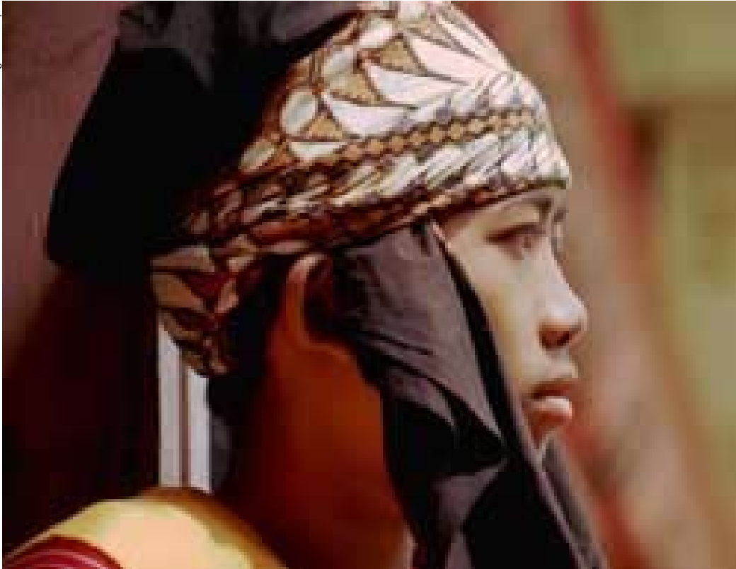
Un habitante de las islas Célebes (Indonesia)

Este año, la celebración del Día Mundial de la Diversidad Cultural (21 de mayo) cobró un relieve excepcional. A lo largo de todo el mes de mayo, decenas de artistas del mundo entero dieron testimonio de la riqueza del patrimonio cultural de la humanidad, en el marco del primer Festival Internacional de la Diversidad Cultural. Celebrado simultáneamente en varios países y en la sede de la Organización, este evento ha mostrado palpablemente la profunda afinidad existente entre la cultura y la diversidad, de la que El Correo de la UNESCO se hace eco.