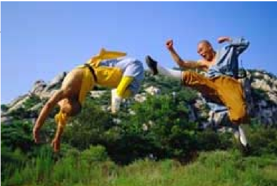
El kung fu de Shaolin es un arte marcial y una búsqueda espiritual.