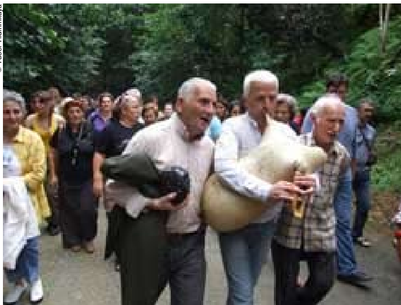
Paseos, marcha y canciones en Rizé (Turquía).

Caído en el olvido durante varias décadas, el folklore bretón conoce hoy día un notable renacimiento. A unos 2.500 kilómetros, los cantos tradicionales vuelven a los hogares anatólios que habían desertado. “Un puente sobre el Bósforo” une músicos de Francia y de Turquía que comparten la misma pasión y las mismas preocupaciones.