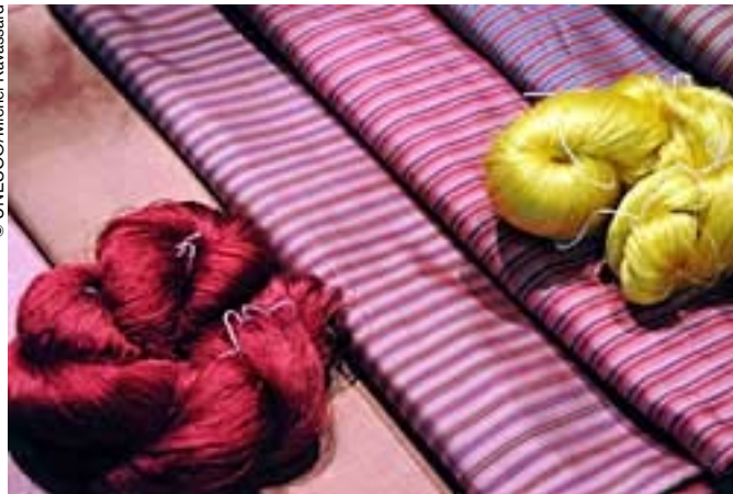
El cultivo de la morera y la cría del gusano de seda en Tailandia datan por lo menos del siglo XIII, según testimonios de esa época.

La fabricación tradicional de la seda en Tailandia, prácticamente exangüe hacia mediados del siglo XX, empezó a cobrar un nuevo auge en el decenio de 1950, gracias a la iniciativa de un ciudadano estadounidense, Jim Thomson. Una de sus más firmes aliadas fue la por entonces joven reina Sirikit. Hoy en día, combinando técnicas seculares y modernas, la artesanía de la seda se perpetúa de generación en generación y contribuye a la prosperidad económica del país.