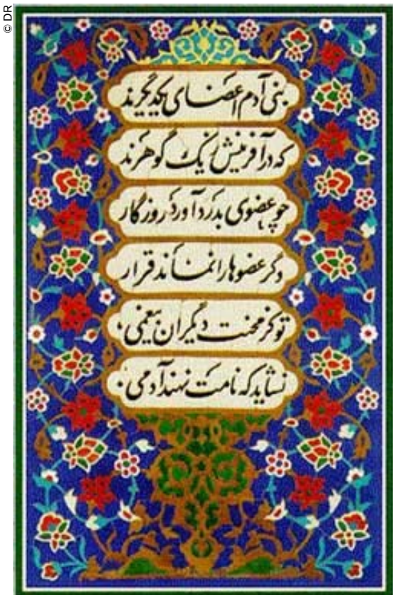
Versos de Sa'adi, célebre poeta persa del siglo XIII.

Lejos del científico de formación que soy la idea de renunciar al rigor, a la claridad y la concisión. Pero sé que el teclado de la computadora no reemplazará jamás a la mano. Y estimo que hoy la caligrafía representa un valor añadido. Porque en un movimiento cómplice con la naturaleza, como un derviche turnante, el gesto del calígrafo filósofo poeta hace “cantar las palabras” que dicen el Universo. Esto es la caligrafía: ¡alquimia de la vida!