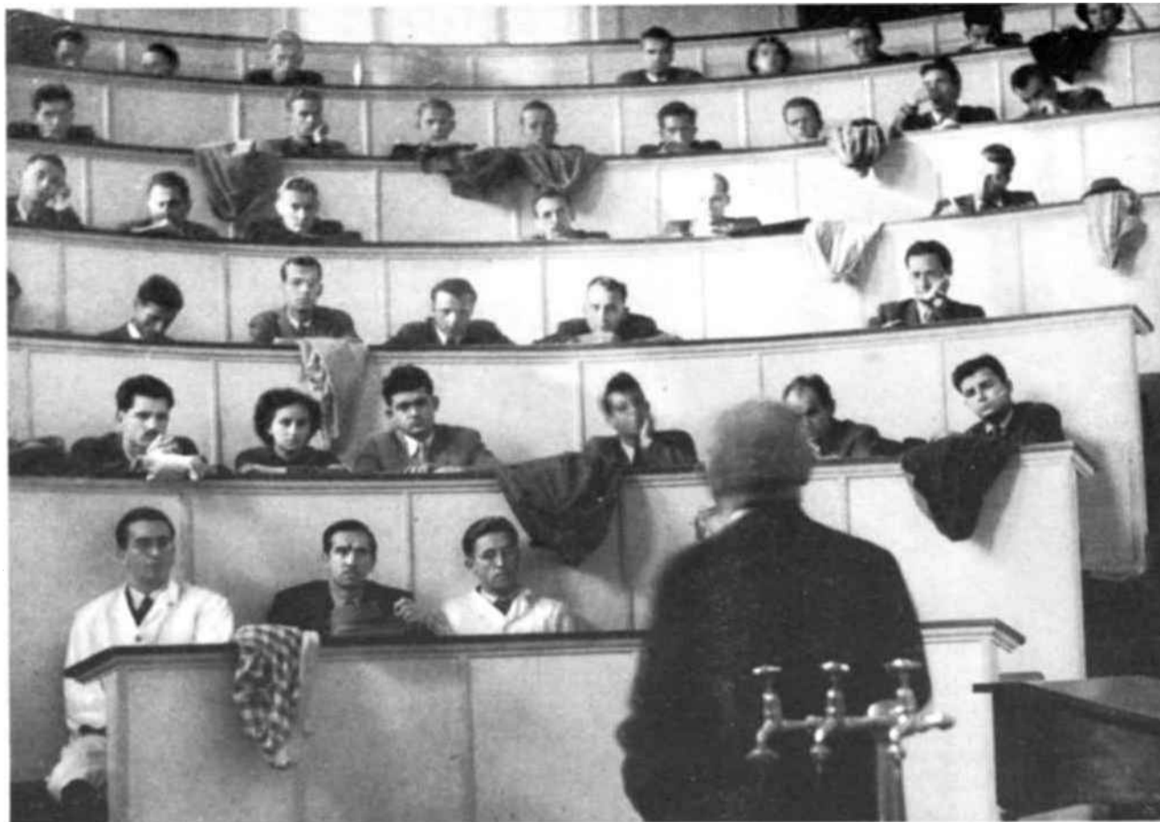
Esta foto ha sido tomada en la Universidad de Zagreb mientras dictaba clase el Profesor Andrija Stampar, conocido sociólogo (de espaldas).

Pero después de la caída de Napoleón, Eslovenia volvió a ser posesión del Imperio austro-húngaro y la enseñanza superior de la Universidad de Ljubljana se redujo de nuevo a lo que había sido antes de la administración francesa. Así siguió hasta 1848. En esa época, a pesar de que los eslovenos habían solicitado la apertura de una Uni-