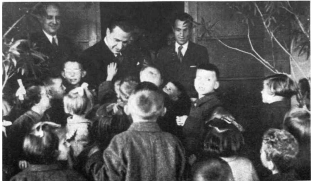
Un grupo de niños yugoslavos saluda al Director General de la Unesco, señor Torres Bodet, durante su visita a un asilo de Zagreb.

«Nuestro país se ha adherido a la Unesco inspirado por el sincero deseo de contribuir al desarrollo de la cooperación intelectual entre los pueblos y entre los Estados... En este país, que las masas trabajadoras han transformado en una enorme cantera para construir un porvenir mejor, se está firmemente convencido de que esa tarea podrá cumplirse, ante todo, luchando activamente por salvaguardar y mantener la paz. Luchar por la paz significa luchar por la verdad, significa luchar por la educación y por la ciencia, contra la psicosis de guerra y el odio entre los pueblos, y luchar además por la comprensión y el respeto mutuo, así como por una colaboración internacional que permita a los diferentes pueblos del mundo, grandes y pequeños, desarrollar libremente su propia cultura nacional.»