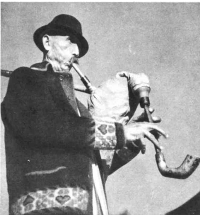
Aquí tenemos un gaitero esloveno con su traje típico.