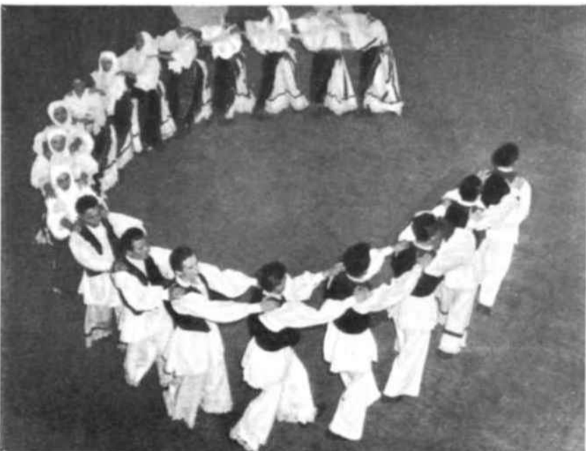
La « kolo » eslovena es una especie de ronda endiablada, llena de colorido.