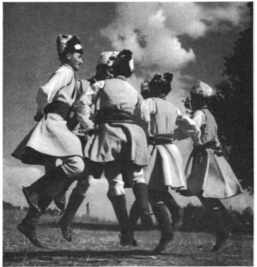
La danza de la minoría rumana se destaca por la ligereza de sus pasos y figuras.