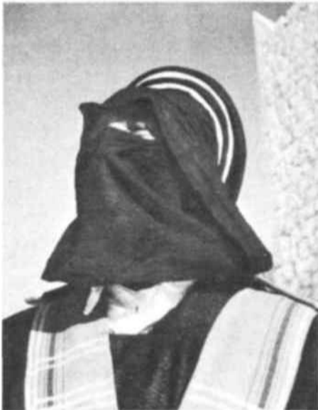
Un ciudadano del nuevo Reino Unido de Libia. Este «tuareg» aparece aquí usando su litham, especie de bufanda con la que se protege la boca contra la arena arrastrada por el viento.

Una reunión de la Asamblea Nacional de Libia, que preside el Mufti de Trípoli, Mohammed Abdul Asa'd Al Alem. Cada uno de los tres territorios de Libia se halla representado en esta Asamblea en la misma proporción de 20 delegados; los cirenaicos a la izquierda, los tripolitanos a la derecha y los fezaneses en primer plano.