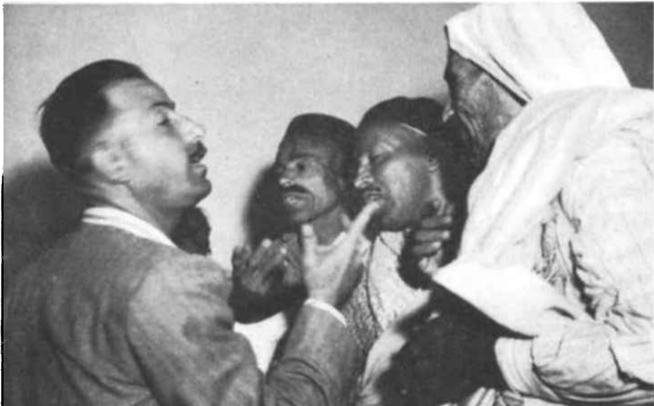
Electores de Tobruk durante los primeros comicios libres de Libia. Cerca del 80 por ciento de los habitantes de las poblaciones de Cirenaica y del 66 por ciento de los integrantes de sus tribus ejercieron su derecho al voto en esa ocasión.

La economía está paralizada por la falta de riquezas naturales y porque la agricultura y los recursos en agua no se han desarrollado lo suficiente. Los rebaños y el cultivo intermitente del centeno constituyen la base de la economía, y la mayor parte de la población rural vive precariamente de ello. Sin embargo, en la meseta septentrional y en algunas regiones de la franja costera, se cultiva el trigo con métodos modernos, y el olivo, la viña, la higuera, el albaricoque, el almendro y el algarrobo, así como el cultivo de pequeñas huertas, se dan perfectamente. En la actualidad se estimula bastante la valoración de esa región y se está procediendo a la instalación