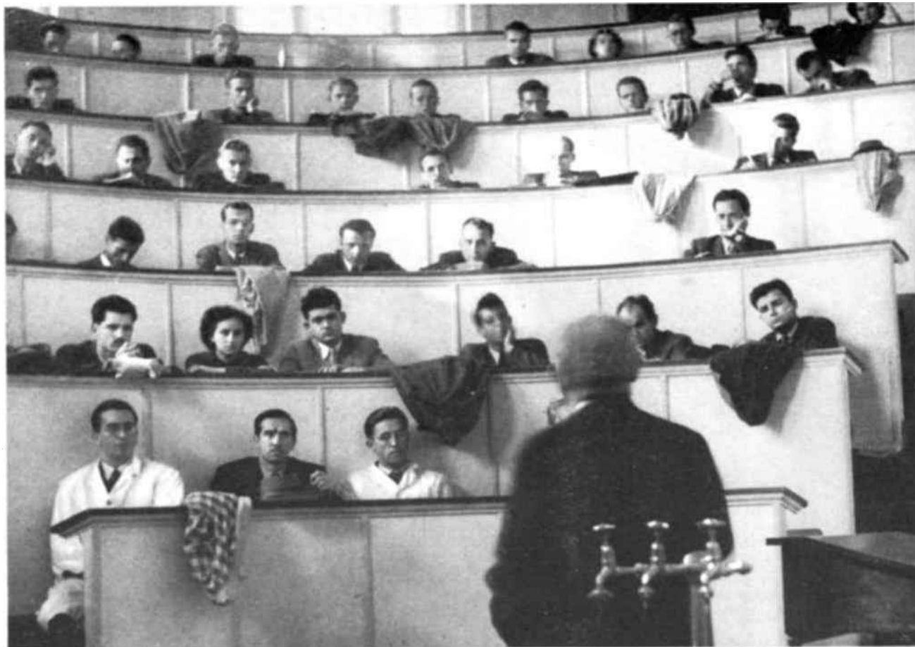
Esta foto ha sido tomada en la Universidad de Zagreb mientras dictaba clase el Profesor Andrija Stampar, conocido sociólogo (de espaldas).

Pero después de la caída de Napoleón, Eslovenia volvió a ser posesión del Imperio austro-húngaro y la enseñanza superior de la Universidad de Ljubljana se redujo de nuevo a lo que había sido antes de la administración francesa. Así siguió hasta 1848. En esa época, a pesar de que los eslovenos habían solicitado la apertura de una Uni-