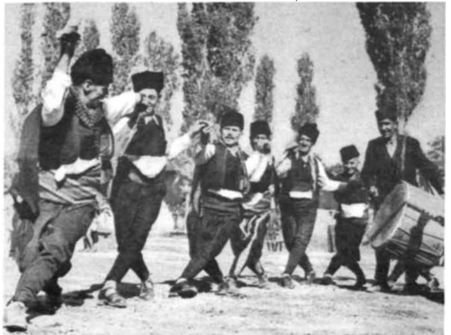
La « Tchifte Tchantche » es una danza popular de Bitolj.