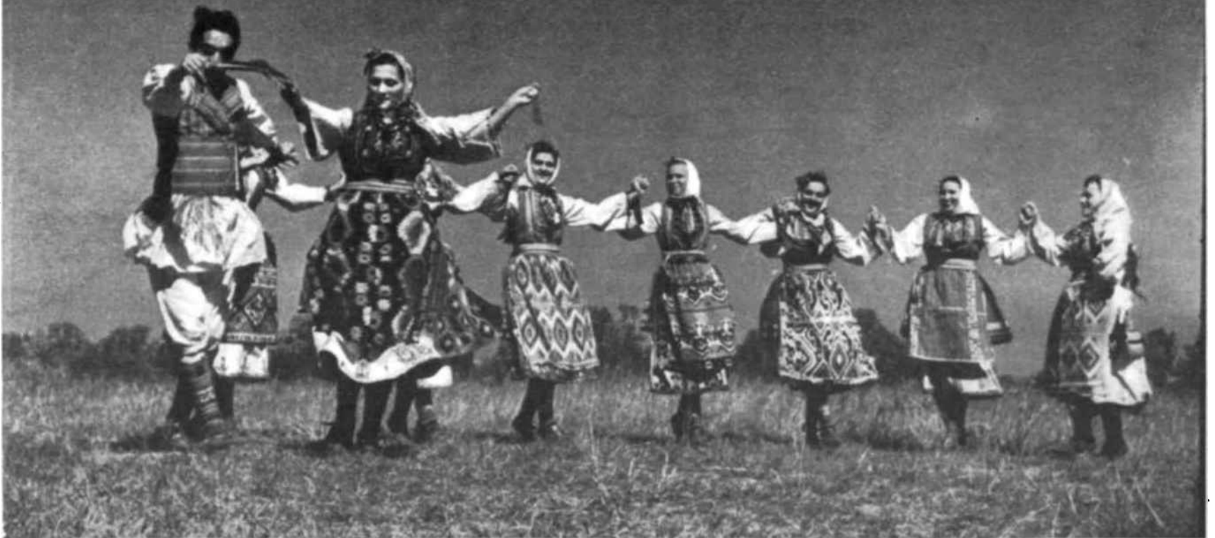
Un hombre se ha unido a este grupo de aldeanas de Macedonia para bailar la « Na Struga ducan », una de las danzas más populares de la región.