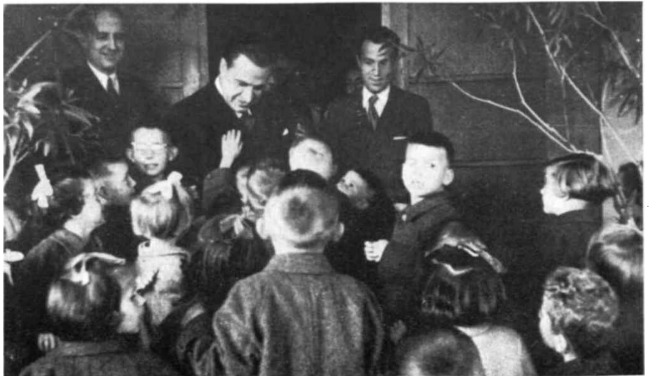
Un grupo de niños yugoslavos saluda al Director General de la Unesco, señor Torres Bodet, durante su visita a un asilo de Zagreb.

«Nuestro país se ha adherido a la Unesco inspirado por el sincero deseo de contribuir al desarrollo de la cooperación intelectual entre los pueblos y entre los Estados... En este país, que las masas trabajadoras han transformado en una enorme cantera para construir un porvenir mejor, se está firmemente convencido de que esa tarea podrá cumplirse, ante todo, luchando activamente por salvaguardar y mantener la paz. Luchar por la paz significa luchar por la verdad, significa luchar por la educación y por la ciencia, contra la psicosis de guerra y el odio entre los pueblos, y luchar además por la comprensión y el respeto mutuo, así como por una colaboración internacional que permita a los diferentes pueblos del mundo, grandes y pequeños, desarrollar libremente su propia cultura nacional.»