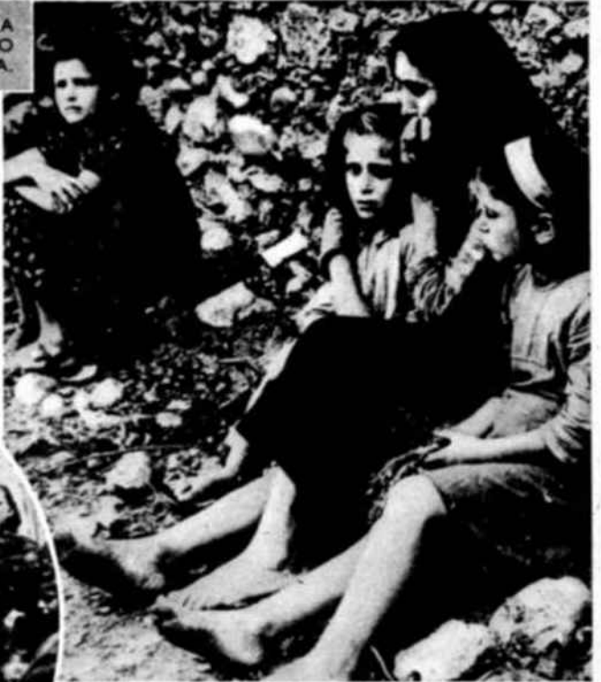
LA DÉCIMA PARTE DE LA POBLACION GRIEGA HA SIDO AVENTADA POR LA GUERRA.