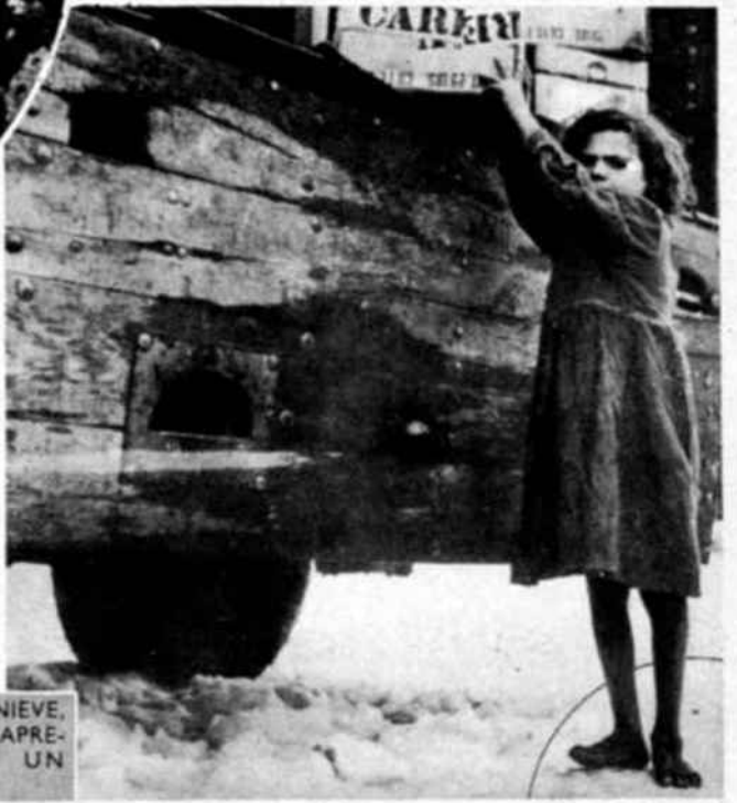
DESCALZA SOBRE LA NIEVE, UNA NIÑA GRIEGA SE APRESURA A RECOGER UN PAQUETE.