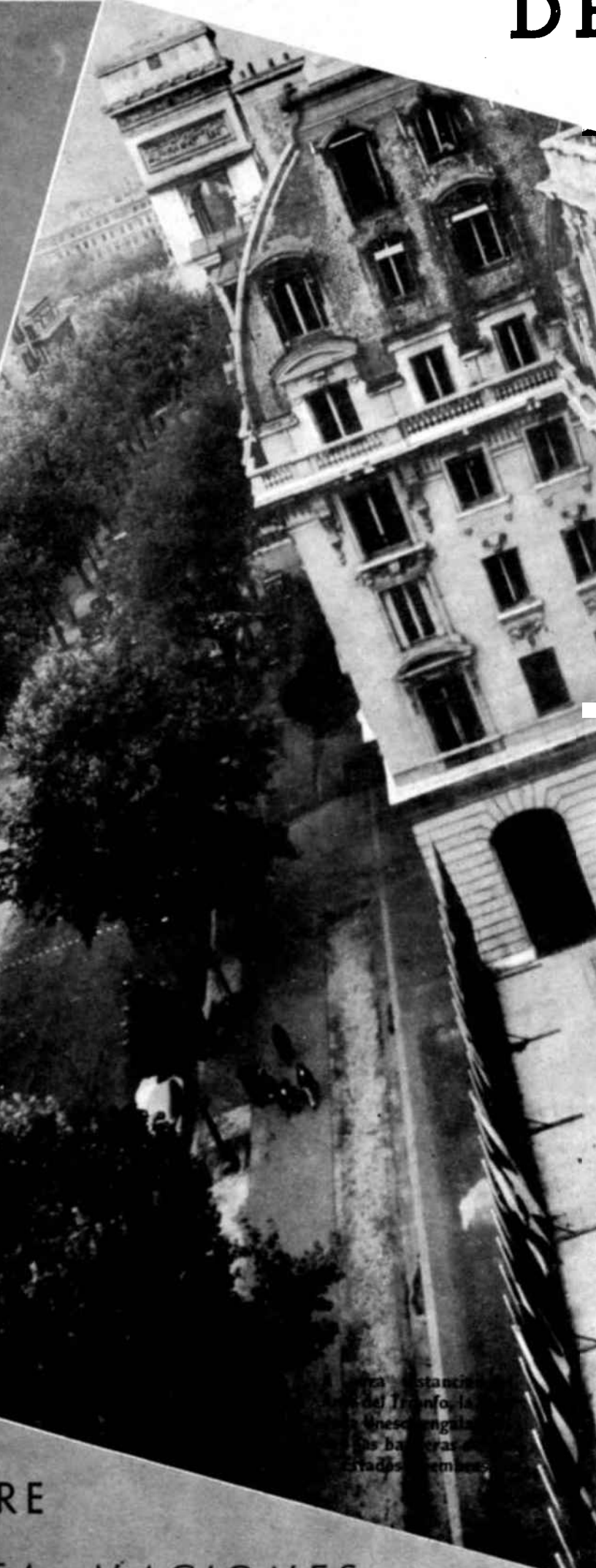
La Estación del Tranvía, la Unesco y las Naciones Unidas en París.

Solamente cuando todas estas prerrogativas se hallen plenamente garantizadas podrá el mundo esperar el nacimiento de la Libertad universal, basada en la tolerancia, la justicia y la buena voluntad para con nuestros semejantes.