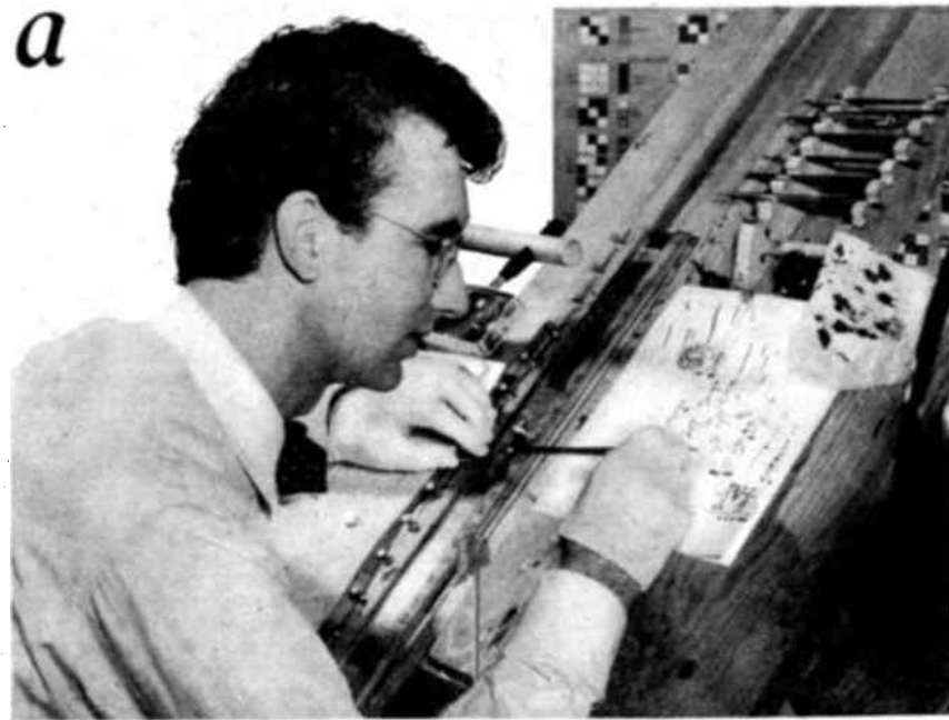
El Sr. Norman McLaren, del Consejo Nacional del Cine de Canadá, que acaba de llegar a China para incorporarse al equipo de la Unesco encargado del experimento audio-visual. El Sr. Norman trabaja en su método de dibujos animados logrados directamente sobre película.

Como una de las cosas de que más necesidad hay en China es la « educación para la higiene », se escogió como tema para la producción relacionada con el proyecto el de: « Una aldea sana », a fin de ilustrar ante los campesinos chinos, de un modo sencillo pero vivo, las reglas de la hien-