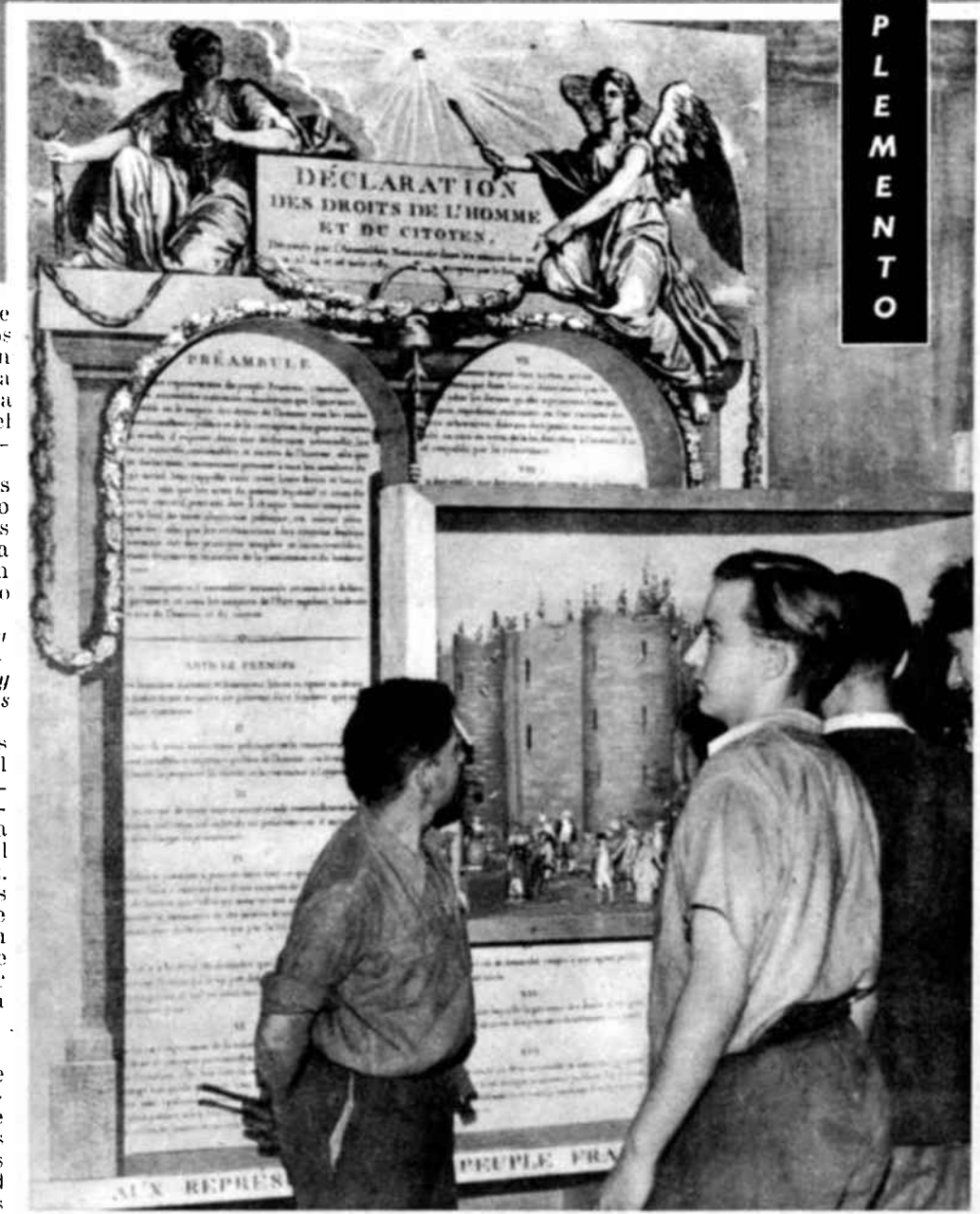
Uno de los momentos culminantes de la lucha del hombre por la conquista de sus derechos fué el de la Toma de la Bastilla en 1789. Los operarios franceses que aparecen en la fotografía examinan uno de los tableros montados para la exposición de la Unesco sobre los derechos del hombre, en el Museo Galliera de París, en el que se reproduce la Declaración francesa de los derechos del hombre y del ciudadano y un modelo pequeño de la destrucción de la Bastilla.

L a exposición sobre los Derechos del Hombre que se abre en París el 1 de Octubre constituye uno de los acontecimientos más importantes que se han desarrollado dentro del plan de la Unesco para dar publicidad a la vieja historia humana de la lucha por la libertad, como medio para formar el propósito en el hombre contemporáneo de respetar y defender los principios en que se funda.