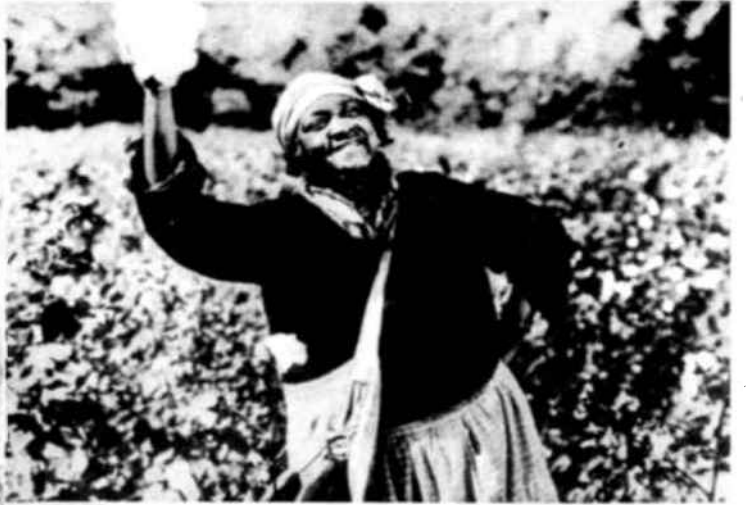
« Oh dulce nombre de Libertad! ». En el sur de los Estados Unidos una anciana agita un copo de algodón que durante muchos años ha sido el símbolo de la esclavitud de su raza. Al abolir la esclavitud el mundo debía aprender también cómo consolidar el triunfo de los derechos humanos: mediante el cumplimiento de un deber que es tanto nacional como internacional.