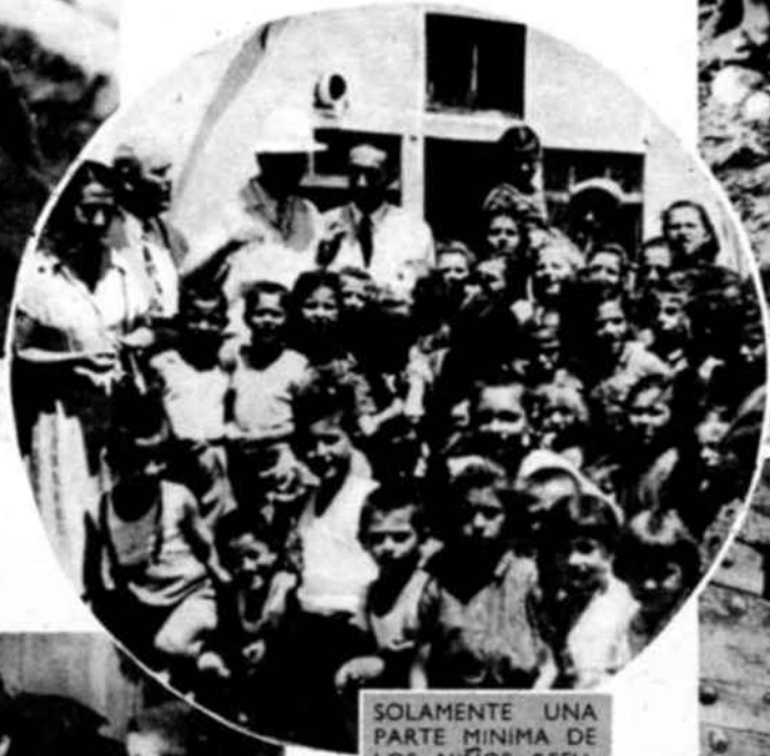
SOLAMENTE UNA PARTE MÍNIMA DE LOS NIÑOS REFUGIADOS GRIEGOS CUENTA CON LA PROTECCIÓN DE COLONIAS ESPECIALES, COMO LA QUE SE REPRODUCE EN LA FOTOGRAFÍA.