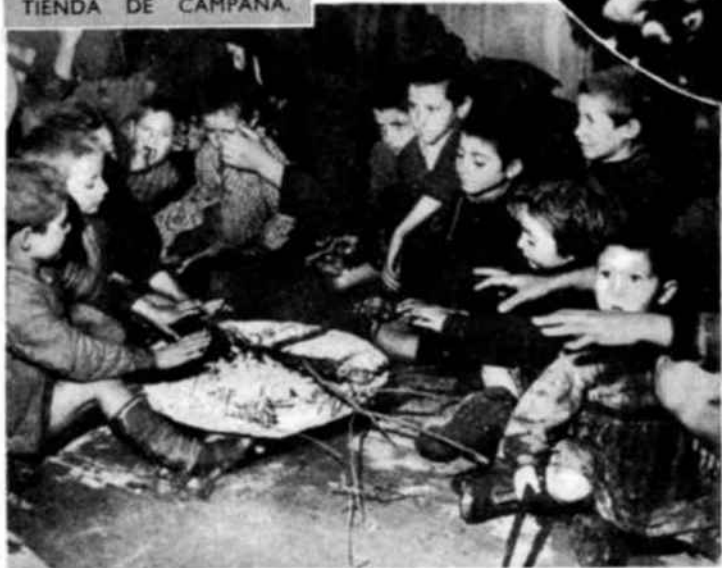
LA NOCHE FRÍA BAJO LA TIENDA DE CAMPAÑA.