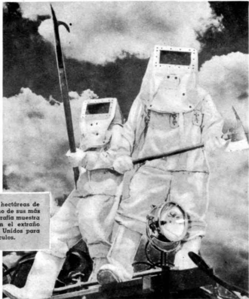
El fuego devora cada año millones de hectáreas de bosques, privando así al hombre de uno de sus más importantes recursos naturales. La fotografía muestra verdaderos « maricianos » envueltos en el extraño equipo que se emplea en los Estados Unidos para combatir los incendios mayúsculos.

La significación de estas dos conferencias, del punto de vista humano, fué ilustrada por el Sr. Antoine Goldet, Secretario General Adjunto de las Naciones Unidas para los Asuntos Económicos, cuando indicó su importancia para el programa de Asistencia técnica de las Naciones Unidas. « Temo fracasos y serias dificultades. — dijo — si no se examinan con la mayor atención los aspectos humanos de ese amplio programa... Tengo la seguridad de que los resultados de vuestra labor me serán de gran utilidad. »