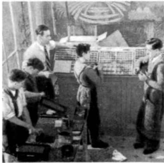
Dentro de su programa de auxilio y ayuda mutua, la Unesco ha otorgado particular interés a las Comunidades Infantiles que prestan albergue y facilitan la educación a los miles de niños víctimas morales de la guerra. En una de esas comunidades, la República Infantil de Moulins-Vieux, los niños preparan e imprimen su periódico, como puede aquí verse.

Desde la creación del Departamento de la Reconstrucción, cuyo Servicio de Auxilio y Ayuda Mutua fué creado ulteriormente, han sido publicados 17 folletos y hojas plegables para fomentar el interés en favor de la recuperación cultural de los países devastados e intensificar la ayuda material a los mismos. El « Boletín de la Reconstrucción », publicado desde enero de 1947 a julio de 1949, fué reemplazado por la revista « Impetus ». Además de la producción de una película sobre los niños abandonados, la Unesco ha realizado 22 grabaciones radiofónicas sobre problemas de reconstrucción cultural. Varias exposiciones ambulantes fueron preparadas por la Organización, recorriendo los Estados Unidos, Canadá, Holanda y Alemania a fin de interesar en las campañas de reconstrucción. No hace mucho que una exposición relativa a los Campos de trabajo voluntario se ha verificado en Bélgica.