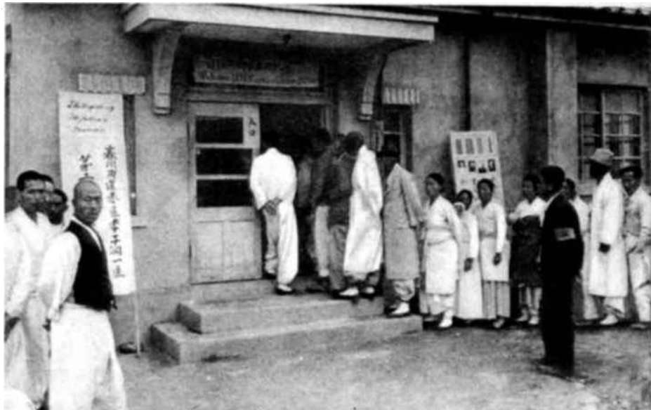
Las elecciones que se verificaron el 10 de mayo de 1948 en Corea del Sur, ante los observadores que integraban la Comisión provisional de las N.U. para Corea, fueron sumamente nutridas. Vemos aquí a un grupo de coreanos haciendo cola ante un colegio electoral.