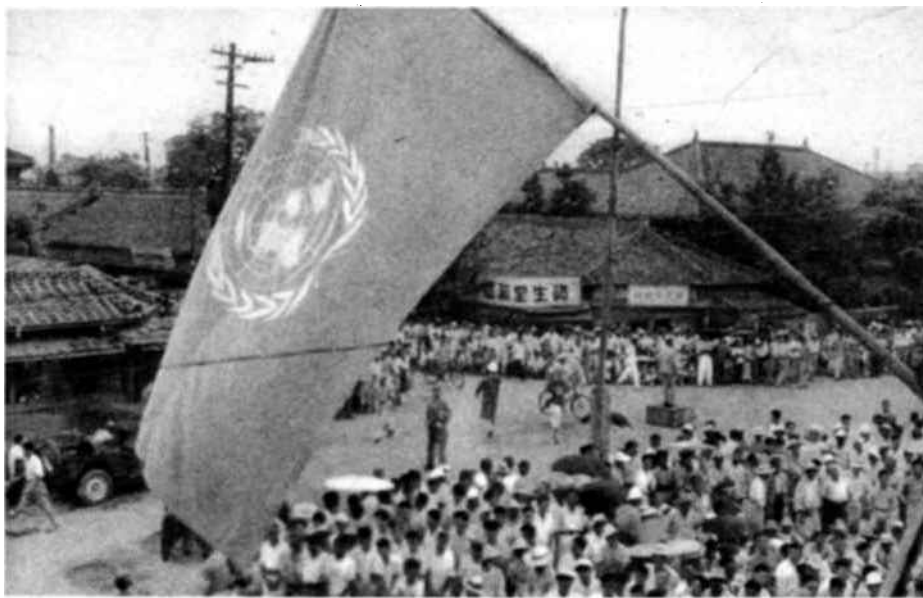
Una muchedumbre estimada en seis mil personas se congregó el 30 de junio último ante la Casa de la Cultura de Taejé, donde los miembros de la Comisión de las N.U. se habían reunido para celebrar su primera sesión pública desde el comienzo de las hostilidades. Los altavoces colocados en el exterior permitieron a ese público el escuchar las declaraciones de solidaridad internacional que hicieron los miembros de la Comisión en nombre de sus Gobiernos.

Ruega al Secretario General, al Con- sejo Económico y Social, que actúa conforme al artículo 65 de la Carta, a los otros órganos principales y subsi- diarios de las Naciones Unidas a qui- enes compete, a las Instituciones Espe- cializadas que proceden conforme a sus acuerdos respectivos con la Organiza- ción de las Naciones Unidas, a las Organizaciones no gubernamentales competentes, que aporten la ayuda que el Comando unificado pueda solicitar- les de acuerdo con las funciones que desempeña en nombre del Consejo de Seguridad, a fin de prestar auxilio y acudir en ayuda de la población civil de Corea.