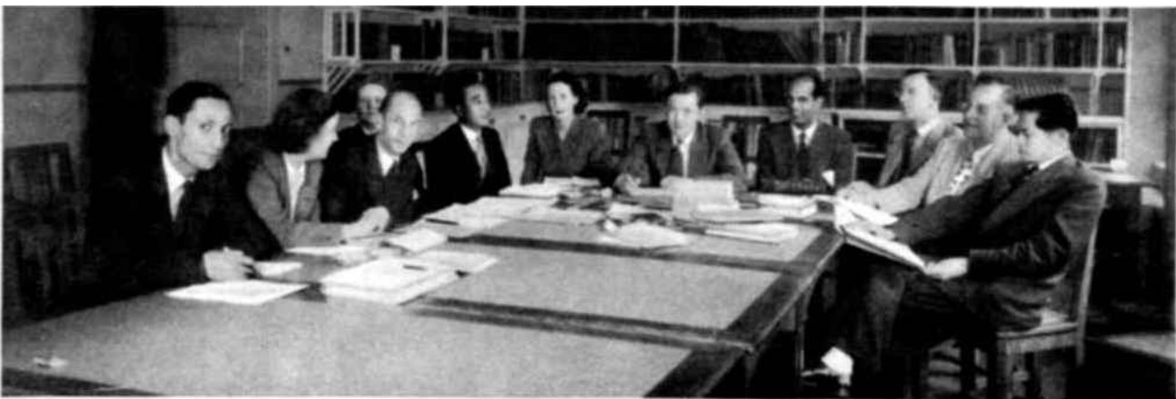
La característica más importante de los seminarios celebrados por la Unesco es el clima de comprensión y confianza en el que se desarrollan los intercambios de opiniones e información entre los participantes. Este grupo del Seminario de Bruselas se dedicó al estudio de los problemas técnicos que plantea la mejora de los libros de texto.

Además, un grupo de universitarios y funcionarios canadienses ha contribuido con todo entusiasmo a la organización del Seminario; cada participante integraba a un tiempo dos grupos distintos: el primero dedicado al estudio de la geografía, en función del desarrollo mental de los niños en las diferentes naciones, cuenta tenida de las respectivas edades; el segundo consagrado a los principales aspectos de la enseñanza geográfica —formación e información de maestros y auxiliares, programas y métodos de estudios, enseñanza de la geografía y la comprensión internacional, geografía de las Naciones Unidas, etc.