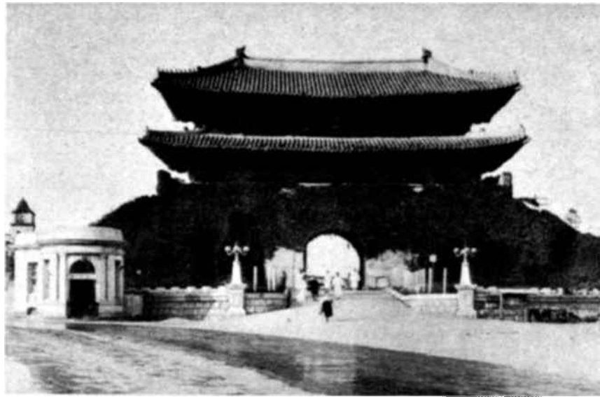
LA PUERTA DEL SUR EN SEUL. El primer Rey de la dinastía Yi reclutó a doscientos mil obreros para construir una gran muralla en torno a Seúl, su nueva capital. Dicha muralla tenía doce kilómetros de larga, seis metros de ancha y de tres a seis metros de alta; poseía cuatro puertas grandes y cuatro pequeñas. Aun pueden verse hoy los restos de la misma dentro de la ciudad, que rebasó ya el millón de habitantes.

Y a propósito de pueblo, ¡qué murallas en torno suyo! Mas los geógrafos y los historiadores no acostumbran, a menos que sean poetas, reparar en esas menudencias. Claro está que nos han descrito las cabañas del campesino coreano, y las ceremonias nupciales y algunos bailes religiosos y las tradiciones culinarias. El viajero, por lo general, no tiene en cuenta la pintura que haría de sí mismo si tuviera que limitarse a describir su manera de dormir, de comer o de casarse. Otros curiosos, no obstante, nos han transmitido algunos proverbios: en ellos reside la sabiduría de las naciones. He aquí el folklore: los apólogos y los cuentos de hadas. La Cenicienta se llama Konhji; Caperucita Roja será devorada por el tigre. Este parece tan importante en Corea como en China; y los genios desempeñan un papel semejante a los