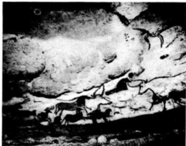
Las 500 figuras de animales que ornaban la caverna de Lascaux y de las cuales varias están pintadas en tres colores, han merecido que se llame a este lugar « La Capilla Sixtina del Perigurdino ». Algunos de los frescos que pueden verse conservan una extraordinaria frescura de color, como si acabaran de ser pintados. Ello se debe a una especie de capa calcárea depositada sobre las paredes en el curso de los siglos, la calcita.

Allí, al abrigo de los hombres y del tiempo, se halla lo que puede hoy considerarse como una de las más antiguas manifestaciones artísticas de la humanidad. Grabados y pinturas