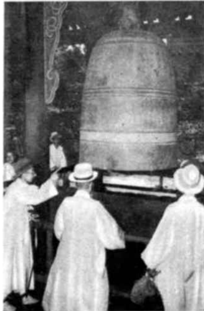
EL TRAJE TRADICIONAL DEL PAIS, que aquí vemos llevado por las coreanas que examinan una antigua campana, fué copiado de la dinastía china Ming.

Antes, mucho antes había habido, a fines del siglo XIV, ese reino de Tyo-Syen, la célebre Tierra de la Mañana Serena, donde en Sye-Sul, la « capital por excelencia », gobernaba un soberano al estilo chino. Pero, los raros viajeros que intentaban de vez en cuando revelar al resto del mundo los tesoros escondidos de ese reino, sabían muy bien la extraordinaria personalidad de su pueblo. Le atribuían un origen mogol, subrayando la originalidad de su lengua y la hermosa simplicidad de su alfabeto de 25 letras. Partiendo de ahí enumeraban una lista impresionante de descubrimientos e invenciones. El « Reino Ermitaño », como lo llamaban, parecía haber engendrado en la soledad todo lo que las demás naciones habían producido juntas: la rueca, la cerámica, los caracteres de imprenta, el papel moneda, el barómetro y hasta los navíos acorazados que en 1592 hicieron frente a los invasores