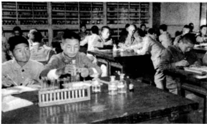
¿Cuántos locales de escuelas conservarán sus muros al final de la contienda? Desde 1945 se desarrolló un esfuerzo considerable por parte de las autoridades coreanas a fin de incrementar y mejorar los servicios educativos. La guerra ha destruido ya la mayor parte de la labor realizada.