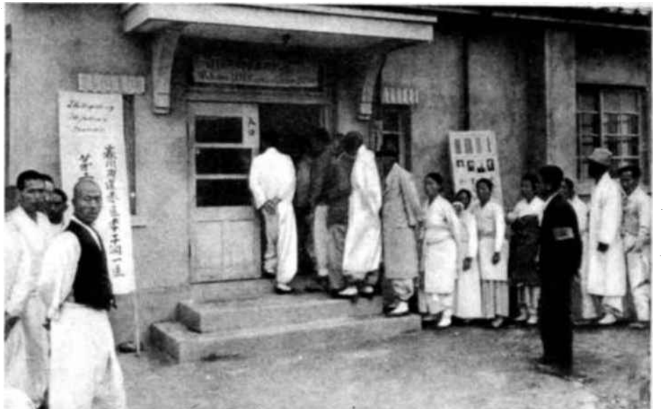
Las elecciones que se verificaron el 10 de mayo de 1948 en Corea del Sur, ante los observadores que integraban la Comisión provisional de las N.U. para Corea, fueron sumamente nutridas. Vemos aquí a un grupo de coreanos haciendo cola ante un colegio electoral.