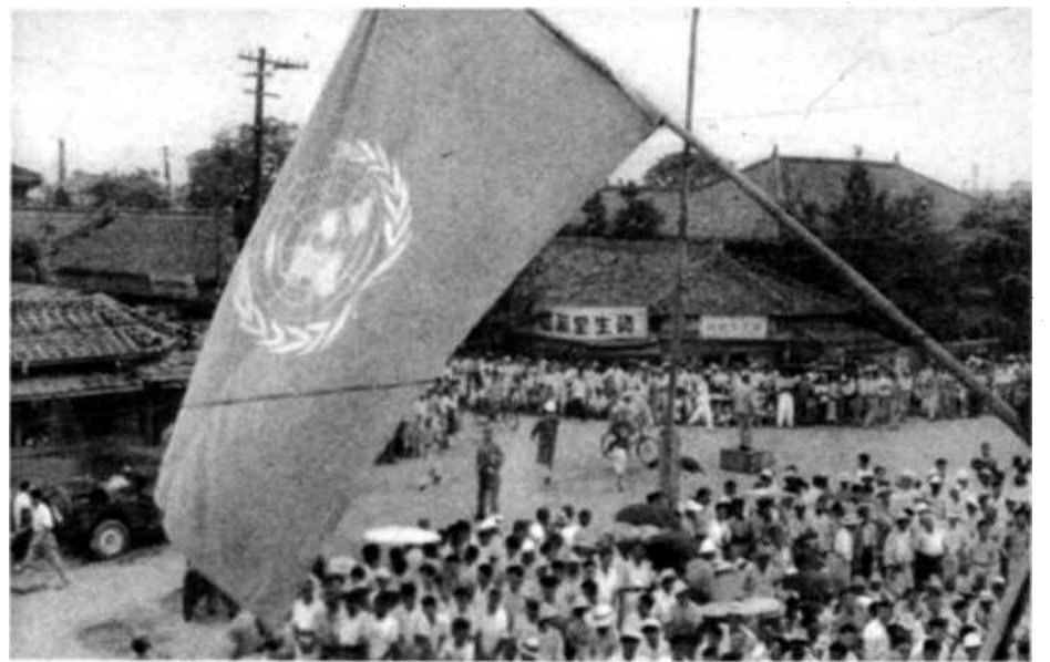
Una muchedumbre estimada en seis mil personas se congregó el 30 de junio último ante la Casa de la Cultura de Taejé, donde los miembros de la Comisión de las N.U. se habían reunido para celebrar su primera sesión pública desde el comienzo de las hostilidades. Los altavoces colocados en el exterior permitieron a ese público el escuchar las declaraciones de solidaridad internacional que hicieron los miembros de la Comisión en nombre de sus Gobiernos.

Ruega al Secretario General, al Con- sejo Económico y Social, que actúa conforme al artículo 65 de la Carta, a los otros órganos principales y subsi- diarios de las Naciones Unidas a qui- enes compete, a las Instituciones Espe- cializadas que proceden conforme a sus acuerdos respectivos con la Organiza- ción de las Naciones Unidas, a las Organizaciones no gubernamentales competentes, que aporten la ayuda que el Comando unificado pueda solicitar- les de acuerdo con las funciones que desempeña en nombre del Consejo de Seguridad, a fin de prestar auxilio y acudir en ayuda de la población civil de Corea.