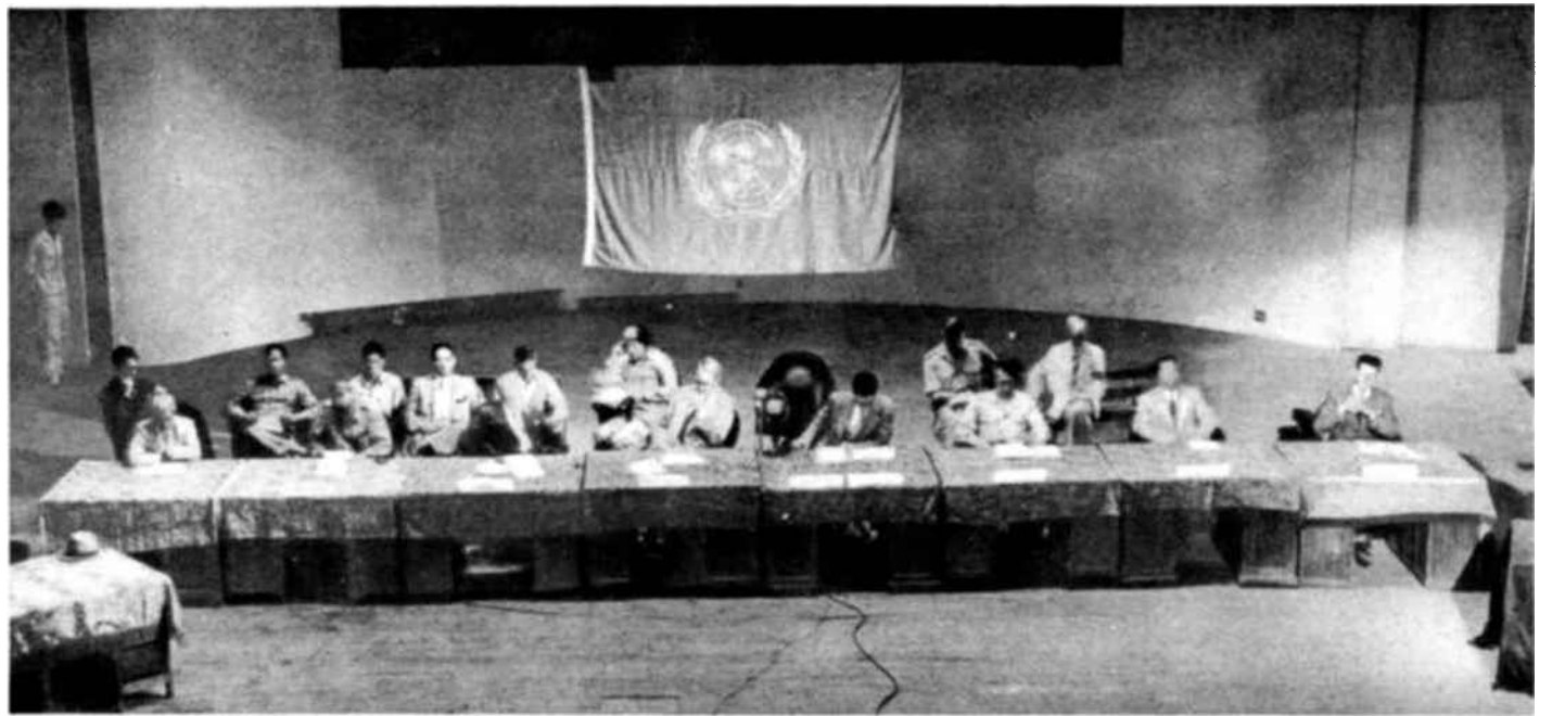
El 30 de julio, la Comisión de las Naciones Unidas para la Corea celebró en Taejé, capital provisional de la Corea del Sur una sesión pública, a la que asistió numeroso público. Todos los miembros de la Comisión subrayaron la determinación de su país de proseguir hasta el final la resistencia opuesta por las N.U. a las fuerzas agresoras en Corea.

3. El convenio o convenios serán nego- ciados a iniciativa del Consejo de Segu- ridad tan pronto como sea posible; serán concertados entre el Consejo de Seguridad y Miembros individuales o entre el Consejo de Seguridad y grupos de Miembros, y estarán sujetos a ratificación por los Esta- dos signatarios de acuerdo con sus respec- tivos procedimientos constitucionales.