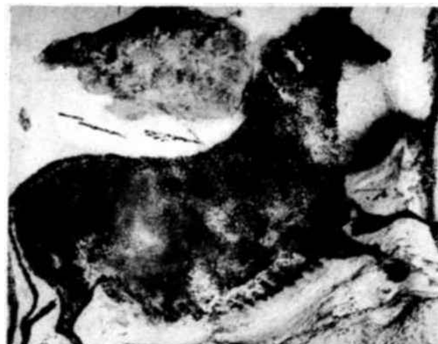
Como otros animales hembras representados en las paredes de la gruta, esta yegua aparece grávida. Esos signos de fecundidad corresponden, sin duda, a ritos y votos del hombre primitivo. Numerosos símbolos enmarcan las figuras de animales : dardos, ojos y cuadrados de diversos colores dispuestos en jaqueles, como si fueran blasones heráldicos. Dichos signos indican que la espelunca de Lascaux debió ser un lugar dedicado a las fuerzas tutelares.