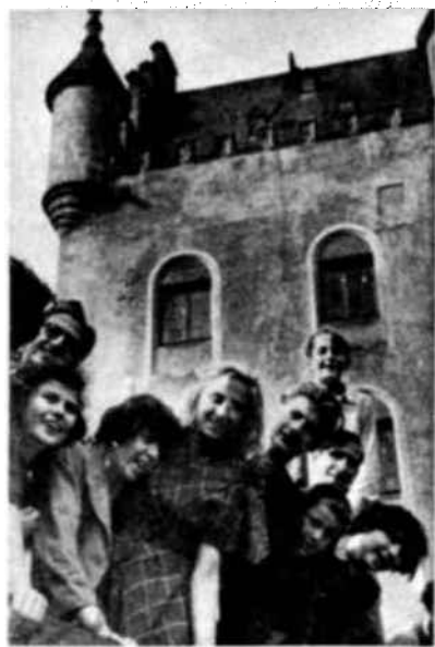
Vemos aquí, ante el Castillo de Schoenfels (Luxemburgo) a los muchachos víctimas de la guerra que fueron acogidos este verano en el campo organizado en Esch-sur-Alzette por la Federación de Comunidades Infantiles.

D URANTE un mes de este verano, una de las más bellas mansiones del Luxemburgo, el Castillo de Sanem, en Esch-sur-Alzette, se ha transformado en una pequeña Europa. Cuarenta mu-