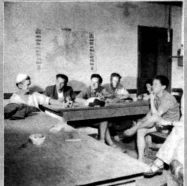
De regreso al Campo, tras una larga jornada de trabajo, los jóvenes voluntarios de Saugnac charlan de sus países, profesiones y esperanzas. Una obra filantrópica, la recuperación de las Landas, ha unido sus vidas este verano; pero muchos de ellos proseguirán la amistad aquí entablada.