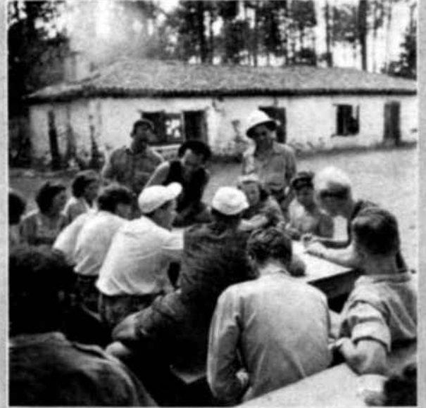
Ante la Maison des Filles los muchachos disponen su plan de trabajo. Aunque su jornada comienza a las seis de la mañana, consagran sus veladas a celebrar debates y estudios en común sobre los más diversos temas.