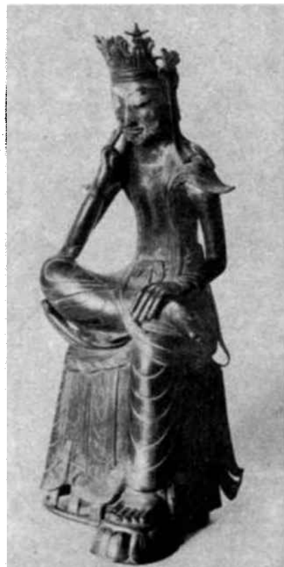
ESTATUILLA coreana que representa a un discípulo de Buda.

sistema de referencias habremos de atenarnos? Más allá del hambre y del miedo, ¿qué imágenes pueblan sus sueños? ¿Qué forma cobran sus pensamientos? Porque son sus pensamientos los que empiezan a prever el futuro y a querer crearlo, y no podrán hacerlo extrayéndolo de la nada: habrán de