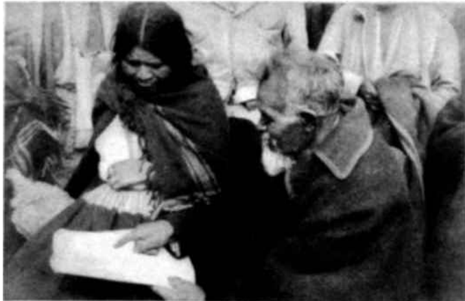
En el caserío de Chibuleo, Provincia de Tungurahua, un voluntario de las oficinas regionales de la UNP inicia a un maestro indígena en el uso de la cartilla Laubach.

nal. Como puede verse, esas « recompensas » son principalmente de carácter honorífico, pero, gracias al espíritu de sacrificio de los maestros voluntarios, de diversas procedencias (colegiales, estudiantes universitarios, sacerdotes, granjeros, directores de empresas, empleados del Gobierno y simples particulares), pudo la UNP crear, entre 1944 y 1949, 1.095 « núcleos escolares », cifra bastante importante si se tiene en cuenta que la falta de medios de comunicación casi aísla ciertas regiones ecuatorianas. Cada « núcleo » cuenta por término medio con nueve o diez alumnos, aunque, en ocasiones, no alcanzan sino a cinco o seis. Los cursos se realizan en las escuelas, las granjas, las fábricas y, frecuentemente, al aire libre. Se han organizado también centros especiales de enseñanza para los reclutas analfabetos. Aprovechando las latas viejas de conservas, los servicios de la UNP confeccionan lámparas de kerosén con los colores nacionales, para alumbrar las veladas estudiantiles de muchos alumnos pobres.