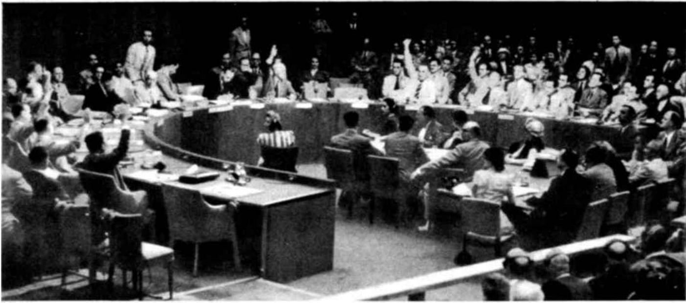
Esta foto del Consejo de Seguridad fué tomada durante la sesión de 27 de julio último, en el curso de la cual se decidió la intervención en Corea de las fuerzas de las Naciones Unidas, siendo aprobada dicha decisión por los representantes de siete países: China, Cuba, Ecuador, Francia, Gran Bretaña, Noruega y los Estados Unidos. Yugoslavia se pronunció en contra y los delegados de Egipto y de la India se abstuvieron de votar, alegando carecer de instrucciones de sus Gobiernos respectivos. La U. R. S. S. no estuvo presente.