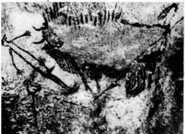
No se ha encontrado en Lascaux sino una sola evocación de la figura humana. El grupo de que forma parte ha sido dibujado en el fondo de un pozo de doce metros. Entre un rinoceronte y un bisón herido ha sido trazada una silueta muy esquemática. El hombre yace junto a una azagaya y una honda. « Parece — dice el abate Breuil — que se tratara de un drama prehistórico.