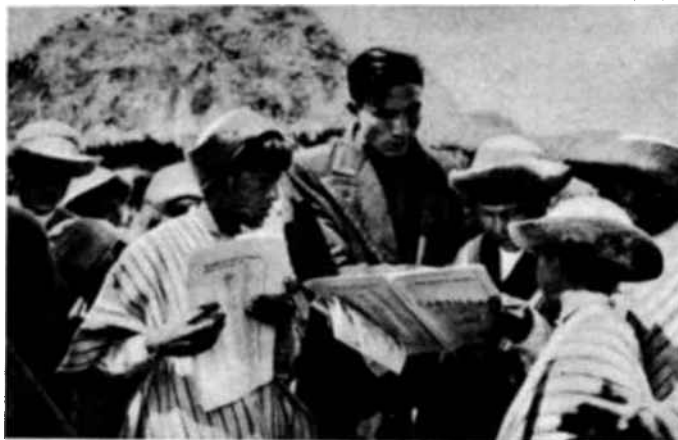
El jefe indígena del Caserío Pingulmi, Provincia de Pichincha, enseña a leer a un analfabeto del lugar.

El reclutamiento de maestros planteaba un problema difícil, dada la inmensidad de la labor por llevar a cabo y los fondos, sumamente reducidos, de que disponía la UNP. Resultaba imposible el remunerar regularmente a los maestros y se decidió, en consecuencia, el acordar ciertas primas a quienes hubieran « alfabetizado » mayor número de personas: 100 sucres por cada ocho alumnos. Igualmente, se entrega un « Diploma de patriotismo », firmado por el Ministro de Educación Nacio-