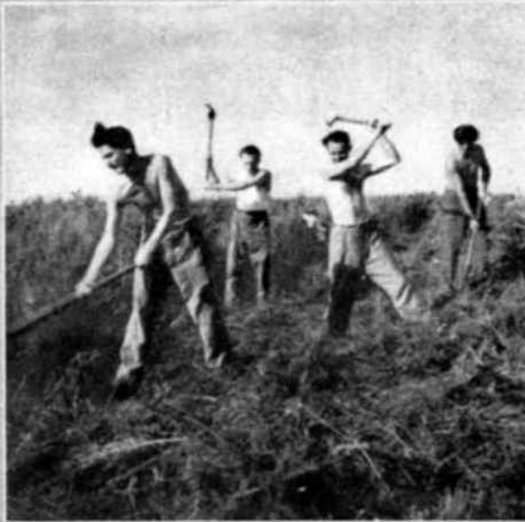
Estos voluntarios yugoslavos abren ranjas protectoras a fin de proteger los nuevos cultivos. El Ministerio de Agricultura ha decidido dedicar varios centenares de hectáreas al cultivo y pastoreo a fin de aislar los bosques.

Uno de los hechos más simpáticos de estos campos ha sido la amistad que pronto ligó a los jóvenes trabajadores con los propios habitantes de la región, quienes se vieron así transportados a un ambiente internacional que quizás haya servido a consolarlos de su infortunio.