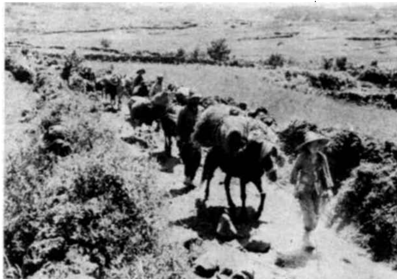
La trágica suerte de centenares de refugiados en el Sur de Corea requiere el auxilio inmediato de los servicios de ayuda. Los informes recibidos hasta finales de agosto indican que la población refugiada en ese sector es superior a millón y medio de personas, la mayor parte de las cuales carece de los medios más elementales.

La ayuda de la Unesco deberá, en consecuencia, consistir, sobre todo, en socorros de urgencia, que permitan, por