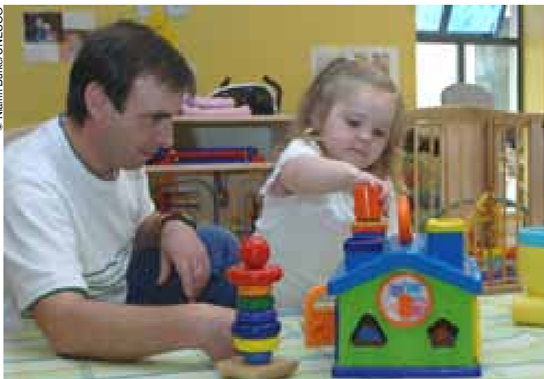
La idea es que, a fin de cuentas, los padres se sientan expertos de su propio hijo.