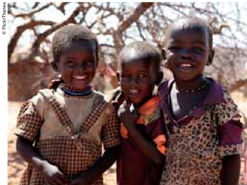
Grupo de niños samburu.

En la lengua de los samburu, pueblo dedicado al pastoreo tradicional en el norte de Kenya, loipi quiere decir “sombra”. En estas tierras cálidas y áridas, los espacios sombreados por los árboles desempeñan un importante papel en la vida comunitaria. Los hombres se reúnen para tomar decisiones al pie del “árbol del consejo”. Las abuelas, encargadas de los niños más pequeños desde tiempos inmemoriales, los cuidan y dan de comer también a la sombra de los árboles más grandes, les enseñan canciones y les relatan cuentos.