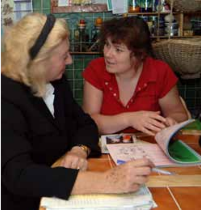
Una madre que participa en el "Community Mothers" programa con su enfermera referente.

era línea da mucha confianza a las jóvenes madres. "Son encuentros muy informales. Uno se siente de veras cómodo para hablar", explica Antoinette, mamá de Tadhg, de cuatro meses.