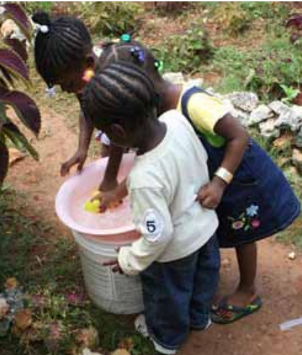
El programa jamaicano de educadores itinerantes brinda también nociones de higiene a los más pequeños.