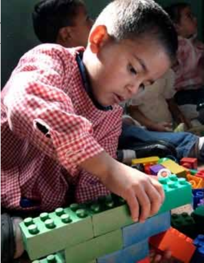
Los Mahecha adaptaron su casa a las actividades de los niños que acuden al hogar.

con un letrero pintado con lápices en papel: "Mis Amiguitos".