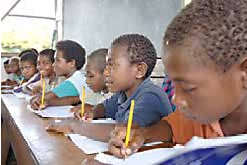
Escuela elemental de Sampubangin, Markham Valley.

a atención y educación de la primera infancia debería ser objeto a priori de una gran solicitud. En primer lugar, es el primero de los objetivos de la Educación para Todos fijados por la comunidad mundial el año 2000, en el Foro Mundial sobre la Educación de Dakar. Además, la Convención sobre los Derechos del Niño, ratificada por nada menos que 192 países, la reconoce como un derecho. Por último, es bien sabido que los primeros años de la vida de un niño son decisivos para su futuro y, en particular, para su éxito en la escuela. Muchos estudios lo demuestran.