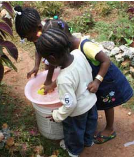
El programa jamaicano de educadores itinerantes brinda también nociones de higiene a los más pequeños.