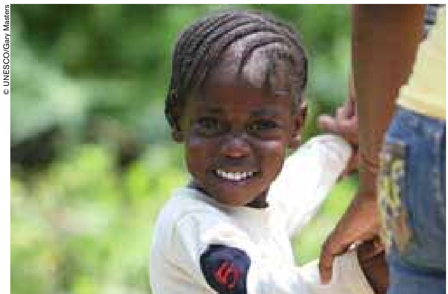
El Programa de Cuidadores Errantes de Jamaica (RCP) una iniciativa de desarrollo de la infancia centrada en las comunidades rurales.