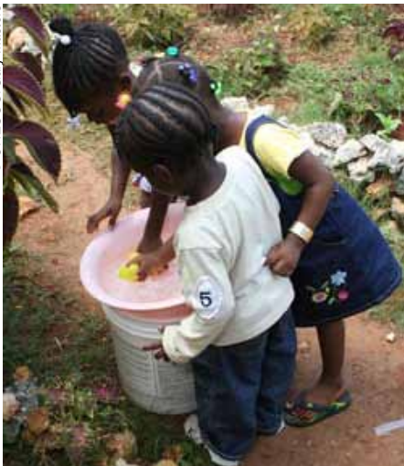
El programa jamaicano de educadores itinerantes brinda también nociones de higiene a los más pequeños.

Jamaica es uno de los países con mayor tradición de educación de la primera infancia. 95% de los niños de cuatro y cinco años acuden a algún tipo de estructura educativa, al igual que 60% de los de tres años.