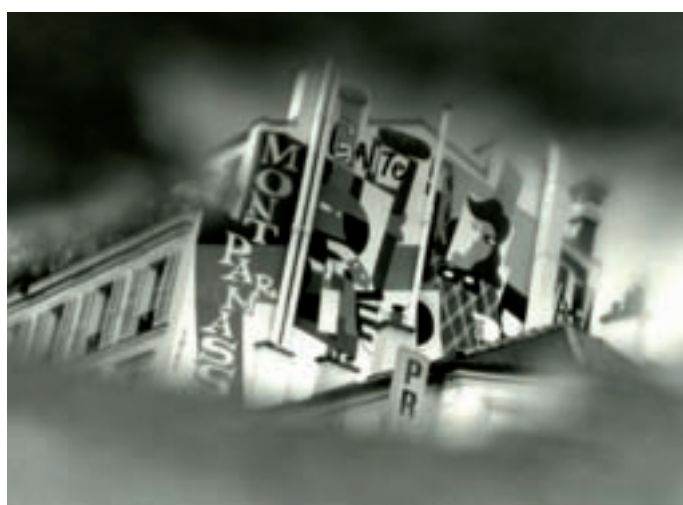
En el marco del Festival de la Diversidad Cultural, organizado por la UNESCO en mayo 2009, Shigeru Asano expuso sus obras en la Alcaldía del primer distrito de París. (© Shigeru Asano)