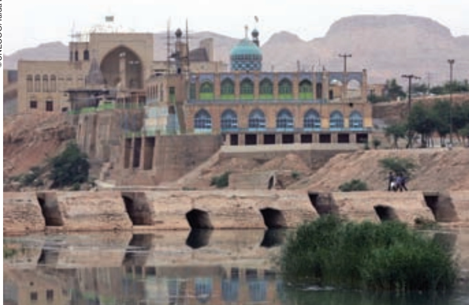
La presa de Band-e Miza en Khuzistán (Irán) forma parte del sistema hidráulico histórico de Shusta, inscrito en la Lista del Patrimonio Mundial.

La Convención de 1972 sobre la Protección del Patrimonio Mundial Cultural y Natural constituye sin duda alguna el instrumento internacional más ampliamente reconocido y el más eficaz en materia de preservación. Uno de sus principales objetivos es "identificar, proteger, conservar, revalorizar y transmitir a las generaciones futuras el patrimonio cultural y natural". Es decir que, cuando un sitio ingresa en la Lista, el proceso no termina allí sino que acaba de comenzar.