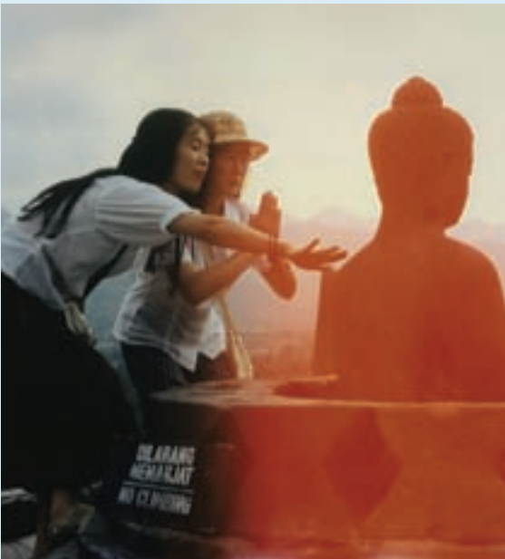
Turistas en Borobudur, sitio del Patrimonio Mundial de la UNESCO (Indonesia).