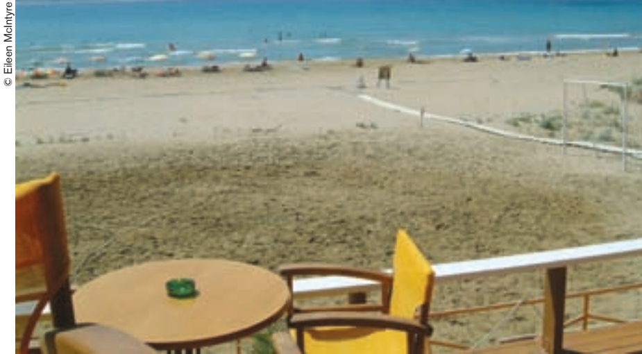
¿El turismo perjudicará a la "anciana aristócrata" que es Corfú?

Los corfíotas están muy orgullosos de su isla y, reconozcámoslo, tienen cierto sentimiento de superioridad respecto de los griegos de otras regiones. Me dirán ustedes que los cretenses también, o los habitantes de las Cícladas. Pero sus motivos son distintos. Son motivos relacio-