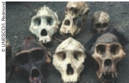
Cráneos de gorilas de estanques, víctimas de la guerra y del comercio de carne (RDC).

Más difícil es hacer frente al peligro que representan las catástrofes naturales —fenómenos meteorológicos extremos, incendios o inundaciones—, a menudo vinculadas al cambio climático. En colaboración con otras organizaciones y comités internacionales, el Comité ha elaborado directrices y un plan de acción para la gestión de los efectos del cambio climático sobre los bienes del Patrimonio Mundial [ver Estudios de caso so-