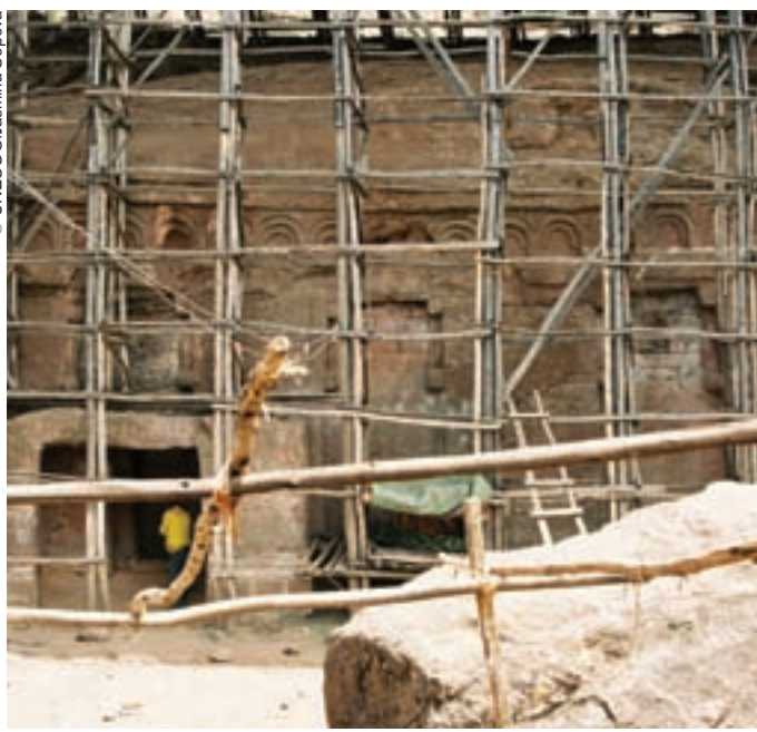
Andamio tradicional en la pequeña iglesia de la aldea de Kirkos, a 30 km de Lalibela, no inscrita en la Lista del Patrimonio Mundial.