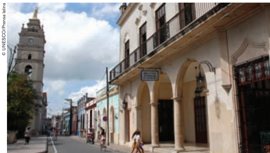
Las columnas y balaustres de hierro forjado son el encanto de Camagüey.