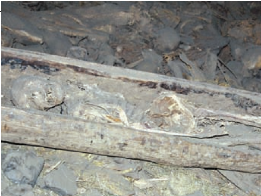
Un inmenso osario yace en la cavidad profunda de la roca.