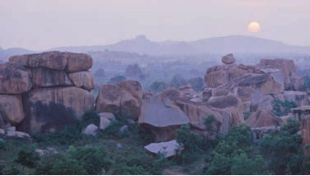
Hampi (India). Vista del conjunto.

Puede suceder también que los sitios protegidos terminen siendo víctimas de su propio éxito. Algunas agencias de viajes no dudan en usar la etiqueta de "Patrimonio Mundial" como reclamo publicitario. El sitio de Angkor, en Camboya, recibe actualmente 5.000 visitas diarias. En las Islas Galápagos, se ha pasado de 40.000 visitantes en 1991 a 120.000 en 2006. Esta clase de turismo no sólo pone en peligro los recursos del sitio sino también la seguridad del público, además de degradar la calidad de las visitas. Por ese motivo, el Comité está empeñado actualmente en la elaboración de principios que favorezcan un turismo responsable, destinados tanto a los organizadores, como a los conservadores, los operadores turísticos, los autores de guías y los turistas.