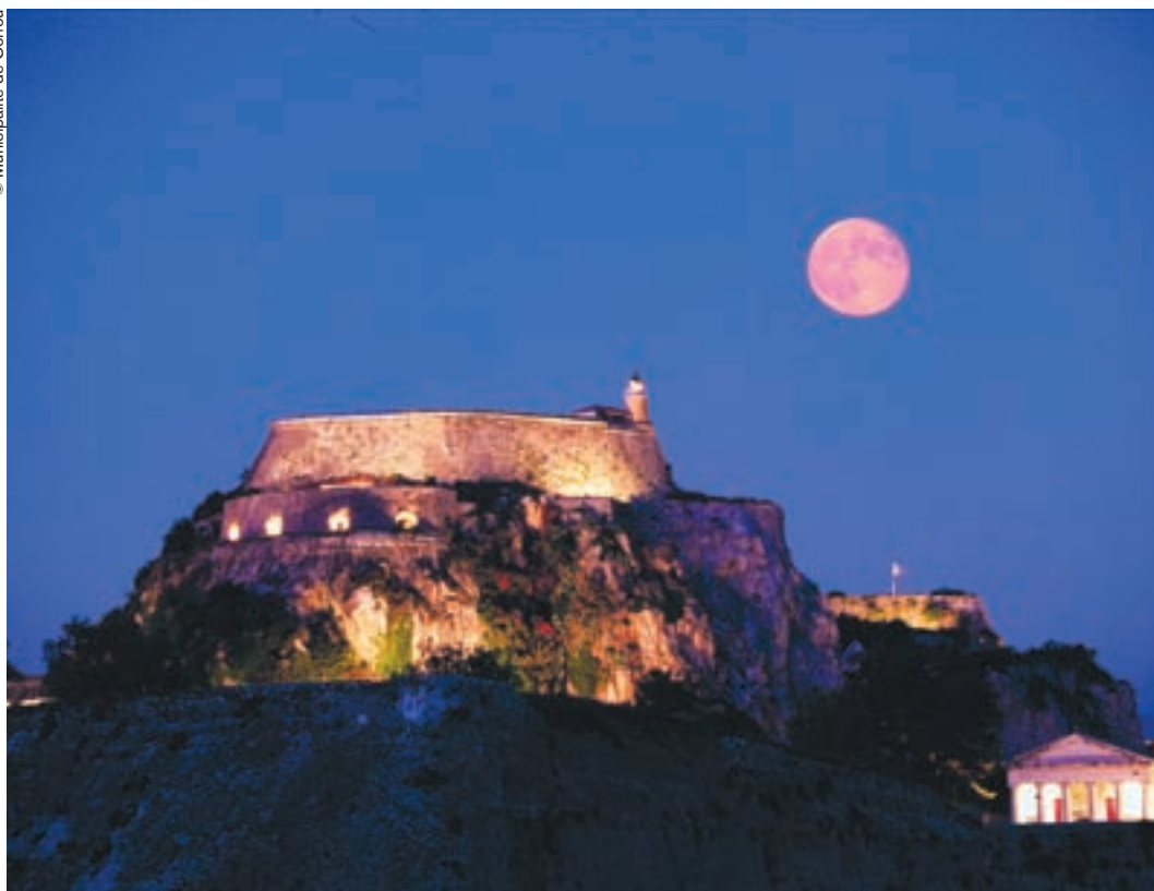
Noche en la ciudad de Corfú (Grecia).