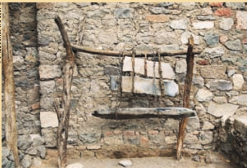
Campana de la iglesia de Neakutdeab, cerca de Lalibela.