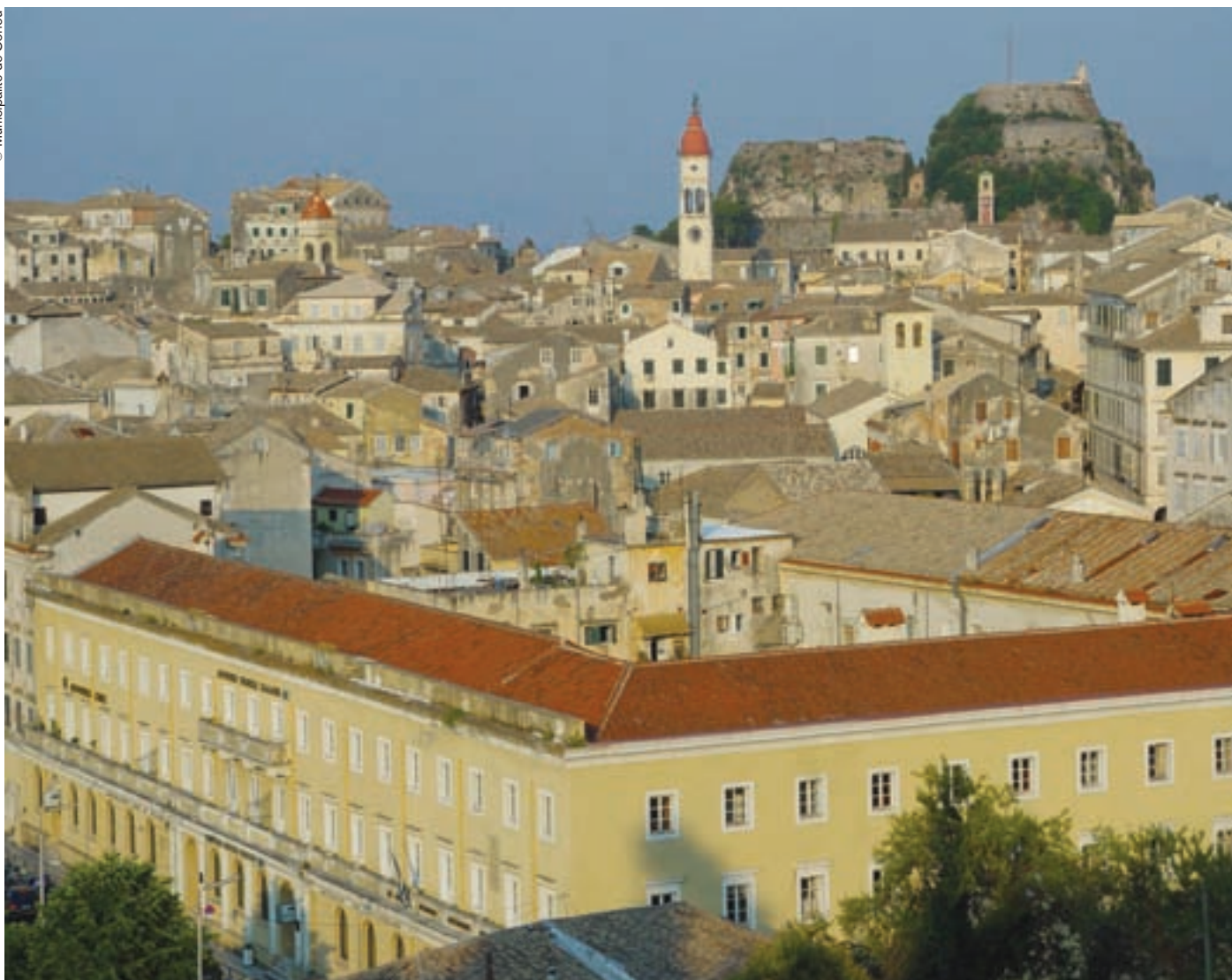
Panorámica desde la vieja muralla.