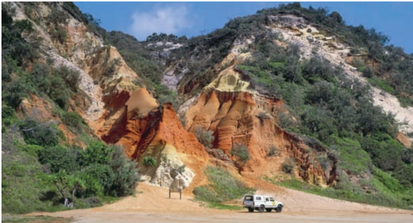
Para visitar la Isla Fraser es imprescindible tomar un barco o alquilar un vehículo con tracción a cuatro ruedas.

de biosfera la tarea primordial es la gestión de las transformaciones de los ecosistemas ocasionadas por las actividades humanas, con vistas a la consecución de un desarrollo sostenible”.