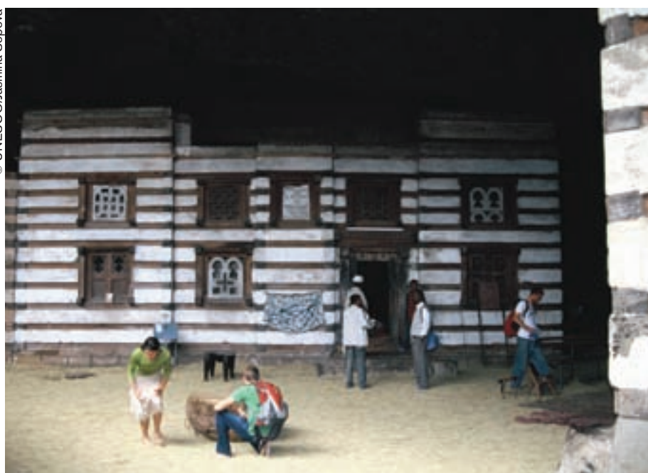
Algunos turistas que se aventuraron hasta la iglesia de Imrahana Kirstos.

Tras mostrarme la cruz que Dios mismo forjó para Imrahana Kirstos, así como un hermoso tríptico pintado por el rey en persona, el sacerdote me permite descubrir el