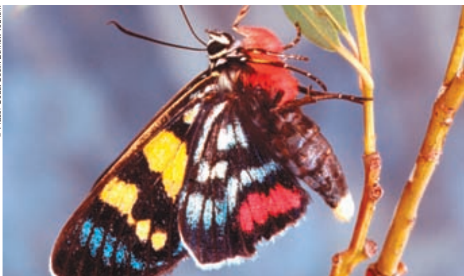
Fraser alberga especímenes raros de la fauna y flora australianas.

Aunque la región de Great Sandy tiene menos de 200.000 habitantes, acoge cada año a 950.000 visitantes. Al Presidente del BMRG le preocupan menos las repercusiones del aumento del turismo que las consecuencias del asentamiento de un número cada vez mayor de personas en la región.