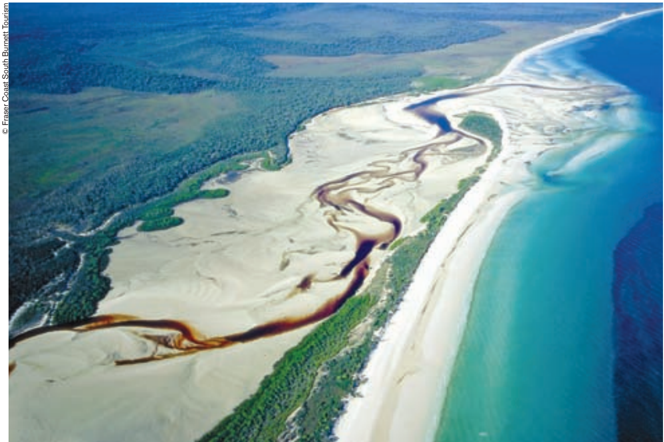
Situada frente al litoral este de Australia, Fraser es la isla arenosa más grande del mundo.

Situada frente al litoral este de Australia, Fraser es la isla arenosa más grande del mundo. Alberga un ecosistema complejo de bosques pluviales, bellísimos lagos de agua dulce en sus alturas y especímenes raros de la fauna y flora australianas.