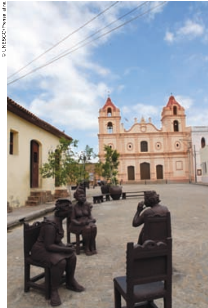
Una de las plazas emblemáticas de Camagüey (Cuba).