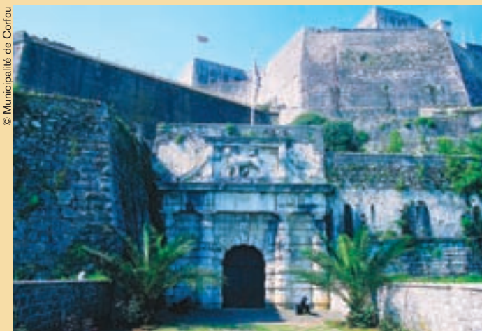
La vieja muralla junto al puerto.

Por otro lado, la Ciudad Vieja de Corfú, con su laberinto de callejuelas vivaces intramuros, actualmente también forma parte del sitio del Patrimonio Mundial. Caracterizada por una arquitectura de estilo italiano, ostenta varias iglesias ortodoxas orientales (una de ellas contiene los restos momificados de San Spiridion) mientras que su amplia explanada incorpora un campo de críquet muy británico. Corfú posee una identidad única por su estructura y su forma, su estilo de vida, sus manifestaciones artísticas y su literatura, por haber asimilado por ósmosis tanto las peculiaridades de Oriente como de Occidente. Este conjunto se ha conservado casi enteramente intacto hasta nuestros días, y el reconocimiento del Centro del Patrimonio Mundial le ayudará a cobrar ímpetu