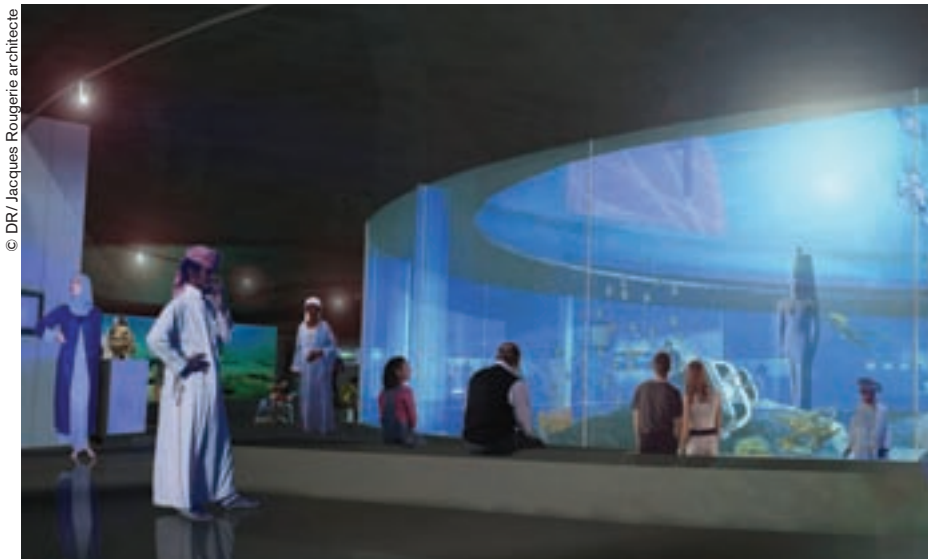
Proyecto de interior del futuro museo submarino de Egipto.

Pero el hombre sigue siendo un peligro. Entre los buceadores existen ciertas ovejas negras que bajo la apariencia de realizar una práctica deportiva en realidad vienen a pillar los sitios. Para apreciar mejor el valor intrínseco de estos lugares, Florian Huber ha creado un grupo de trabajo sobre arqueología marítima y de agua dulce (Amla), que propone cursos periódicos destinados a los buceadores. "Proteger los pecios es sumamente difícil. La única posibilidad es sensibilizar a la gente". Además, estos frágiles vestigios pueden sufrir daños también a causa de las redes de pesca en alta mar, las tempestades o un pequeño molusco llamado broma (Teredo Navalis) que, practicando