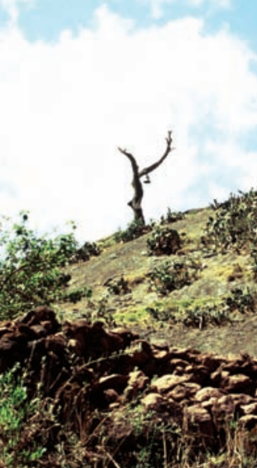
Pequeña colina en Lalibela, llamada Monte Tabor, lugar de la transfiguración de Cristo, en Galilea.

sus tres plantas. “Las ventanas de la planta baja son ciegas, pues esa planta pertenece a Noé”, explica Muchaw, uno de los guías oficiales del sitio. “Es para impedir que entre el agua del diluvio”, agrega con una sonrisa.