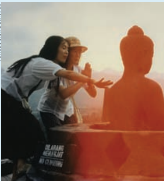
Turistas en Borobudur, sitio del Patrimonio Mundial de la UNESCO (Indonesia).