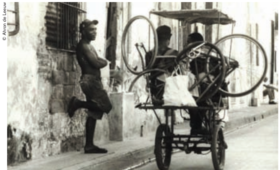
Escena de la vida cotidiana en Camagüey.

Camagüey está lleno también de iglesias lo que le ha valido el calificativo de ciudad de los templos. Ellos ostentan una sola torre. Entre todos merece mencionarse el complejo arquitectónico integrado por Nuestra Señora del Carmen, el Convento de las Madres Ursuli-