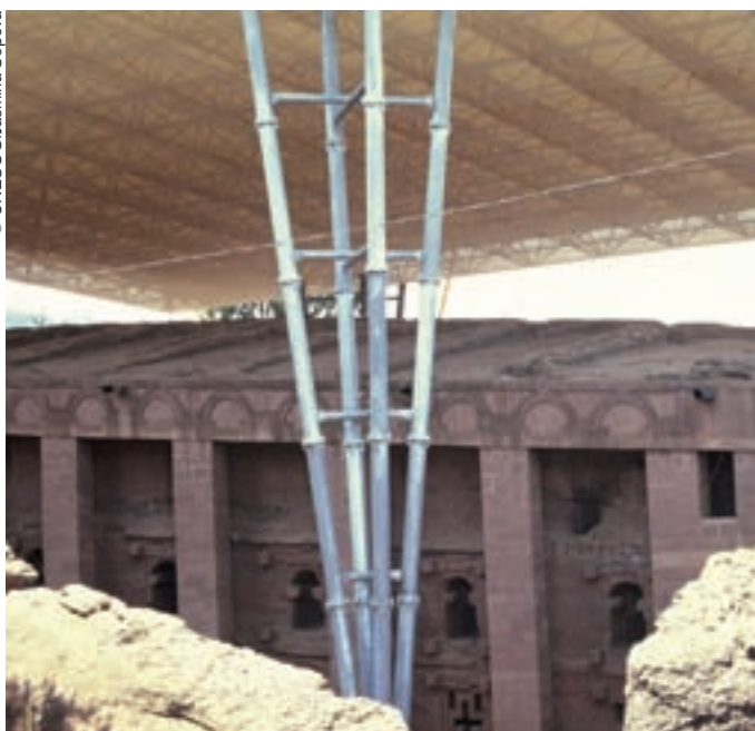
Betha Medhane Alem, la iglesia más grande de Lalibela bajo una moderna techumbre de protección.