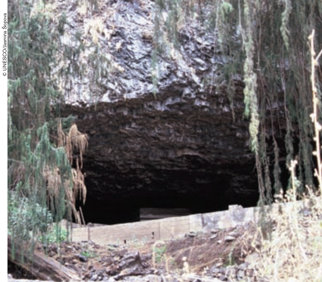
Iglesia dedicada a Neakutdeab, hermano menor del rey Lalibela, construida bajo esta enorme roca.

A medio camino, abandonamos la pista y, de repente, un inmenso acantilado, que domina el paisaje como una maciza nube petrificada desde hace siglos, se nos echa