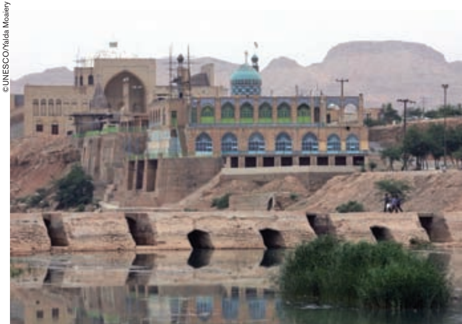
La presa de Band-e Miza en Khuzistán (Irán) forma parte del sistema hidráulico histórico de Shusta, inscrito en la Lista del Patrimonio Mundial.

La Convención de 1972 sobre la Protección del Patrimonio Mundial Cultural y Natural constituye sin duda alguna el instrumento internacional más ampliamente reconocido y el más eficaz en materia de preservación. Uno de sus principales objetivos es "identificar, proteger, conservar, revalorizar y transmitir a las generaciones futuras el patrimonio cultural y natural". Es decir que, cuando un sitio ingresa en la Lista, el proceso no termina allí sino que acaba de comenzar.