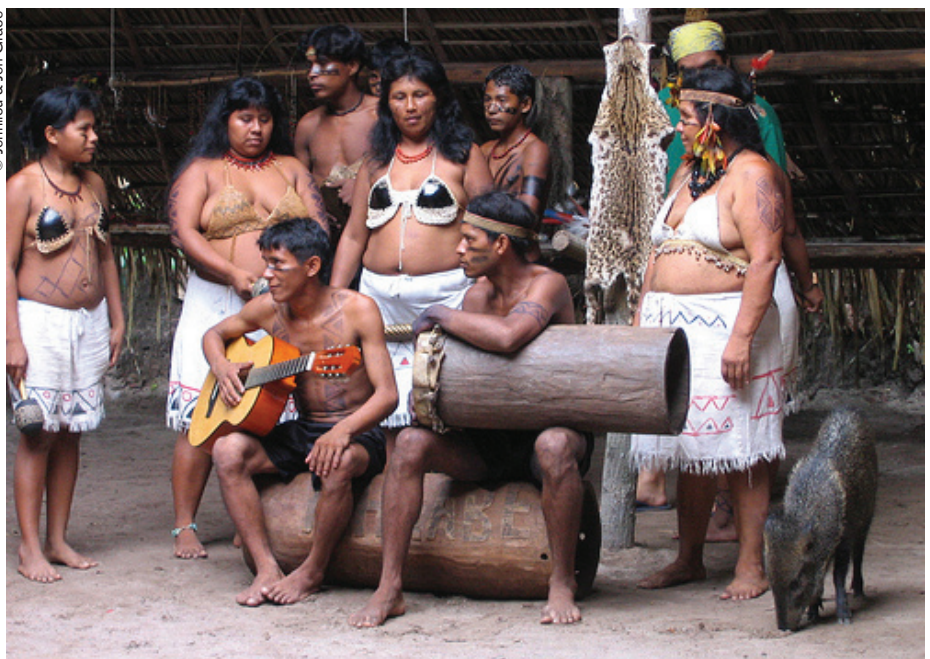
Amazonia (Brasil): varias lenguas indígenas están desapareciendo. Hasta mediados del siglo XVII, el tuli, por ejemplo, estaba tan extendido como el portugués.