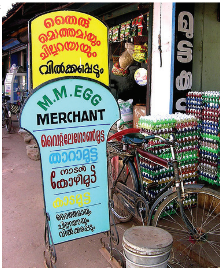
En publicidad, todos los idiomas sirven.

La Torre de Babel india tiene forma de pirámide y en su cúspide se hallan el hindi y el inglés, dos lenguas que son extranjeras para dos tercios de la población. Luego están las lenguas oficiales de los distintos Estados y territorios (lenguas regionales), seguidas por las lenguas minoritarias que están desprovistas de funciones administrativas, a pesar de ser habladas por más un millón de personas cada una. En la parte más baja de este imponente edificio hay centenares de lenguas más, por cuya situación vela un comisario encargado de las minorías lingüísticas, que carece de poder de decisión y sólo puede emitir dictámenes.