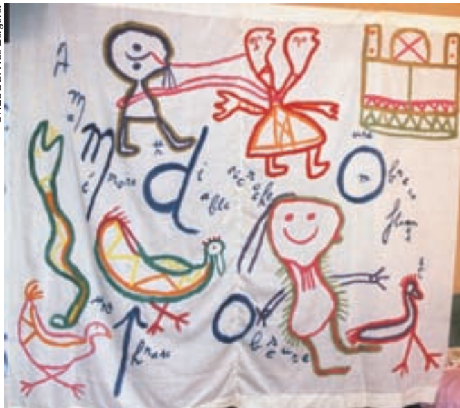
Según la tradición, la cobra es guardiana de la lengua toro tegu, que se habla en el territorio dogón (Mali).

Es mi vigésimo día de trabajo con los pintores dogón de Koyo, en lo alto de su montaña tabular, en el norte de Mali. En lo oscuro de la noche, estamos tendidos sobre esteras ante la casa de tierra en pleno corazón de la aldea que me atribuyeron; los pintores campesinos y yo estamos exhaustos, pero felices por los poemas sobre tejidos que acabamos de crear a pleno sol. El más joven de los pintores prepara té. La conversación tiene por tema los ancestros.