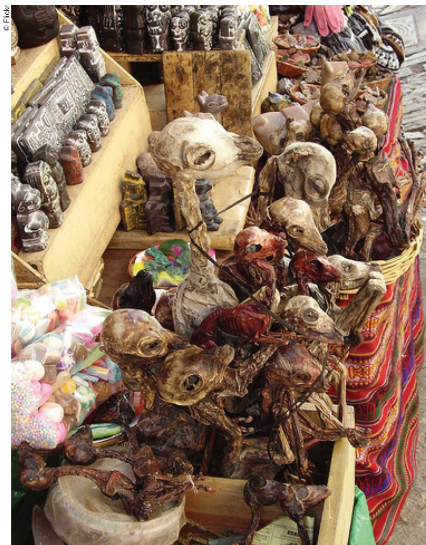
Mercado en el que los kallawayas adquieren sus productos. La Paz.