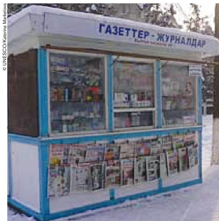
Quiosco de prensa en Bichkek, capital de Kirguistán.