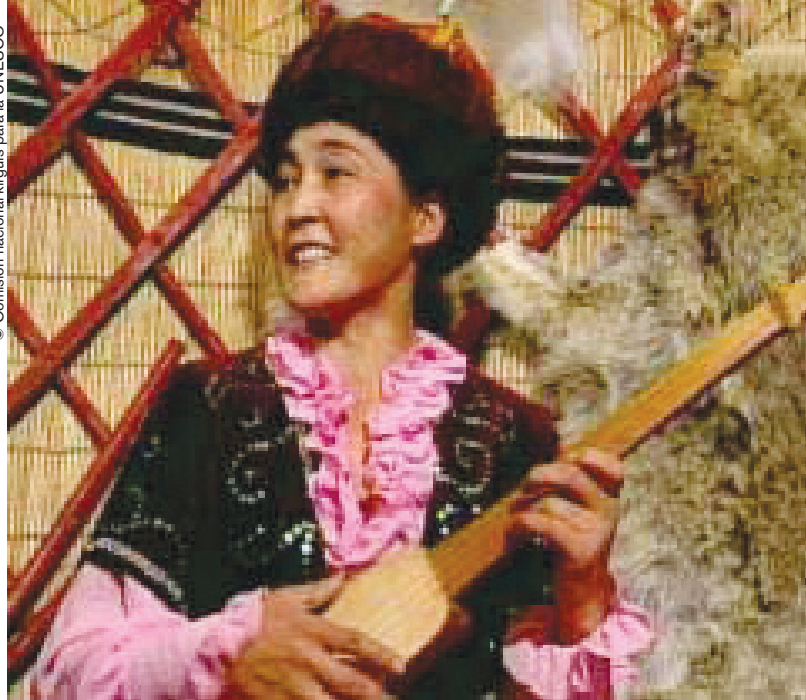
En 2003, el arte de los akyn fue proclamado por la UNESCO obra maestra del patrimonio oral e inmaterial de la humanidad.