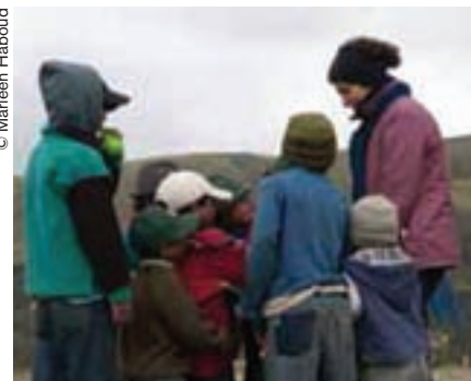
La transmisión de una lengua a los más pequeños es fundamental para su supervivencia.