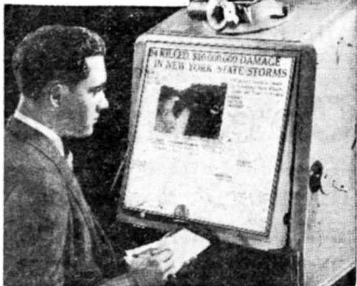
Un aparato de lectura de microfilms.

La Unesco anunció el 19 de agosto que diez y seis aparatos para lectura de microfilms habían sido depositados en las respectivas Embajadas en París de siete países devastados por la guerra.